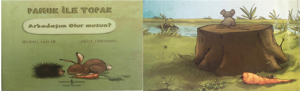
Resim 1. K5, Michael Engler, 2018, Pamuk ile Topak arkadaşım olur musun?, Resimleyen Joëlle Tournalias

Bu araştırmada incelenen 40 kitabın 16' sında yer alan resimlerde, karakter tarafından görülemeyen nesne ya da kişinin olmadığı 24'ünde ise karakter tarafından görülemeyen nesne yada kişilerin olduğu belirlenmiştir. Bu durum incelenen kitapların % 60' ının algısal bakış açısı alma becerilerini geliştirmek amacıyla kullanılabilir nitelikte olduğunu, % 40' ının ise bu amaçla kullanılamayacağını göstermektedir. Aşağıda resimli öykü kitaplarında algısal-görsel bakış açısı almayı desteklemeye yönelik kullanılabilir görsellerden örnekler sunulmuştur.