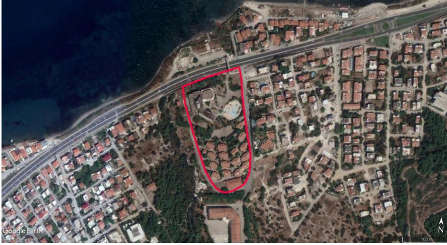
Şekil 3. Çalışma alanının konumu

Kentin EXPO 2020 sağlık temalı projeleri arasında bir öneri proje olarak kalan proje alan, büyüklük, konum, erişilebilirlik, gibi pek çok yönü ile avantajlı olan bir konumda, ağırlıklı olarak konut (yazlık konut, sürekli konut) olan bir bölgede planlanmıştır. Urla, Ege Bölgesi'nde kendi adını taşıyan Urla yarımadasının merkezinde yer almaktadır. İzmir iline bağlı ilçelerden biri olan ilçe, kuzeyde İzmir Körfezi, batıda Çeşme ilçesi, güneyde Seferihisar ve Sığacık Körfezi'nin iç kısımları, doğuda Güzelbahçe ile çevrilmiştir. Urla Yarımadası, bulunduğu coğrafi konumdan ötürü Akdeniz ikliminin etkisi altındadır (Şengün, 2007: 406). Ilıman iklimi nedeniyle her mevsim ileri yaş grubunun ilgisini çeken bir bölgedir. Urla ikliminin yanı sıra tarihi dokusu, kültürü, kıyı alanları ve pek çok gezi alanına sahip olması ile de turizmi özellikle ileri yaş turizmini destekleyecek çeşitliliğe sahip bir yerdir. Urla İskelesi, Yücesahil, Yıldıztepe, Çeşmealtı, Denizli, Zeytinalanı mahalleleriyle, Balıklıova, Kadıovacık, Uzunkaya, Zeytineli ve Yağcılar Köyleri gerek sahil gerekse sahip oldukları ormanlar bakımından ilçenin turizm potansiyelinin önemli mevkilerindedir. Yaz aylarında Kalabak sahilinden, Balıklıova sahillerine kadar uzanan yaklaşık 40 km.'lik sahil bulunmaktadır (T.C. Kültür ve Turizm Bakanlığı, b.t.) Prehistorik ve Antik Dönem'den izler taşıyan Liman Tepe ve tarihi M.ö. 600 yıllarına kadar uzanan Klazomenai zeytin ışığı, gibi yerler bölgeyi turizm yönünden avantajlı kılmaktadır.