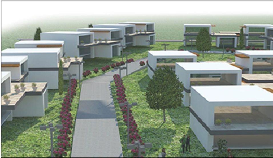
Şekil 5. İKÇÜ Yaşlı Bakım ve Rehabilitasyon Merkezi öneri projeden görünümler