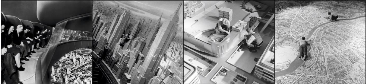
Şekil 1. 1939 New York Expo-Yarının Dünyasını İnşa Etmek Sergisinden Görseller (Cosgrove, b.t.)

İlk dönem fuarlarda sanayi, tarım ve sanata dair temalarla düzenlenirken, buna sonraki yıllarda ulaşım, bilim, spor ve insana dair konular da eklenmiştir. 1920'lerle birlikte fuarlar geleceğe yönelik öngörülerini fuarlarda sergilemeye başlamışlardır (Şekil 1). 2000'li yıllara kadar insanı odağa alan ve hümanizm, barış gibi temaları içeren kurgularda 2000 sonrasında küresel bir sorun ve geleceğe yönelik olarak doğaya ilişkin temalar artmaya başlamıştır. Doğa, su, sürdürülebilirlik ile birlikte yaşam ve enerji konularında da temalar üretilmiştir.