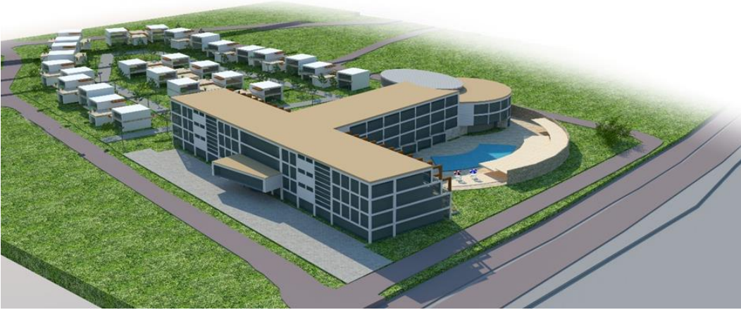
Şekil 4. İKÇÜ Yaşlı Bakım ve Rehabilitasyon Merkezi öneri projeden genel bir görünüm

Urla, yaşlıların, zamanla ortaya çıkan değişimler sonucu oluşan gereksinimlerinin ve taleplerinin birçoğuna cevap verebilmektedir. Projenin bulunduğu bölgenin ileri yaş turizmi için sağladığı fırsatlar düşünülünce İzmir Katip Çelebi Üniversitesi Yaşlı Bakım ve Rehabilitasyon Merkezi projesinin konumu ile fonksiyonu birbiriyle tam olarak örtüşmektedir. Proje alanı yaklaşık 26000 m 2 lik bir alanda, İzmir-Çeşme yolu ile kıydan ayrılmış, ağırlıklı olarak konutları bulunduğu bir konum da yer almaktadır. Mevcut yapıların deprem riski açısından tehlike olduğu ve yıkılması kararı halen gündem de olan bir konudur. İzmir Katip Çelebi Üniversitesi yönetimi tarafından mevcut yapılarının yıkılması ve alanın İzmir Katip Çelebi Üniversitesi Yaşlı Bakım ve Rehabilitasyon Merkezi olarak sağlık teması ile yeniden işlevlendirilmesi kararının ardında proje çalışmaları başlamıştır (Şekil 4).