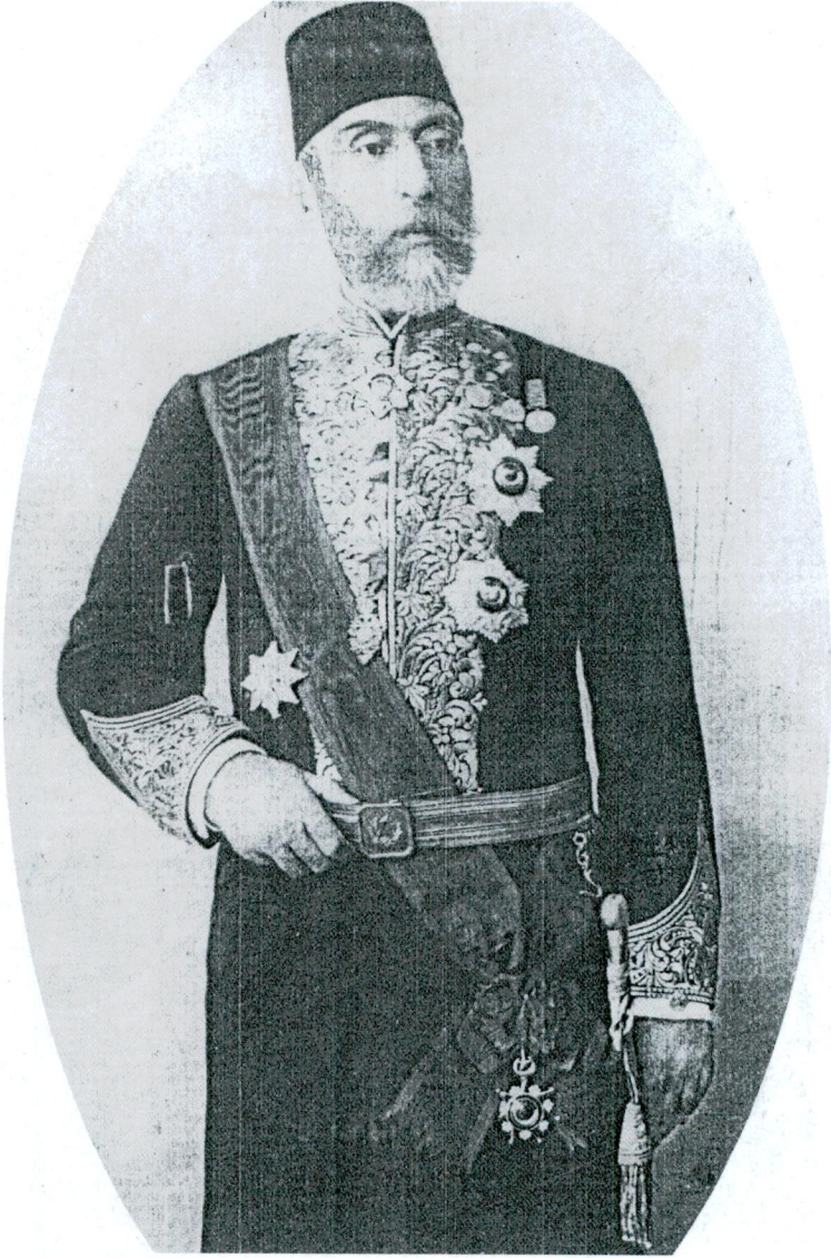
Ömer Âli Bey 1898'de ( Malumât , VII/164/883)