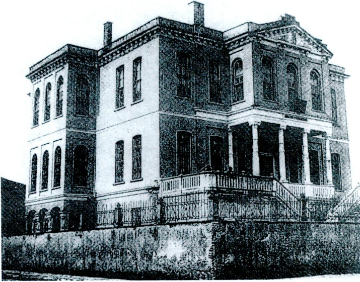
Ömer Âli Bey'in Tekirdağ'da yaptırdığı Hükümet binası sonradan genişletilmiştir.