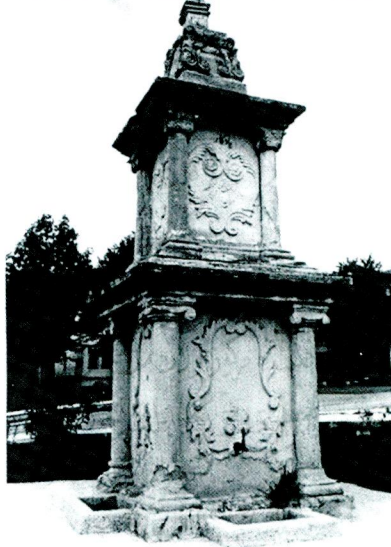
Ömer Âli Bey'in Kastamonu'da yaptırdığı abide/çeşme (Yâdigâr Çeşmesi)