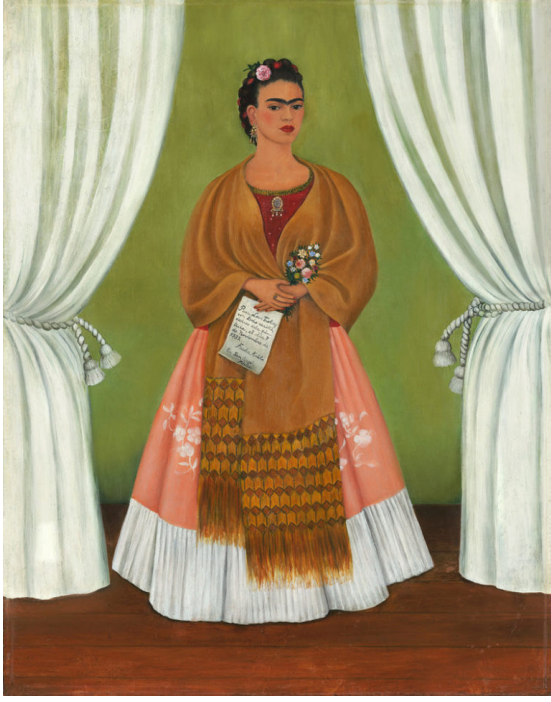
Resim 4. Frida Kahlo'nun 1937 yılında yapıp Leon Trotsky'ye armağan ettiği tablosu, National Museum of Women in the Arts

Üç ilişkide de erkek, sanat arenasında göz dolduran bir konuma sahiptir. Rivera duvar resimleriyle, Pollock damlatma / akıtma tekniğine bağlı doğaçlamalarıyla, Eyüboğlu ise sanat eserinin faydalı olmaması gerektiği yönündeki savı çürütmesiyle dönemine damga vurmuşlardır. Bu neden ile kendileri gibi ressam olan eşlerine oranla çok daha ünlü olmalarında kabul edilemeyecek bir yan yoktur. Bu kaideyi bozan tek istisna Frida Kahlo'dur. Kahlo, belki bir öncü sanatçı değildir ama kocası Rivera'nın dünya görüşünü büyük oranda paylaşmasına rağmen sanatta kendi rotasını çizme dirayetini gösterebilmiştir. Lee Krasner ve Eren Eyüboğlu için bunu söylemek -sanatsal açıdan- mümkün değildir.