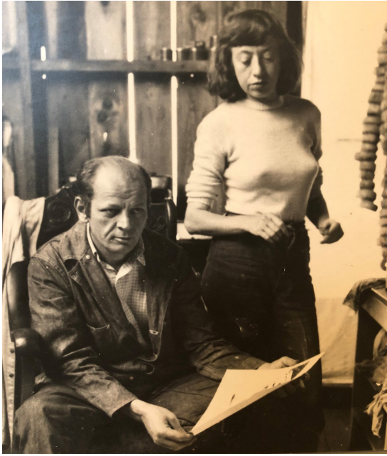
Resim 3. Jackson Pollock ve Lee Krasner, East Hampton'da, 1949

geniş bir çevreye sahip olan Krasner, 1943 yılında Pollock'u, New York'un en ünlü sanat taciri olan Peggy Guggenheim ile tanışır. Guggenheim, danışmanlarından da onay alınca genç ressama bir şans tanımaya karar verir ve onunla sözleşme imzalar. Fakat bir süre sonra başına bela aldığını fark eder; Pollock çok sık sarhoş olup memnuniyetsiz davranışlarıyla çevresini sıkmakta, sürekli sorun çıkartmaktadır. Yine de Guggenheim, sözleşmeyi feshetmez. Yıllar sonra bu kararını şu sözler ile açıklar: "Bu koşullarda söylenebilecek şey, Pollock'un berbat durumda olduğuydu. Bununla birlikte, -şikâyetçi olduğumda Krasner'in de işaret ettiği gibi- bir de melek yanı vardı" (Guggenheim, 1980: 73).