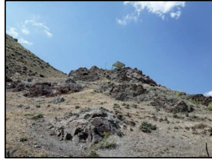
Resim 26 : Han/Sarıkaya köyünün kuzeydoğu yükseltisi üzerinde bulunan mezar.

Selepür/ Ocakbaşı: Sansa Boğazı'nın kuzeyinde konumlanan köylerdendir. Sele-pür olarak ayrımlandığında, "sele/selia/selinti" gibi söyleyişleri Ashirand kıtasında yaygın olan "güzel" anlamıyla, "pür"ün ise "hisar" la ilişkisi kurulabilir. Hayaşa halkının Luwi diliyle de bağının olduğu, en azından bu dili de kullandıkları bilinmektedir. Köye yakın olan Altıntepe buluntularının birinin üzerinde Luwice bir yazı bunun kanıtları arasındadır. Hititçe ve Luwicede de "sela" güzelle ilişkilidir. 19 Hayaşa kültürünün taşıyıcısı ve önemli ölçüde bu