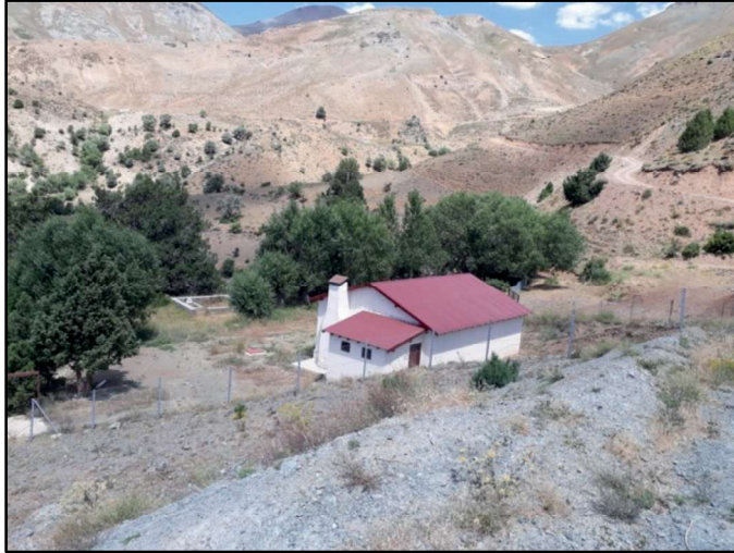
Resim 47: Karacalar Ziyareti genel görünüşü.

Karacalar Ziyaret: Karacalar köyünün doğusundadır. Ziyaret alanında su kaynağı ve yaşlı ardıç ağaçları bulunmaktadır.