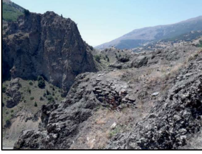
Resim 14: Gülfırat Kalesi'nin duvar kalıntılarının ayrıntı.