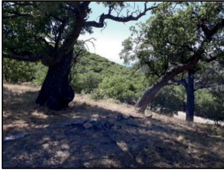
Resim 4, 5, 6: Ziyaret niteliği de olan mezarlıklardan biri. Mezar unsurları arasında yer alan kabartmalar, tüm bölgeye özgü geleneğin bu mezarlıkta da yaşatıldığı görülmektedir. Bu ziyaret alanı Pelitli köyü ile Derebük mezarası arasında bulunmaktadır.

Sansa Boğazı, Sansa ve Bağlar Köyleri: Sansa Boğazı, Erzincan il merkezinden 40/45 km doğuda, kuzey ve kuzeybatı yönünde gidilen yolların kavşağındadır. Kuzeyindeki Keşiş Dağlarının eteklerinde konuşlanmıştır. Güvenlik için yapılan kale ve bazı gözetleme kuleleri aracılığıyla yöreyi kontrol altında tutan mevki özelliğiyle de önemlidir. Bu niteliğini daha İlk Çağ'da kazandığı, bugüne kadar varlığı gelen Sansa Kalesi'nden apaçık görülmektedir. Denilebilir ki, Erzincan'ı doğu, kuzeydoğu ve güneybatıdaki bölgelere bağlayan en önemli geçitlerden biridir.