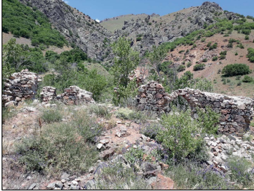
Resim 66: Sırıklım Kilisesi harabesinin genel görünüşü.