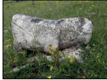
Resim 31: Selepür köyü çevresinde bulunan koç heykelleri