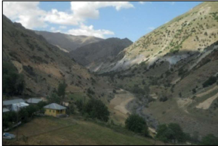
Resim13: Sarıkaya- Kureyşan Vadisi'ndeki söylencelerden biri de Hz. Ali'ye ilişkindir. Resimde görülen Sarıkoç köyü ve vadisidir. 2 km kadar kuzeyde, Gülfırat Kalesi mevkinin karşında, yüksek ve görece küçük bir sekide, çapı 4 m olan kısmen yuvarlak bir kaya bulunur. Benzeri olan bir kaya ise vadi tabanındadır. Anlatıya göre; “Hz Ali kalenin alınması için ilk kayayı savurmuş ve kale surunun önemli bir kesiti yıkılmıştır. İkinci kayayı atmadan kale yöneticileri teslim olmuş, Hz. Ali de bu ikinci kayayı seki üzerinde bırakmıştır.” (Kaynak kişi: Nazim Gülhan ).