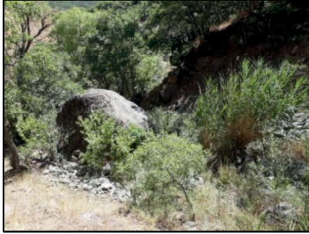
Resim 33: Kolukomu- Derebük Ziyareti kayası.

Kolukomu/Derebük Köyü ve Ziyareti: Halk arasında yine Türkçe, fakat Zazaca ağzı ile “Dere-jare” de denmektedir. Osmanlı kayıtlarında Kom olarak geçen köyün 1516’da 11 hâne 3 mücerred, 1591’de 50 nefer nüfusu vardır.