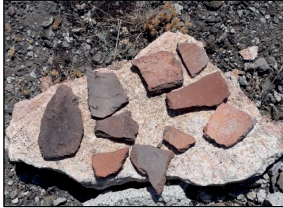
Resim 18: Gülfırat Kalesi'nin yüzey keramik örnekleri