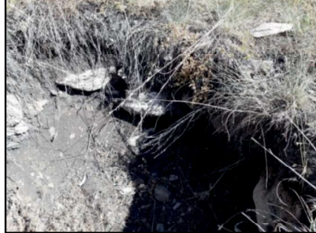
Resim 52: Canbek Kalesi içerisinde yapılan kaçak kazılarla ortaya çıkan ve deforme edilen duvar örneği.