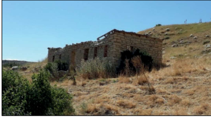
Resim 48: Canbek köyünden..

Yaklaşık 5 dönüm bir alanında yer alan kalenin çevresinde dış surlarına ait olduğu anlaşılan izler hâlâ görülmekle birlikte günümüze kadar gelememiştir. Yüzeyde görünür durumda olan, iç kale duvarları ve bazı yerleşimlerine ait yıkık duvar temellerine ait taş unsurlar oldukça dağılmıştır.