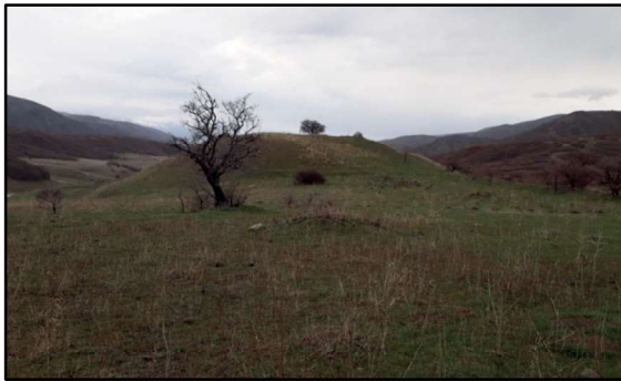
Resim 38: Kolukomu/Derebük- Mir Çeşme Höyük. Doğudan genel görünüşü.

Höyük: Erzincan'ın 40 km kadar doğusunda, Sansa Boğazı'nı ve Mutu mevkiğini geçtikten sonra kuzeye yönelen yol üzerindedir. Yol, Kolukomu/Derebük üzerinden 1 km sonra sola dönülüp Selepür'e, sağa dönülünce Bulanık, Karacalar, Zurun vs. yönünde devam etmektedir. Bu yolun İlk Çağ ve sonrasında kullanılan kadim yollardan biri olduğunu kanıtlayan önemli bir kalıntı da Kolukomu/Derebük köyüne gitmeden, bugün İpek Yolu adı verilen yol üzerindeki bu höyüktür.