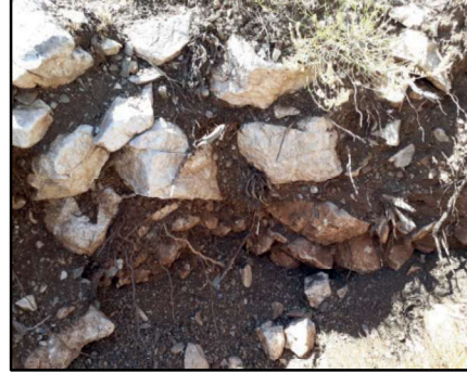
Resim 43: Karacalar Kalesi'nde yapılan kaçak kazılarla ortaya çıkarılan ve yapısı kısmen bozulan konut temeli.