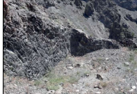
Resim 17: Gülfırat Kalesi'nin üzerinde bulunduğu ana kaya üzerinde tıraşlanmış sathınlardan biri.