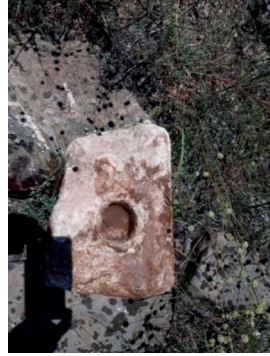
Resim 62: Bulanık - Sırıklım Kilisesi'nde bulunan taş objelerden biri.