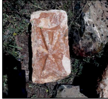
Resim 58 : Bulanık- Sırıklım Kilisesi haç taşlarından biri.