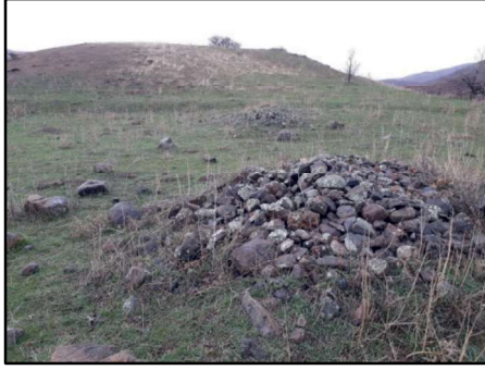
Resim 39: Kolukomu/Derebük- Mir Çeşme Höyük'ün çevresindeki yerleşim alanında bulunan ve tümülüs karakterinde taş yığıntılarından.