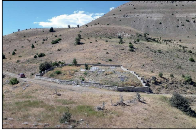
Resim 53: Canbek mezarasının batısında, Canbek Kalesi'nin kuzeyinde bulunan mezarlık alanı.