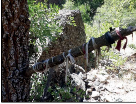
Resim 36: Kolukomu/Derebük Ziyareti'nde bulunan ve dallarına bez parçası bağlanan ağaçlardan biri.

Şavşek/ Esenyurt: Cibice Boğazı'na hakim bir konumdadır. Hormekli Aşireti'ne mensup bazı aileler tarafından iskân olunmuştur. Konar-göçer Türkmen aşiretlerine özgü inanç ve geleneklerin korunduğu yerleşimlendendir. "Şavşek", benzetme yoluyla yapılan Türkçe kelimelerdendir. Köyün doğusunda çamlık bir alan ve Kargın'a kadar giden taş yol bulunmaktadır.