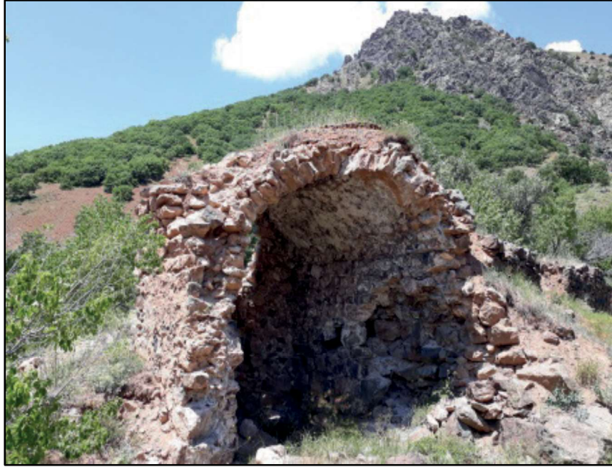
Resim 64: Bulank - Sırlım Kilisesi.