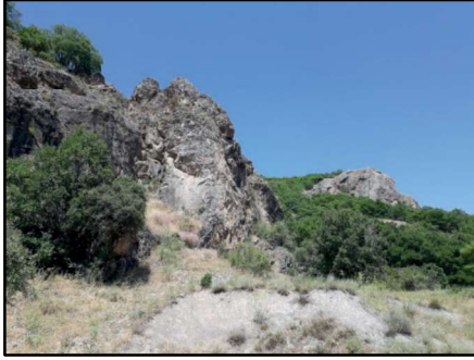
Resim 57: Değirmendere mevkesinin batıdan görünüşü.

Sırıklım Kilisesi: Erzincan'ın kuzeydoğusunda Bulanık köyünün kuzey doğusunda, Zurun (Derviş Cemalli) köyünün 5 km kuzeybatısındadır. Yöre halkı buraya da "Vank" demektedir. Ne var ki oldukça harap edilmiş eski ve fakat önemli olduğu anlaşılan dinî yapılar arasındadır.