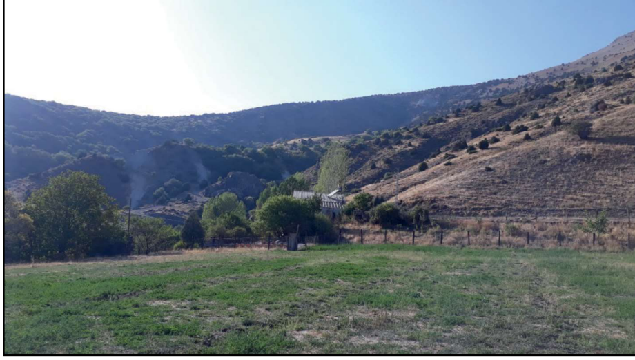
Resim 9: Hıdanlı/Bağlar köyünün güneybatısında yer alan eski yerleşim alanı.

da demektir. Köyün hemen güneyinde ikinci bir kale mevki daha bulunmaktadır. Bu alanda daha önceden bir kilisenin var olduğu bilgisi edinilmiştir. Daha önce aynı mevkiden üzüm kabartmalı bir taşın bulunduğunu tespit etmekle birlikte, henüz görme imkânı bulamadık. Yörede üç ziyaret alanı vardır: 1. Şengül, 2. Ağbaba (Galot) ve 3. Kıymet Dede.