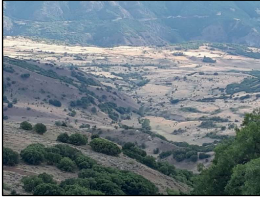
Resim 30: Kırmızı Ziyaret'ten güneyde Sansa Boğazının görünüşü.

Selepür - Kırmızı Ziyaret: Selepür köyünün kuzeydoğusunda Kırmızıtepe yükseltisi üzerindedir. Toprağının rengi nedeniyle “Kırmızı Ziyaret” olarak anılmaktadır. Mevkide ardıç ve meşe ağaçları örtüsü bulunur. Ziyaret noktasında kaynak suyu vardır ve çevreye uyumlu biçimde çeşme inşa edilmiştir. Bazı kitablesiz mezarların yer aldığı ziyaret oldukça bakımlı ve ziyaretçilerin ihtiyacına uygun olarak tanzim edilmiştir.