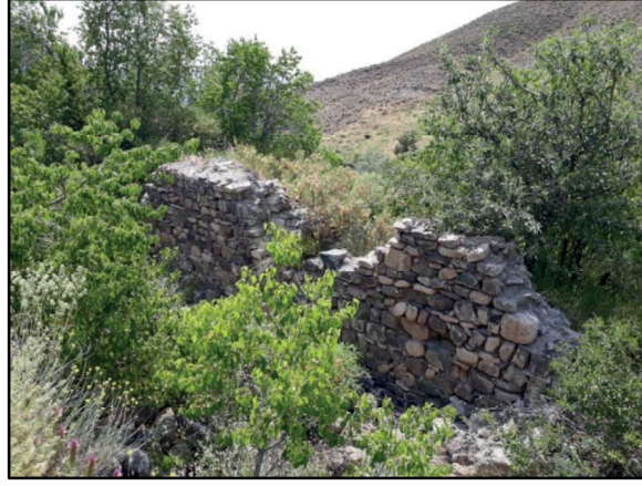
Resim 2: Zurun Hanı'nın duvar kalıntılarında.

Gerek Orta Asya Türk ananelerinde, gerekse Azzi / Hayaşa coğrafyasında geyik için özel bir ilgi duyulduğu bilinmektedir. Orta Asya'nın Umay-Ana'sıyla ve Azzi/Hayaşa'nın Anahita'sı; gökyüzünde Ay, yabancı yaşamda ise geyikle anılırlar. 13 Zurun Yaylalarındaki göletlerden biri halk arasında "Geyik Gölü" olarak söylenir.