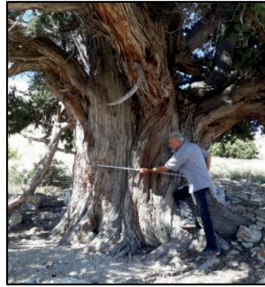
Resim 54-55: Canbek ziyaret ardıç. Gövdesinin orta kesminde çapı 6.40 cm' dir. En az beş asırlık bir geçmiş olmalıdır.