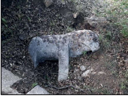
Resim 28: Selepür köyünde sağlam kalabilmiş koç heykellerinden biri. En az üç koç heykeli maalesef kayıptır.