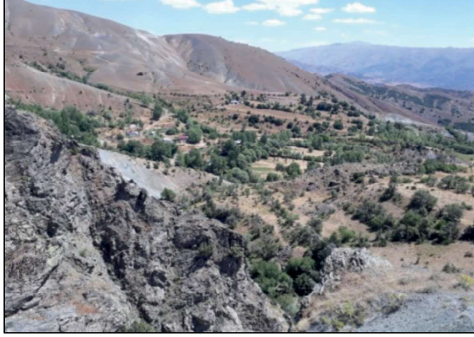
Resim 46: Karacalar köyü ve çevresi.

Kalede özgün olan unsurlardan biri ona kayanın güneyindeki dikili formdaki kaya çıkıntısında yer alan ve beyaz renkte bulunan bir resmin anlamı çözülmemiştir. Ancak üretim, bereket ve depolama sembolü olabileceği düşünülebilir