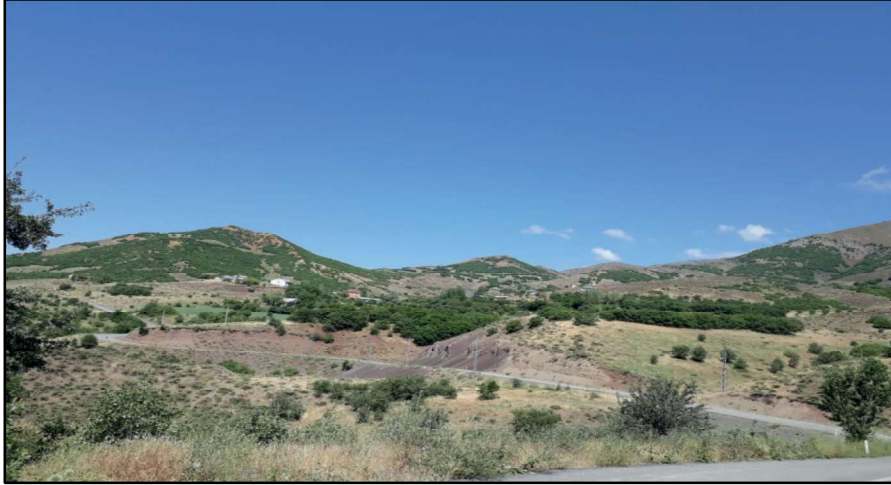
Resim 68: Bulank köyü ve çevresi.