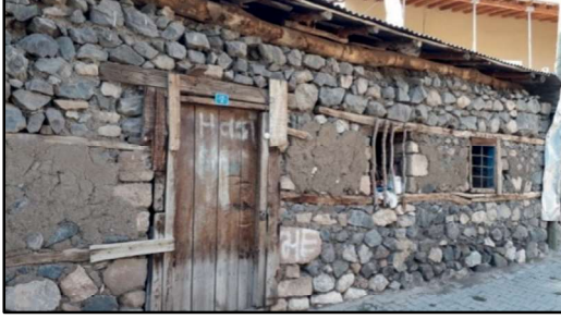
Resim 10: Hıdanlı/Bağlar köyünün geleneksel konutlarından biri.

İrili ufaklı çok sayıda çay, dere ve kaynakların bulunduğu yörenin doğal bitki çeşidi; meşe, fazla bir alanda olmasa da çam ve ardıç gibi iğne yapraklı ağaçlar, yaz aylarında büyüyüp yeşeren, güzün kuruyup ortadan kalkan ot örtüsünden oluşur. Karasal bir iklim egemendir.