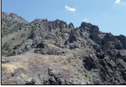
Resim 16: Gülfırat Kalesi'nin güneybatıdan genel görünüşü.