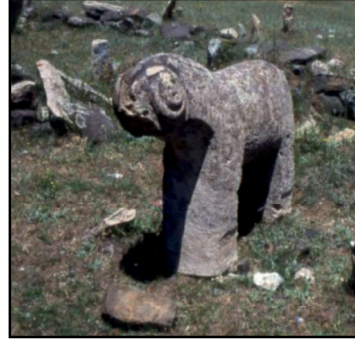
Resim 37: Şavşek köyünde bulunan koç heykellerinden biri.