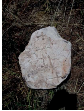
Resim 61: Sırıklım Kilisesi çevresinde bulunan ve sonradan ilintilendirildiği anlaşılan haç taşlarından bir.