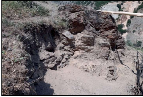
Resim 25: Daha önceleri "Han" olarak söylenen Sarıkaya köyü içinde bulunan handan bugüne kadar gelen duvar kalıntısı. Ağır gerekçeyle yapılan tesviye nedeniyle ortaya çıkan alanda birçok para (Selçuklu ve Bizans) bulun-