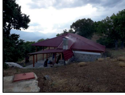
Resim 29: Kırmızı Ziyaret için yapılan hizmet binası.

Selepür - Kırmızı Ziyaret: Selepür köyünün kuzeydoğusunda Kırmızıtepe yükseltisi üzerindedir. Toprağının rengi nedeniyle “Kırmızı Ziyaret” olarak anılmaktadır. Mevkide ardıç ve meşe ağaçları örtüsü bulunur. Ziyaret noktasında kaynak suyu vardır ve çevreye uyumlu biçimde çeşme inşa edilmiştir. Bazı kitablesiz mezarların yer aldığı ziyaret oldukça bakımlı ve ziyaretçilerin ihtiyacına uygun olarak tanzim edilmiştir.