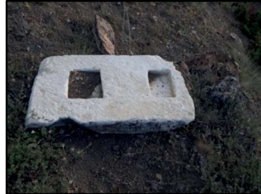
Resim 32: Selepür köyü çevresinde bulunan koç heykellerinden birine ait kaide.