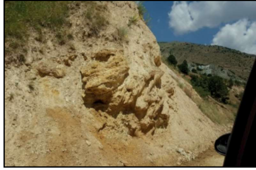
Resim 11 : Sarıkaya- Kureyşan. “Sarıkaya” adının resimde görülen sarı renkte kaya ve topraktan aldığı söylenir.

Dış surları kalenin iki yakasından akan iki çaya (Çamderesi ve Değirmendere) yakın mesafede inşa edilmiştir. Güney batısında, dış surlardan iç kaleye geçiş kapısı ve tünel, alanda yapılan hidroelektrik santrali sahipleri tarafından toprak yığını altında bırakılmış ve üzerinden stabilize yol geçirilmiştir.