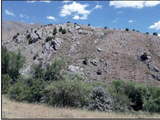
Resim 41: Karacalar Kalesi.

Karacalar Kalesi: Kale, eski Karacalar'ın kuzeyinde yer almaktadır. Keşişlerin doğusunu teşkil eden büyük dağın (Ko'opil) güney etekleri üzerindedir. Yarı parçalanmış devasa bir ana kaya üzerindedir. Solunda ve sağında su kaynakları bulunmaktadır. Batı yakasındaki küçük vadiden akan su, şelale dokusuyla yerleşime doğal bir güzellik katmaktadır. Kale güvenlik açısından oldukça stratejik bir mevkidedir. Bulunduğu konum itibarıyla Karacalar Vadisi'nin kuzeyinde gizemli bir görüntü arz etmektedir. Kalenin güneybatısında