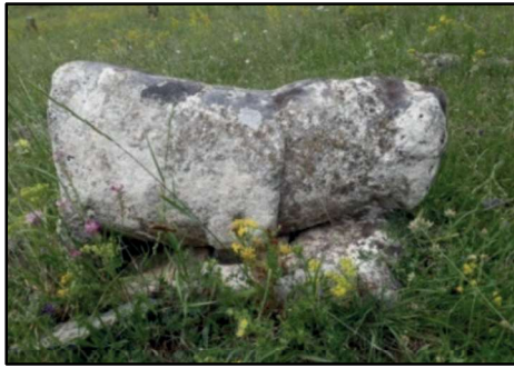
Resim 3: Zurun köyü mezarlığı ve mezarlıkta bulunan koç heykeli.

Zurun Hanı; Selepür, 16 Karacalar ve Bulanık'tan gelip Zurun'dan Mans'a giden yol üzerindedir. 15 x 30 m ölçülerinde olan Zurun Han bazı bölümlerden oluşmaktadır. Binanın kuzeyinde üç ana bölüm bulunmaktadır. Duvarlar yaklaşık 90 cm kalınlığındadır; horasan harcı kullanılmıştır ve tamamen harapdır.