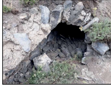
Resim 20: Gülfirat Kalesi'nin doğusunda, dış surların altından iç kalenin merkezine giden bir tünelin hâlâ görülebilmektedir. Tünelin ilk giriş yeri ve bazı bölümleri yol nedeniyle bozulmuştur.