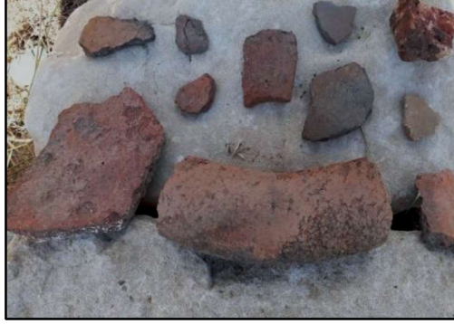
Resim 50: Canbek Kalesi yüzey keramik örnekleri.