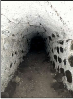
Resim 21: Gülfirat Kalesi'nin doğusunda, dış surların altından iç kalenin merkezine giden bir tünelden görünü. Bu bölüm güneyden kuzeye rampa olarak 25 m kadar gider. Doksan derecelik açıyla 5 m kadar sağa doğru devam eder. Ancak üst kaleye çıkış yeri de belirsizleşmiş durumdadır. Taşların örüntüsünde horasan harcı kullanılmıştır. 2 m yüksekliğinde ve 0.75 m enindedir.

Gulfirat Kalesi'nin doğusunda günümüze kadar gelebilen tünelleri oldukça ilgi çekicidir. Dış surların altından geçen tünelin güney tarafı yol yapımı nedeniyle bozulmuş olmakla birlikte belli bölümleri hâlâ durmaktadır. Tünelin kaleye doğru eğimli olarak devam eden bölümü 25 + 5 m'dir ve sağlamdır.