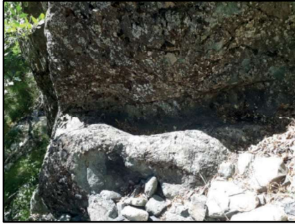
Resim 34: Kolukomu/Derebük Ziyareti’nde yer alan kayadaki oyuntunun kesit görünümü.

Kolukomu ya da Kulakomu (uyd. adı: Derebük) köyünün güneyinde yer alan bir vadi içerisinde. Başta Kolukomu olmak üzere çevre yerleşimler tarafından ziyaret addedilmekte ve kurban kesiminde bu alan tercih edilmektedir. Yeterince ihtimam gösterilmeyen ziyaret alanının doğal dokusu korunmak kaydıyla düzenlenmesi ve ziyaretçilerin kalmasına uygun bir düzenleme yapılması gerekmektedir.