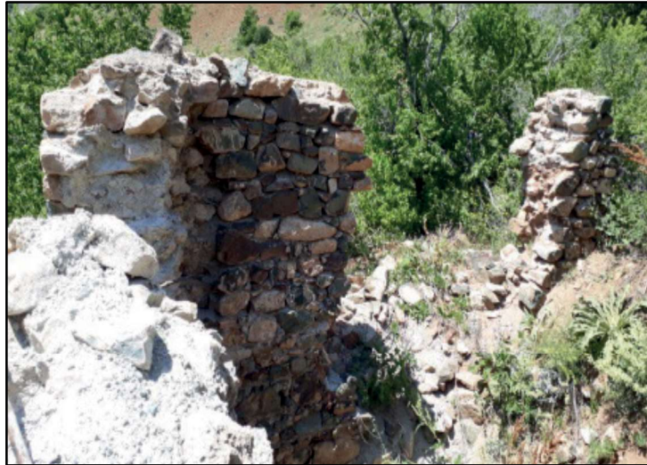
Resim 59: Bulanık - Sırıklım Kilisesi harabesi.