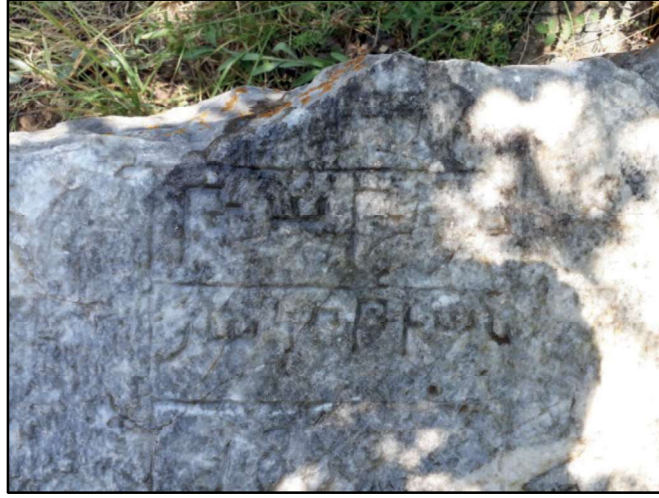
Resim 60: Bulanık - Sırıklım Kilisesi çevresinde bulunan kitabe.

Azzi/Hayaşa coğrafyasında başkaca örneklerde görüldüğü üzere, Sırıklım Kilisesi de Ortodoks Bizans/Rum kilisesi yanı sıra süreç içerisinde Gregoryen kilisesiymiş gibi bir algı verilmeye çalışılan unsurların da eklemlendiği görülmektedir. Ancak, gerek Rum/Ortodoks gerek Gregoryen/Ermeni dışında bir inanç sahibi olduklarını ima eden şifremsi unsurlar da bunu teyit etmektedir. Nitekim alttaki yazı-çizi dokusuna sahip kitabeden de bunu anlamak kolaylaşmaktadır