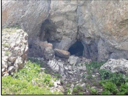
Resim 19: Gülfirat Kalesi'nin doğu yamacındaki mağaralardan biri.