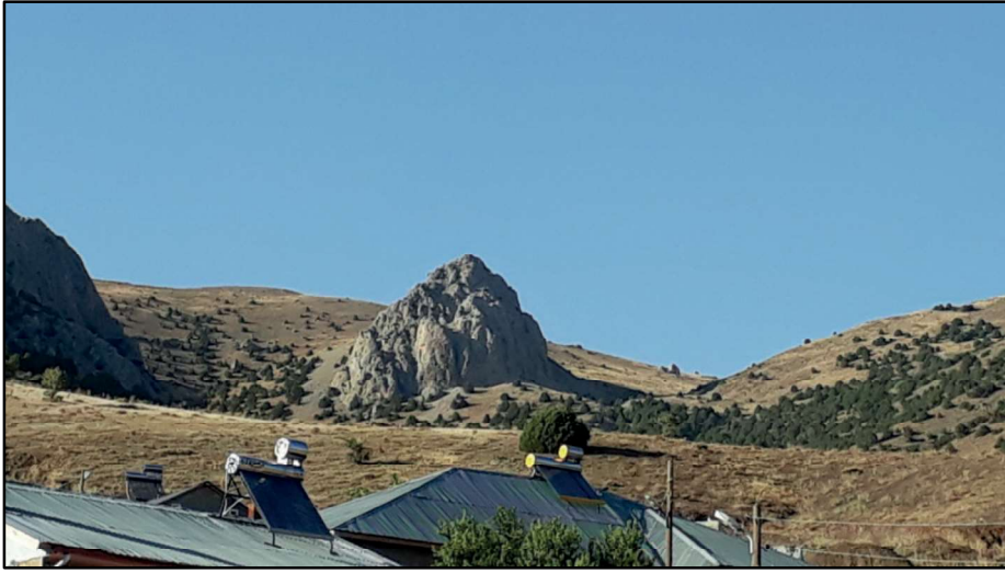
Resim 7 : Sansa köyünün kuzeyinde bulunan Sansa Kalesi (Şengül Kayası).

Erzincan- Erzurum karayolunun 2 km kuzeyinde, günümüzde Cimin'e bağlı köylerdendir.