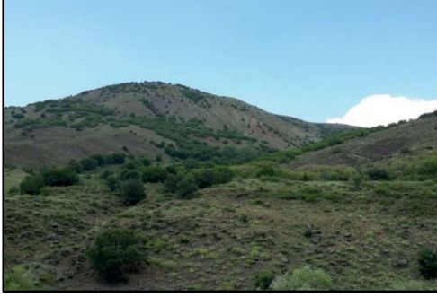
Resim 69: Kavaklı Ziyareti.

Kavaklı Ziyareti: Zurun (Derviş Cemalli) - Dalav arasında yolun 1 km kuzeyinde Kavaklı Ziyareti bulunmaktadır. Anlatılanlara göre Hz. Hüseyin ve askerleri bu yörede gizlenmişlerdir. Yezit'in askerleri geldiğinde kınalı keklıklarden biri ağaç kovuğuna saklanan imamlardan birini işaret etmiş, bunun üzerine o kişiyi şehit etmişlerdir. Yöre halkının inanışına göre o kavaklar kesildiğinde kanamaktadırlar