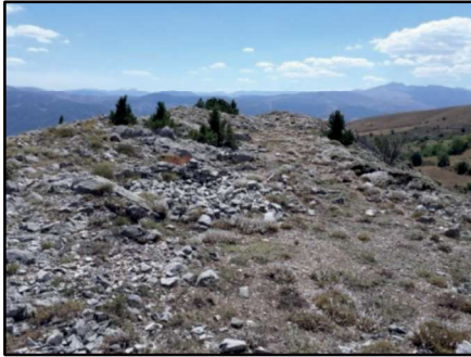
Resim 44: Karacalar Kalesi'nin yüzey görüntüleri ve konut temel kalıntıları.