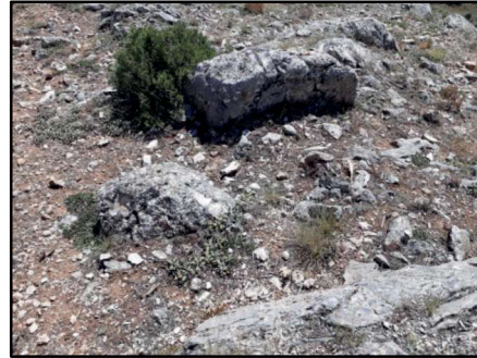
Resim 45: Karacalar Kalesi'nin içinde yer aşan traşlanmış taş sahin.

kadar yer işgal etmektedir. Bina kalıntılarının ortalama duvar kalınlığı 1m' dir. Kuzeyinde bir köşesi dik diğer uzantısı dairesel bir yapı bulunmaktadır. Buranın kule olma ihtimali vardır.