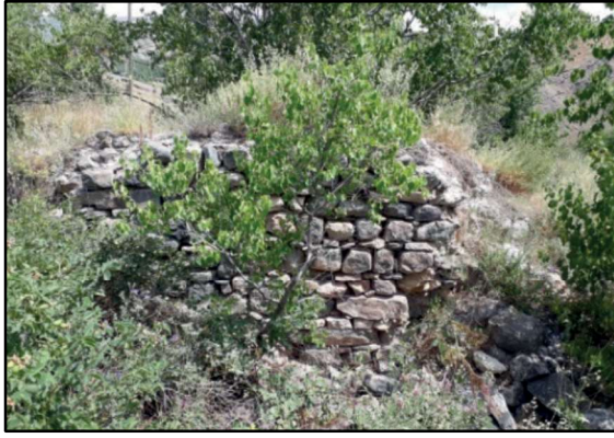
Resim 1: Zurun Han duvar kalıntılarından.

Osmanlı Dönemi yazılı kayıtlarında Erzincan- Mans- Tercan yol ve konakları zikredilirken “Derbend Ağızı” olarak da vurgulanan Çubuk Konağı, bahsettiğimiz yörenin doğuya gidiş yönünde konumlanan ilk alandır. Çubuk Konağı'nın bulunduğu yerin aynı zamanda bir yerleşim alanı (yurt sahası) olduğu, Feridun Bey'in, “Fırat kenarında Çubuk Konağı'na, der mukabele-i karye