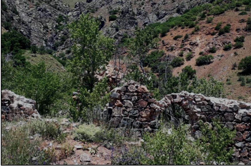
Resim 63: Bulank - Sırlım Kilisesi