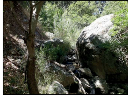
Resim 35: Kolukomu/Derebük Ziyareti’nde yer alan kaya. Gövdesindeki oyuntuyla dikkati çekmektedir.