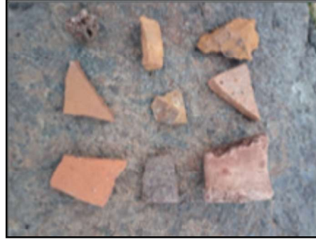
Resim 40: Kolukomu/Derebük- Mir Çeşme Höyük'ün yüzey keramik örnekleri.

Karacalar Kalesi: Kale, eski Karacalar'ın kuzeyinde yer almaktadır. Keşişlerin doğusunu teşkil eden büyük dağın (Ko'opil) güney etekleri üzerindedir. Yarı parçalanmış devasa bir ana kaya üzerindedir. Solunda ve sağında su kaynakları bulunmaktadır. Batı yakasındaki küçük vadiden akan su, şelale dokusuyla yerleşime doğal bir güzellik katmaktadır. Kale güvenlik açısından oldukça stratejik bir mevkidedir. Bulunduğu konum itibarıyla Karacalar Vadisi'nin kuzeyinde gizemli bir görüntü arz etmektedir. Kalenin güneybatısında