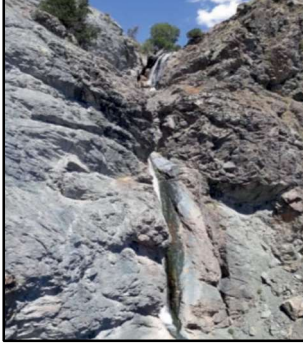
Resim 42: Karacalar Kalesi'nin hemen batısından akan çayın oluşturduğu şelale.

ve elimizdeki verilere göre Hınzoru daha büyük bir yerleşim yeri iken Karacalar Kalesi daha küçük ancak güvenlik açısından çok daha elverişlidir. Kaya kütlesi konumunda olan bir tepenin üzerindedir. Kuzey güney doğrultusunda üst bir tabla niteliğinde taş zemin üzerine inşa edilen kale 50 X200= 1 dönüm