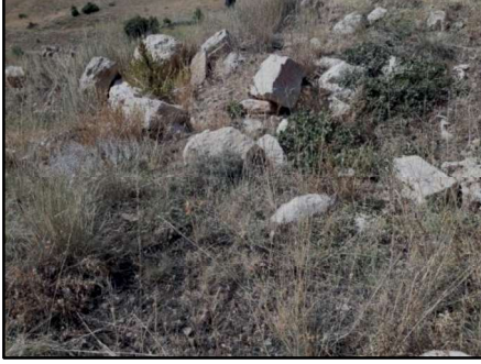
Resim 51: Canbek Kalesi yerleşimine ait konut taş örnekleri.