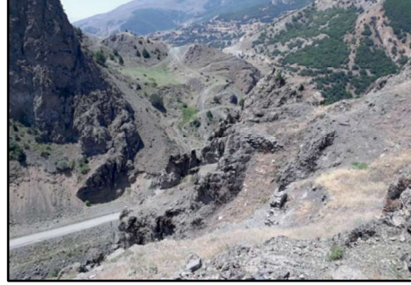
Resim 15 : Gülfırat Kalesi'nin üzerinde yer alan sur ve duvar kalıntıları.