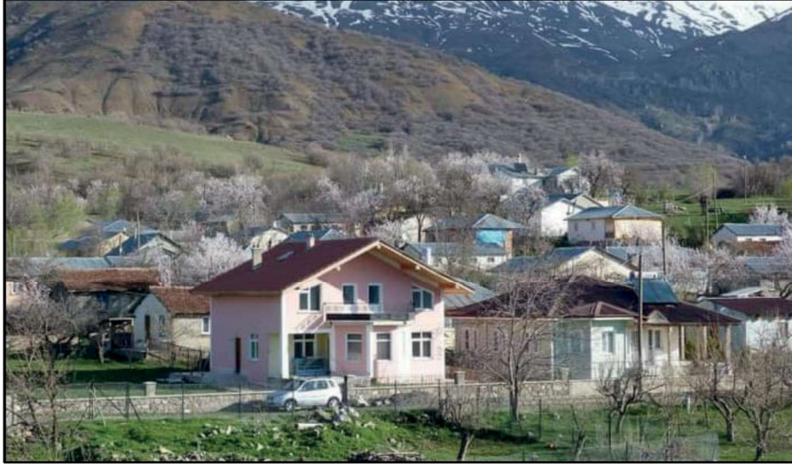
Resim 27: Selepür köyünden bir görünüm.

“Selepür”ün etimolojik açılımı yanı sıra yörenin siyasal geçmişiyle de bağıntısını görmemiz gerekir. Bilineceği üzere, İskender İmparatorluğu’nun dağılışı sonrasında ortaya çıkan Hellenistik devletlerden biri de Selevkoslardır. Her ne kadar Selevkos/Selüisitlerin bu yörede köklü toplumsal-kültürel bir etkinliği olmasa da siyasal egemenliklerini sağlamak zorunluluğu nedeniyle bazı girişimlerde bulunabileceklerini anlamak zor değildir. Bunun pratik yöntemlerinden biri, askerî garnizonlar oluşturmak, bölgenin konumuna göre stratejik mevkilerde konumlanmaktır.