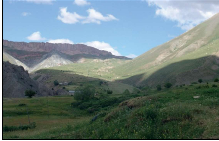
Resim 12: Kureyşan Vadisi'nin kuzey bölümü. Erzincan – Mans arası kadim yollardan birisi bu yöre üzerindedir. Resmin arka planında görülen menekşe renginde ve set biçimli doğal kaya uzantısının güneybatı alt seki alanı anonim “Kerem ile Aslı” hikâyesiyle ilişkilendirilmiştir. Hikâyenin yöresel anlatımlarında bu coğrafyada yer alan kaya kitlelerine, mağaralara, kadim yollara ve kervansaraylara yer verilmiştir. (Kaynak kişi: Nazim Gülhan )