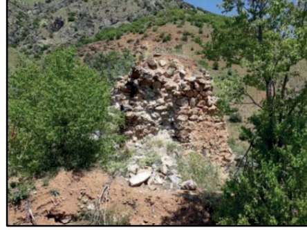
Resim 67: Sırlım Kilisesi çevresi görüntüleri ve binaya ait bazı görüntüler.