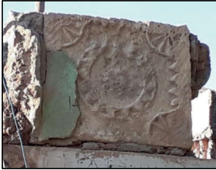
Resim 8: Sansa köyü içinde bulunan eski konutların birinde bulunan motif kabartmalı taş.

Sansa Kalesi: Bugünkü Sansa köyünün 2 km kuzeyindedir. Ana kaya üzerine inşa edilmiştir. Kale mevkindeki sur duvar kalıntılarının Roma Dönemi'ne ait olduğu görülmektedir.