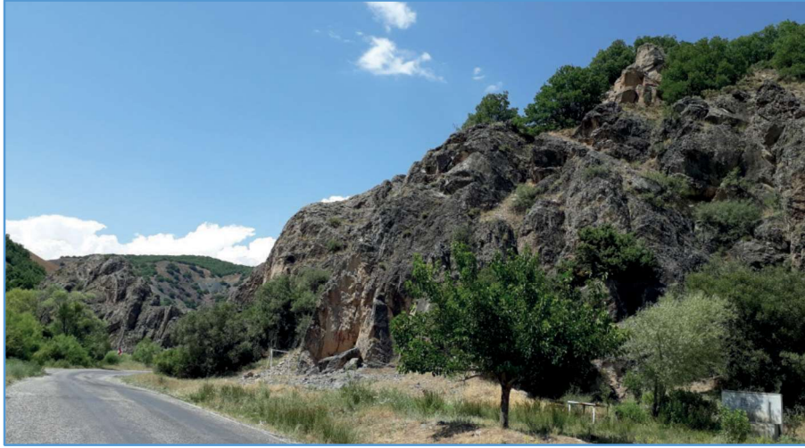
Resim 56: Değirmendere (Kemerikırık) Ziyaret mevki. Doğal kayaların altından pınar suyu çıkmaktadır.