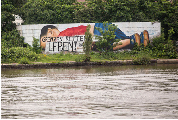
Aylan Kurdi Duvar Resmi