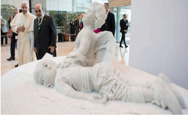
Aylan Kurdi Heykeli