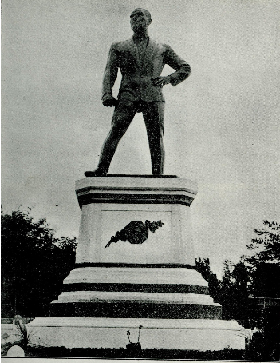
Ek-3: Sarayburnu Atatürk Heykeli'nin Ön Cepheden Görünüşü ("Gazi Paşa'nın Heykeli", İstanbul Şehremaneti Mecmuası , Sayı: 26, Teşrin-i Evvel 1926, s. 67.