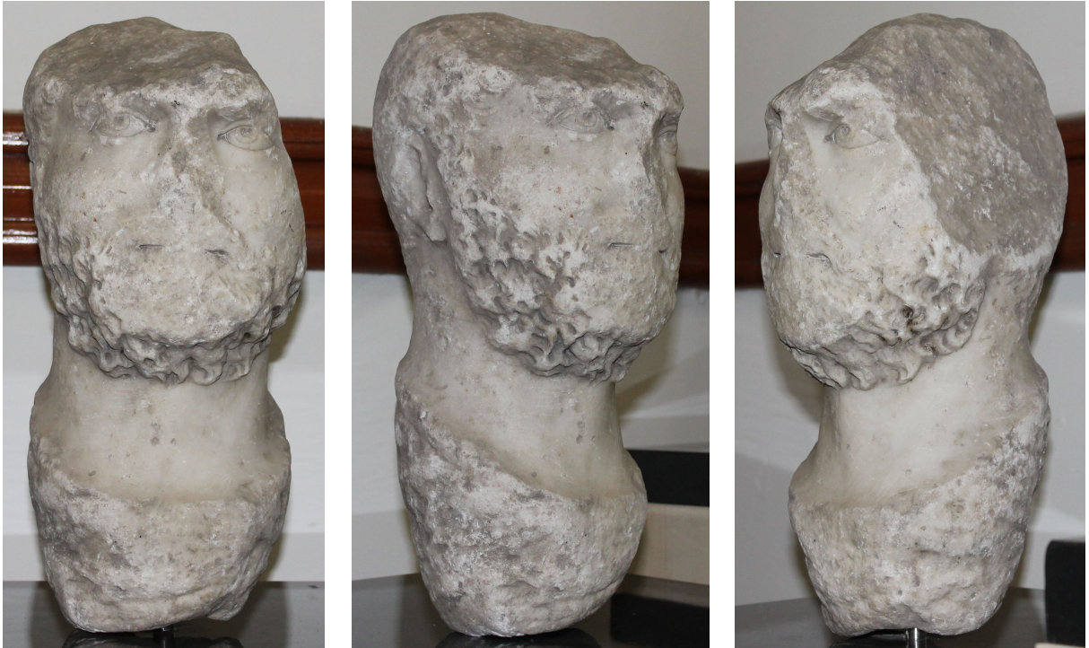
Fig. 3a-c. Erkek portresi

Tamamı 41 cm olan eserin başının yüksekliği 21 cm, genişliği 20 cm ve derinliği 24 cm'dir. Eser, iri kristalli beyaz mermerden yapılmıştır. Günümüzde A.99.7.4 envanter numarası ile Ereğli Müzesi'nde sergilenmektedir. Başın sol tarafı, üst bölümü ve alın eksiktir. Burun kırıktır. Dudaklarda, sakalda, kaşlarda, yanaklarda ve sağ kulakta zedelenmeler vardır. Boyun altındaki küresel çıkıntı, başın gövdedeki yuvaya yerleştirilmek amacıyla ayrı olarak çalışıldığına işaret etmektedir. Bu çıkıntının yüzeyi kalın murç darbeleriyle işlenmiştir.