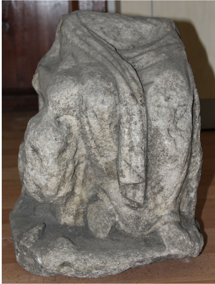
Fig. 6a. Kybele heykelciği gövde alt yarısı

Eserin korunmuş olan yüksekliği 49 cm, genişliği 32 cm ve derinliği 28 cm dir. Eser, iri kristalli beyaz mermerden yapılmıştır. Günümüzde 2004/13 A envanter numarası ile Ereğli Müzesi'nde sergilenmektedir. Eserin yalnızca belden aşağısı korunmuştur. Plinthe'nin ön kısmı, tanrıçanın ayaklarının üzeri, aslanın ön bacakları ve ayakları eksiktir. Tanrıça'nın karnında ve dizkapaklarında zedelenmeler vardır. Aslanların başları ve gövdeleri büyük ölçüde aşınmıştır.