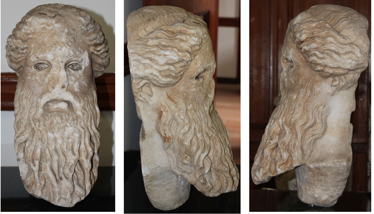
Fig. 5. Dionysos Herme'si (?)

matkap kullanılmıştır. Oyulmuş olan göz yuvalarındaki boşluklar, gözbebeklerinin işlenişinde kakma tekniğinin uygulanmış olduğuna işaret etmektedir 38 . Bu göz yuvalarının içerisine renkli camlardan ya da değerli taşlardan yapılarak ayrı olarak işlenmiş olan gözbebekleri yerleştirilmiş olmalıdır. Üst gözkapakları keskin biçimde göz yuvarlağından kesilmiş, kalın, etli ve keskin kenarlı bir görünüm kazanmıştır. Kaşlar, burun kökü kenarlarının belirgin birer devamı gibi ele alınmıştır. Ağzı hafif aralıktır ve alt dudak kalındır.