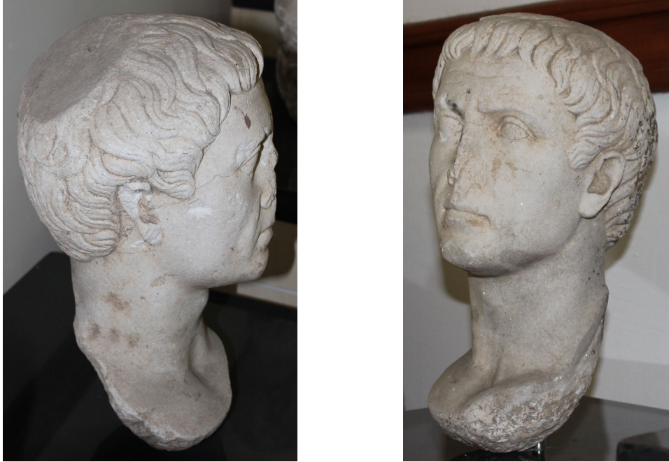
Fig. 1b-c. Erkek portresi

Tralleis'den, günümüzde Williamtown'da (ABD) bir Enstitü'de sergilenen Claudius portresi 19 ve Aphrodisias'dan, Aphrodisias Müzesi'nde (env. nr. 71-67,72-75) yer alan Claudius portresi 20 tam ovale yakın yüz biçimi, badem biçiminde iri gözleri, keskin ve kalın gözkapakları, geniş alın yapısı, olgun ve ciddi yüz ifadesiyle Heracleia Pontica portresi ile ortak özelliklere sahiptir. Stratonikeia'dan, Bodrum Müzesi'nde (env. nr. 4.19.83) yer alan erkek portresi parçası 21 (Claudius Dönemi); saç buklelerinin sol göz üzerinde bir çatal, sağ alın kısmında bir kısaç motifi