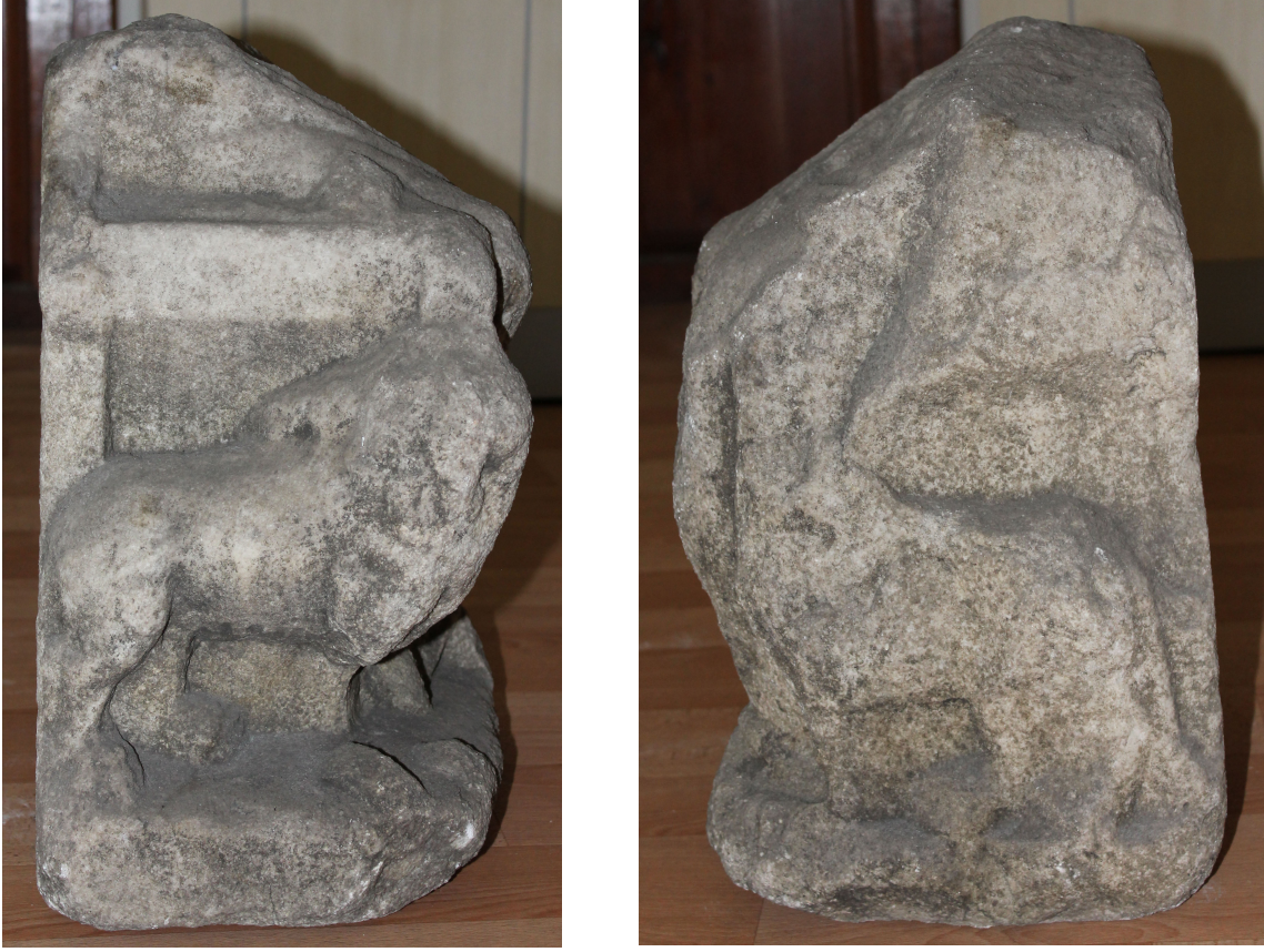
Fig. 6b-c. Kybele heykelciği gövde alt yarısı

kolunu dirsekten bükerek öne uzattığı anlaşılmaktadır. Sağ elinde, tuttuğu nesnenin izleri korunmuştur ve büyük ihtimalle bu nesne bir phiale olmalıdır. Tahtın her iki yanında ayakta duran aslanlar yer almaktadır. Aslanlar cepheden tasvir edilmiştir.