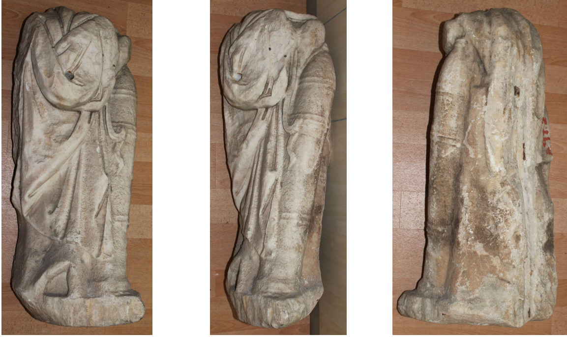
Fig. 8a-c. Heykel desteği

Heykel desteğinin yüksekliği 72 cm, genişliği 35 cm ve derinliği 32 cm'dir. Eser, ince kristalli beyaz mermerden yapılmıştır. Envanter numarası olmayan eser günümüzde Ereğli Müzesi'nde sergilenmektedir. Bir heykelle ait yalnızca plinthe ile birlikte heykel desteği korunmuştur. Plinthenin ve heykel desteğinin kenarları kırıktır.