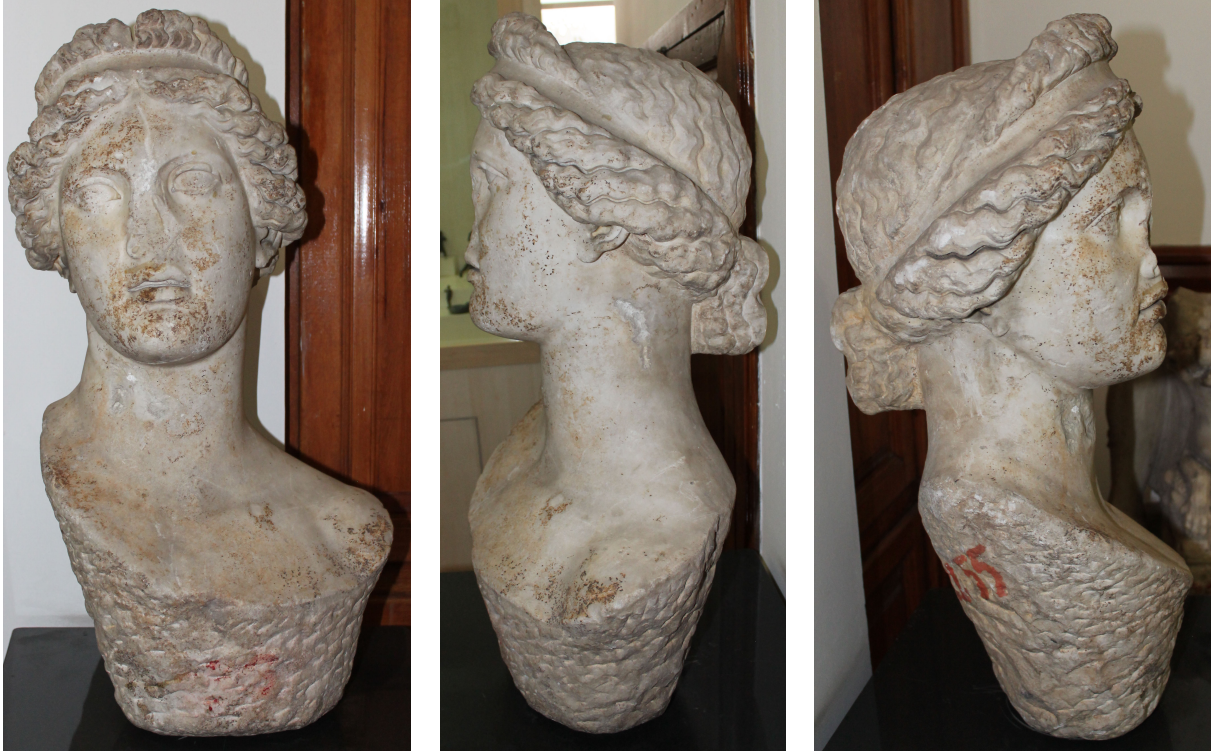
Fig. 4a-c. Tanrıça başı: Artemis (?)

toplanmıştır. Saçlar, kulakların yalnızca üst bölümünü örtmüştür. Başın her iki yanındaki, şakaklardaki ve alın üzerindeki saç buklelerinin birbirlerinden ayrılmasında matkap kullanılmış bundan dolayı saç bukleleri dalgalı, kabarık ve hareketli bir görünüm kazanmıştır. Saçlarını iki saç bandı çevirmiştir 28 .