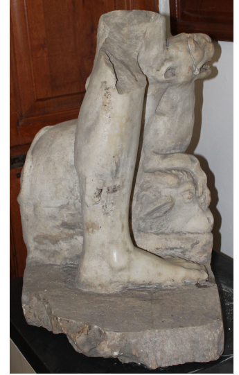
Fig. 7a-c. Plinthe parçası

Panter'in çoğunlukla Dionysos 76 olmak üzere bazen de Satyr 77 heykelinin yanında ona eşlik ettiği görülmektedir. Bazı hayvan başlarının ölümü simgelediği bilinmektedir 78 . Sabazios'un kültüründe olduğu gibi geç Dionysos kültüründe de ölümden sonraki sonsuz bir hayata inanılırdı 79 . Tanrı bir koçbaşı üzerine ayaklarını koyduğunda bu, onun ölümden daha güçlü olduğuna işaret etmektedir 80 . Aslan, grifon ya da panter gibi Dionysos ile ilişkili hayvanların pençelerini bir hayvanın başına koymaları tanrısal gücü ifade eder ve bu hareket genel olarak ölüm, tanrısal