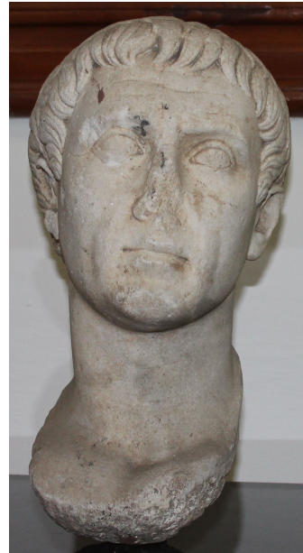
Fig 1a. Erkek portresi

Başın yüksekliği 22 cm, genişliği 18 cm ve derinliği 22 cm'dir. Eser, iri kristalli beyaz mermerden yapılmıştır. Günümüzde A.00.10.6 envanter numarası ile Ereğli Müzesi'nde sergilenmektedir. Eser oldukça iyi korunmuştur. Burun kırıktır. Boyun altındaki küresel çıkıntı, başın gövdedeki yuvaya yerleştirilmek amacıyla ayrı olarak çalışıldığına işaret etmektedir. Bu çıkıntının yüzeyi kalın murç darbeleriyle işlenmiştir. Başın tepesindeki alanda bir düzenleme yapılarak bu kısım düz bir yüzey haline getirilmiş ve ayrı işlenmiş olan başın parçası bir kenet deliği ile buraya eklenmiştir.