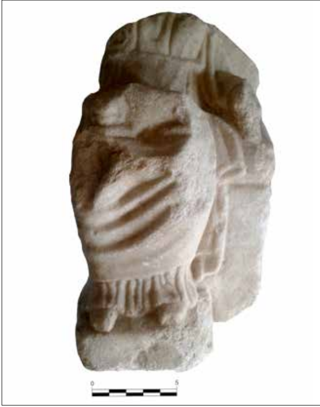
Fotoğraf 4: Kuzey Cadde’de bulunan Meter heykelciği parçası / Fragment of a statuette of Meter found in the North Street

yanında genç, sol yanında ise yaşlı, sakallı bir erkek yer almaktadır. Diğer örnek ise benzer bir kompozisyonun betimlendiği bir stelin üst-orta kısmı ve sağ üst köşesinin korunduğu bir parça olup 60 sadece kompozisyon değil işleniş açısından da ilk stel ile paralellik göstermektedir. Meter’in bir yanında genç diğer yanında sakallı birer erkek figürünün bulunduğu adak stellerinin Ephesos’ta üretilmiş oldukları düşünülmekte olup bu tip stellere ait örnekler Batı Anadolu’da farklı merkezlerde ortaya çıkarılmışlardır 61 . Tanrıçanın yanındaki figürlerin kimlikleri tartışmalıdır. Ephesos’ta tanrıçanın kutsal alanının yakınındaki kaya sunağında bulunan Zeus Patroos’a adanmış bir yazıt, sakallı tanrının Zeus olduğu yorumunun yapılmasına neden olmuştur 62 . Yine bu tip adak stellerinde sıklıkla karşılaşılan genç sakalsız erkeğin giysi özellikleri göz önüne alındığında, bu figürün Klasik Dönem’den itibaren özellikle tanrıçanın gizem kültü ile ilişkilendirilen Hermes olduğu önerilmiştir 63 .