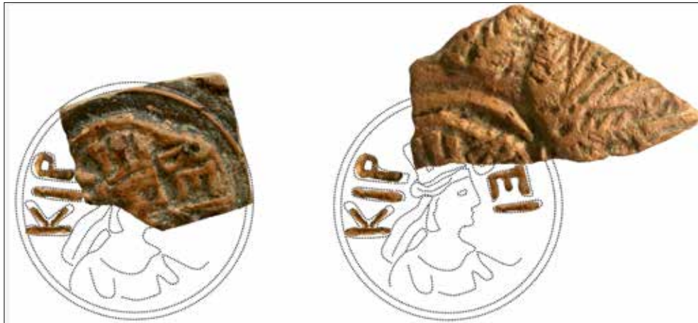
Şekil 2: Bouleuterion ve Mozaikli Yapı'da bulunan Kirbeis atölyesi üretimi seramik örnekleri (Ersoy 2020b) / Ceramic fragments produced in the Kirbeis workshop found in the Bouleuterion and in the Mosaic Building (Ersoy 2020b)

Pişmiş toprak objeler içerisinde yalnızca figürinlerde değil seramikler üzerinde de Meter'e ait izler ile karşılaşmaktadır. 2016 ve 2017 yıllarında Agora'da Bouleuterion ve Mozaikli Yapı kazılarında bulunmuş olan kalıp yapımı kase örnekleri içerisindeki iki parça üzerinde, tıpkı sikkelerde olduğu gibi sağa dönük profilden betimlenmiş sur taçlı bir tanrıça başı ile başın etrafında ... BEI şeklinde korunabilmiş KIRBEI kelimesinin yer aldığı görülür 70 (Şek. 2). Bu ifadenin Pontus kentleri başta