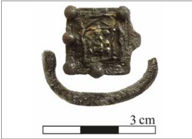
Fotoğraf 6: Kadifekale’de bulunmuş gümüş ve altından yapılmış yüzük (Akar-Tanrıver 2016) / Ring produced from silver and gold found in Kadifekale (Akar-Tanrıver 2016).

Smyrna’da bugüne kadar ortaya çıkarılan, Meter betiminin görüldüğü tek metal buluntu ise Kadifekale’de bulunmuş olan altın ve gümüşten üretilmiş bir yüzüktür. Erken Roma Dönemi’ne tarihlenen gümüş yüzüğün üzerine sabitlenmiş ince altın levha üzerinde bir tapınak içerisinde, iki aslan arasında tahtta oturan, cepheden betimlenmiş, yukarı kaldırdığı sol elinde bir tympanon tutan Meter tasviri yer almaktadır 72 (Foto. 6).