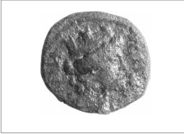
Fotoğraf 2: Ön yüzünde sur taçlı tanrıça ve Sipylene lejantının bulunduğu sikke – MS 2.-3. yüzyıllar (Ersoy/Önder/Turan 2014) / Coin depicting the goddess with a mural crown and Sipylene legend on the obverse - 2nd-3th centuries AD. (Ersoy/ Önder/ Turan 2014)

“Sipylene” lejantı yer almaktadır 50 . (Foto. 2 ) Bu durum en azından Roma Dönemi’nde basılan sikkelerde betimlenen sur taçlı tanrıçanın Meter Sipylene olduğunu göstermektedir.