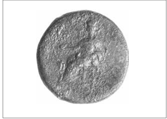
Fotoğraf 3: Arka yüzünde tahtta oturan Meter tasvirinin bulunduğu sikke - MS 1. yüzyıl (Ersoy/ Önder/ Turan 2014) / Coin depicting Meter sitting on a throne on the reverse - 1st century AD. (Ersoy/ Önder/ Turan 2014)

Meter bazı Smyrna sikkeleri üzerinde, bilinen ikonografisini takip eder şekilde giyimli ve tahtta oturur vaziyette de görülebilmektedir. Roma Dönemi’ne tarihlenen Smyrna sikkelerinin arka yüzlerinde yer alan bu betimlerde tanrıça, başında bazen bir sur tacı, bazen de yüksek ve düz bir polos taşımakta, sağ elinde phiale tutmakta, sol kolunu ise dizlerinin üzerine yerleştirdiği tympanonun üst kısmına koymaktadır 51 . Bu betimlerde ayrıca tanrıçanın ayaklarının kenarında çoğunlukla bir aslan yer alır 52 (Foto. 3).