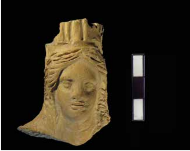
Fotoğraf 5: Bouleuterion'da bulunan pişmiş toprak Ana Tanrıça/ Meter başı / Terracotta Mother Goddess/ Meter head found in the Bouleuterion .

Smyrna'ya ait olduğunu kesin olarak bildiğimiz şimdilik tek örnek 2017 yılı Smyrna Bouleuterionu kazıları sırasında ortaya çıkarılmıştır. (Foto. 5) Erken Roma Dönemi'ne tarihlenen ikinci Bouleuterion'un oturma basamaklarını taşıyan ışnsal konstrüksiyonun içerisindeki Hellenistik dolgu tabakada 69 bulunmuş olan, kendisi de Hellenistik Dönem'in başlarına tarihlenen bu figürin başı sur taçı taşımakta olup saçlarının işleniş özellikleri de göz önüne alındığında bu başın bir Meter figürinine ait olduğu önerilmektedir.