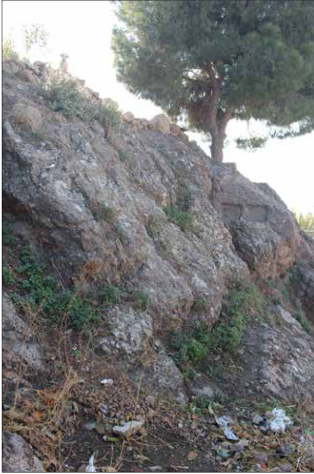
Fotoğraf 1: Smyrna Akropolisi batı yamacında tespit edilen adak nişleri (Ersoy 2015) / Votive niches identified on the west slope of Smyrna Acropolis (Ersoy 2015)

Smyrna gibi Meter kültünün kuvvetli olduğu bir kentte, antik kaynaklarda bahsedilen, yukarıda incelediğimiz “Metroon” dışında Meter’e adanmış başka kutsal alanlar olması da beklenmelidir. Akropolis’in batısında bulunan ve kent surları içerisinde kalan yamaçlarda, bugünkü Kadifekale İtfaiyesi’ne ait alan içerisindeki sarp kayalıkların yüzeylerinde dikkörtgen iki adet küçük niş geçtiğimiz yıllarda tesadüfen keşfedilmiştir 39 (Foto. 1) Burada Meter’e adanmış bir doğa kutsal alanının tanımlanması için henüz yeterli veri bulunmasa da bu nişlerin, Pergamon 40 , Phokaia 41 , Erythrai 42 , Samos 43 , Ephesos 44 ve Kolophon 45 gibi kentlerde görülen, surların içerisinde ama yerleşim görmeyen dik kayalıklar üzerinde ya da kentin hemen dışında yine kayalık alanlar üzerinde yer alan adak nişlerinin benzerleri olması mümkündür.