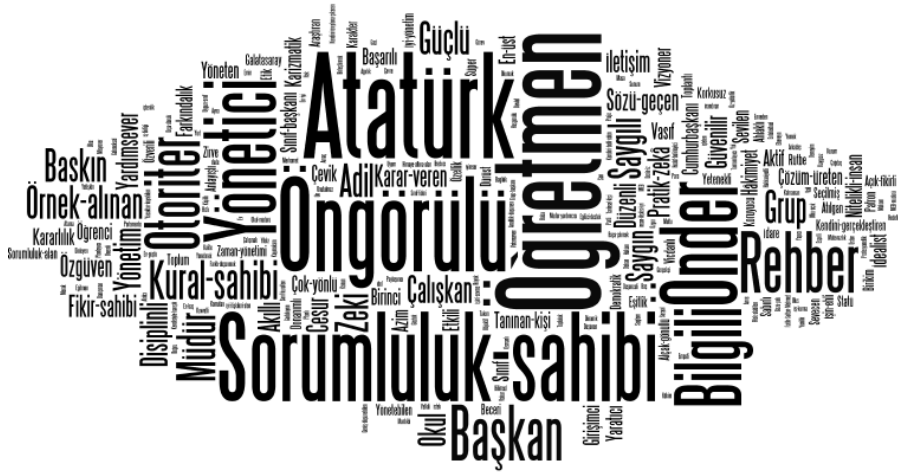
Şekil 6. Lider Anahtar Kavramı Kelime Bulutu

Öğretmen adaylarının anahtar kavramlarla ilişkilendirdikleri kelimeler frekans tablolarında yer alan değerleri doğrultusunda kesme noktalarına ayrılarak bir kavram ağı oluşturulmuştur. Şekil 7’de anahtar kavramlar ve bunlara yönelik türetilmiş kelimeler arasındaki ilişkiler gösterilmiştir. Kavram ağında anahtar kavramlar yeşil renkle yer almaktadır. Beşerli dört kesme aralığına göre (Bknz. 2.4. Verilerin analizi) her bir kesme farklı renklerle 1.Kesme (yeşil), 2.Kesme (mavi), 3.Kesme (turuncu) ve 4.Kesme (mor) ifade edilmektedir. Türetilmiş kelimelerden sadece bir anahtar kavram kapsamında türetilmiş olanları kahverengi, iki anahtar kavram kapsamında türetilmiş ise lacivert ve üç farklı anahtar kavram kapsamında türetilmiş bir kelime ise kırmızı renkle vurgulanarak sunulmaktadır.