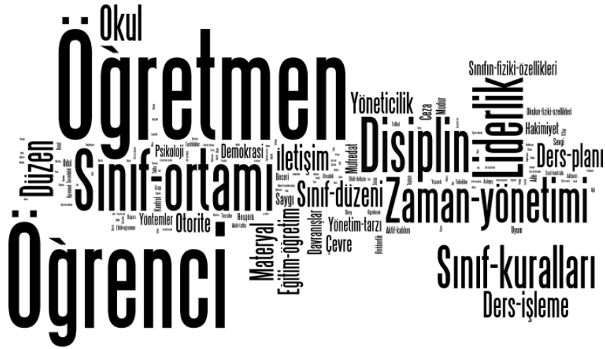
Şekil 3. Sınıf Yönetimi Anahtar Kavramı Kelime Bulutu

Tablo 5’te ikinci anahtar kavram olan “öğretmen” için öğretmen adaylarının ön plana çıkartmış oldukları kelimeler bir önceki tabloda olduğu gibi frekans ve kelimeyi türeten kişi yüzdesine göre sıralanarak sunulmaktadır. Bu anahtar kavram için en çok tekrar edilen kelimenin bir diğer anahtar kavram olan “lider” (29 kez, ~%45,31) kelimesi olduğu görülmektedir. Öğretmen adaylarının neredeyse yarısı öğretmen kavramını lider kelimesi ile ilişkilendirmektedirler.