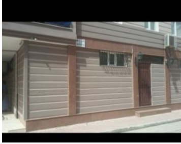
Antalya'daki ibadet yerleri