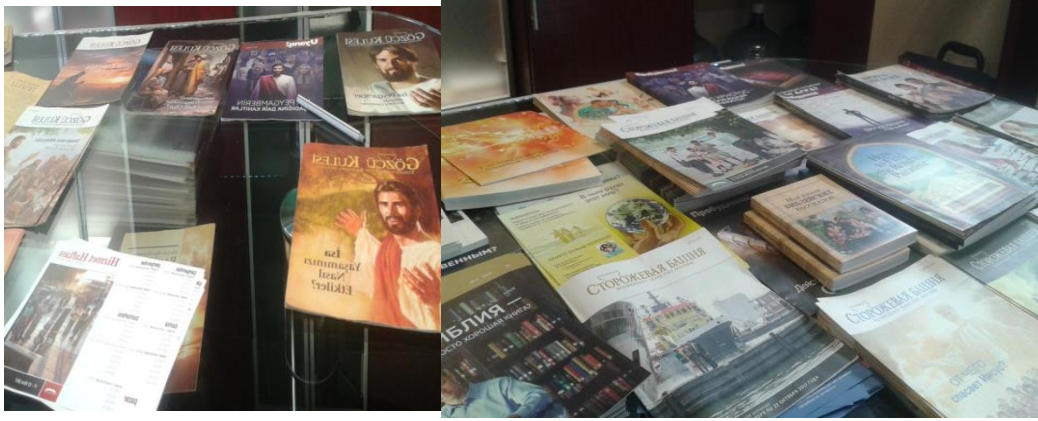
Pek çok dile çevrilen dergi ve broşürleridir. Online olarak da okunabilir.Şehrin