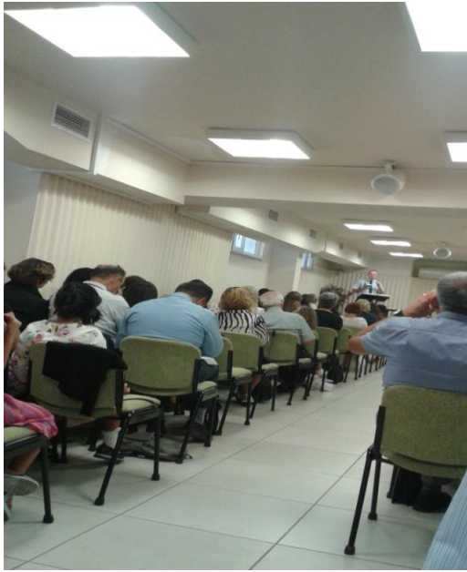
Haftalık ibadet toplantılarından bir kare