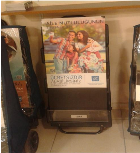
Şehrin yoğun caddelerinde dergi ve bildiri dağıtmak için kullandıkları araç