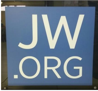
Resmi web sitesi