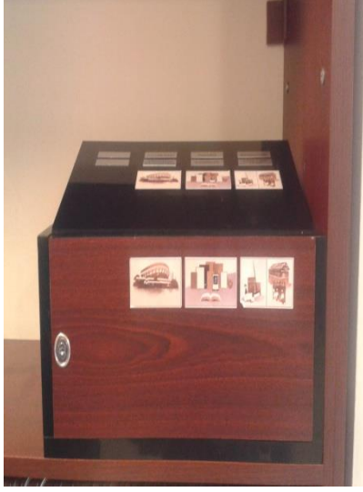
Bağış için kullandıkları teberrü sandığı