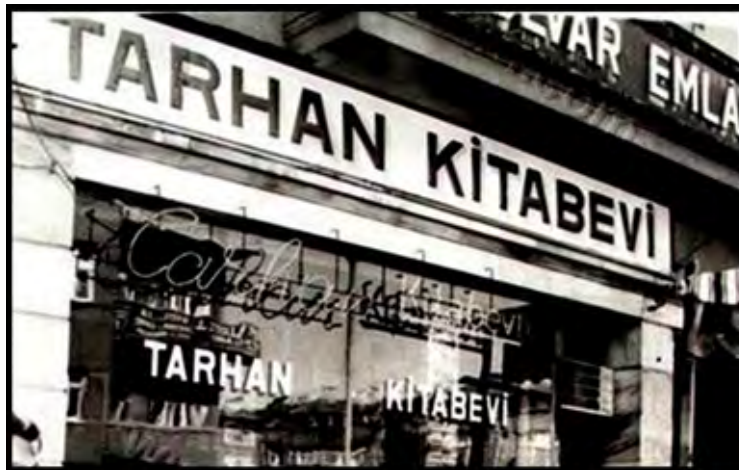
Görsel 7: Tarhan Kitabevi, Yenişehir

Ziya Gökalp Caddesi ile İnkılap Sokak köşesindeki o zamanlar Fransız Kültür Merkezi olan yapının biraz çaprazında, caddenin karşısında, 1960'lı yıllarda Hachette Kitabevi vardı ve sadece Fransızca kitaplar satardı. Bilgi Kitabevi'nin bulunduğu Sakarya Caddesi'nde ve aynı sırada, caddeye daha yakın yerde, Sergen Pastanesi'nin hemen yanında da, Tarhan Kitabevi vardı ve o da, hemen hemen sadece İngilizce kitaplar satan, büyük ve gösterişli bir dükkandı(Atauz, 2018b).