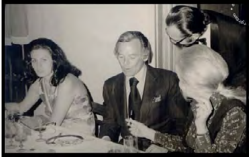
Görsel 4: Richard Kimble’nin Piknik Ziyareti

Görsel 4’te görüldüğü gibi o günlerin Ankara’sını ziyaret eden misafirlerin de uğradığı, dolayısıyla sadece Sakarya’nın değil kentin de en önemli uğrak mekânlarından biridir. Görsel 5’te Sevgi Soysal’ın Atatürk Bulvarı’ndaki hayatı izlediği ve Ankara ile ilgili edebi eserlerin en ünlülerinden biri olan ‘Yenişehir’de Bir Öğle Vaktini’ yazdığı camekânlı bölüm ile Piknik sadece Ankara’nın tarihine değil edebiyata da izini bırakmıştır. Goralı gibi Piknik de, sadece Sakarya’nın değil Ankara’nın ve hatta ülkenin kültürel tarihinde izler bırakmış, aynı zamanda Sakarya’da bugün hala devam eden gastronomik faaliyetlerin ilk ve en önemli örneklerini oluşturmuşlardır. Bıraktıkları bu izler ve kente dair anılardaki yerleri o dönemlerin Ankara’sının ve Sakarya’nın sosyal yaşamını ve kimliğini üreten mekânlarından olduklarını göstermektedir. Bu iki mekân, kent yaşamı içerisinde Sakarya’yı gündelik hayat içindeki sosyal duraklardan biri haline getirmiş ve kendileri de Sakarya ile birlikte kent kültürünün bir parçası olmuştur.