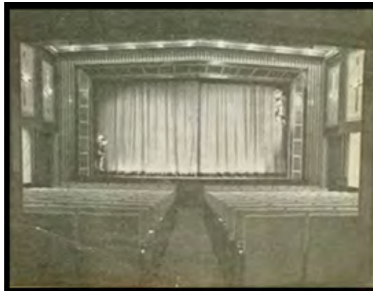
Görsel 6: Yeni Sahne'nin İlk Yıllarından Bir Görünüm

1960'lı yılların toplumsal ortamı içinde Yenişehir'de tiyatroların, sinemaların ve kitapçıların da arttığını, böylece Ulus'taki kültürel faaliyetlerin artık Kızılay'a kaydığını görmek mümkündür. Yenişehir'de ilk sinemalar 1930'larda açılırken, ilk tiyatro sahnesinin açılması ise ancak 1950'lerde gerçekleşmiştir. 1956 yılında, Sakarya'da Tuna Caddesi üzerindeki 5 no'lu binada Türkiye Ormancılar Derneği binasının alt katında açılan "Beşinci Tiyatro" özel bir tiyatrodur ve ilk zamanlarında hem tiyatro hem sinema olarak hizmet vermiştir. 1959'da aynı salon Devlet Tiyatroları Genel Müdürlüğü tarafından kiralanarak 'Yeni Sahne' adını almış ve ilk oyun 4 Ekim 1960 günü sahnelenmiştir. Ankara seyircisini uzun yıllar ağırlayarak kentin kültürel hayatının simgelerinden biri olacak Yeni Sahne'de bu tarihten kapandığı 2006 tarihine kadar yaklaşık 10 bin temsil gerçekleştirilmiştir (Demirtaş, 2013).