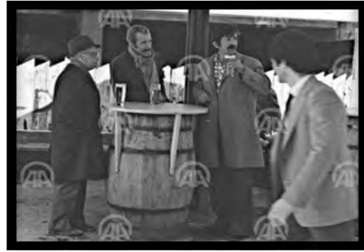
Görsel 10: Bira Parkı

Sakarya bölgesi, Bira Parkı ile gündelik hayatın da önemli bir parçası haline gelmiştir. Kızılay, kent merkezi olarak hem birçok işyerinin bulunduğu hem de toplu ulaşım araçlarının duraklarının olduğu bir bölgedir. Dolayısıyla özellikle iş çıkış saatlerinde Kızılay Meydanı çevresi ve Atatürk Bulvarı yoğun kullanımlara sahne olmakta, bu yoğunluk Sakarya'ya da sirayet etmektedir. Sakarya, Bira Parkı ile iş çıkış saatlerinde, toplu taşıma araçlarına binip evlerine dönmeden önce insanların ayaküstü uğradıkları, bira içerek ayak üstü sohbet ettikleri bir yer haline gelmiş ve bu özelliği farklı formlarda da olsa bugünlere kadar devam etmiştir.