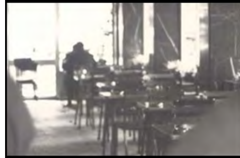
Görsel 5: Piknik, Camekânlı Bölüm

Mekânın anlamı ve kimliği toplumsal süreç içerisinde mekânsal pratikler ve ilişkiler aracılığıyla yeniden kurulmaktadır (Lefebvre 1991; Massey, 2002). Nitekim yeni rejim ile birlikte modern yaşamın sahnesi olarak tasarlanan Kızılay da sosyal, ekonomik ve politik gelişmeler ile birlikte değişip dönüşmektedir. Kent merkezi olarak önemini ve yoğunluğunun artmasına paralel olarak daha geniş kesimler kent yaşamına katılmakta, böylece yeni aktörleriyle beraber çeşitlilik içeren bir sosyal yaşam mekânı olarak yeniden kurulmaktadır. Artık sadece üst düzey bürokratlar ve elçilerin değil memurlar, öğrenciler, sanatçılar ve işçiler gibi toplumun çeşitli kesimlerinden insanların günün farklı saatlerinde vakit geçirdikleri bir alana dönüşmektedir.