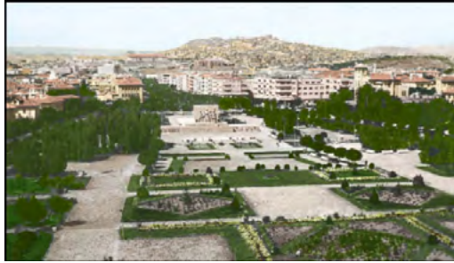
Görsel 11: Güvenpark, 1950’ler

Türkiye, dünyada yaşanan bu ekonomik ve politik gelişmelere ek olarak, 1980’li yıllara 12 Eylül darbesinin siyasal ve toplumsal etkileri ile başlamıştır. Önceki dönemin toplumsal hareketliliğine son veren darbe, bu hareketliliğin en önemli sahnesi ve aracı olan sokağa da müdahale etmiştir. Berman(2009, s.205)’ın, “sokağı öldürmeliyiz” şeklinde betimlediği Haussman ve Paris Bulvarı örneği, Ankara’da 12 Eylül ile birlikte özellikle Kızılay Meydanı ve Atatürk Bulvarı üzerinde net ifadesini bulacaktır. Bununla birlikte, Kızılay’a bugünkü halini veren son dönüşüm ve müdahaleler aslında 1980 öncesi dönemde yavaş yavaş başlamıştır. Bunlar arasında simgesel olarak en önemli olanlardan biri Kızılay Meydanı’na ismini veren Kızılay Binası’nın yıkılmasıdır. 1980’lere gelindiğinde Kızılay Binası, önündeki parkı ile birlikte ortadan kalkmış ve böylece hem meydan daraltılmış hem de kentlilerin kullanabildiği yeşil alanlardan biri yok olmuştur. Güvenpark, otobüs ve dolmuş durakları ile önemli ölçüde daralırken Havuzbaşı kentliler için bir durak ve dinlenme noktası olma özelliğini tamamen yitirmiştir.