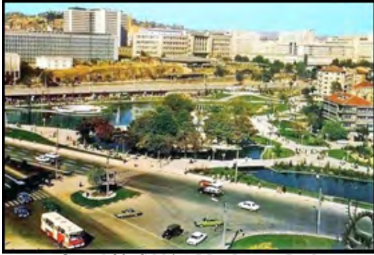
Görsel 20: Sıhhiye Meydanı ve Park

Sıhhiye Meydanı da benzer süreçlerden nasibini almış, U dönüşü köprüsü ve metro duraklarıyla parçalanarak yaya hareketini zorlaştırmıştır. Otobüs duraklarının ve araç trafiğinin iyice daralttığı kaldırımlarda yürümek ve karşıdan karşıya geçmek gibi eylemlerin bile iyice zorlaşması bu bölgeyi de sosyal yaşam için imkansız hale getirmiştir. Bu durum sonucunda Sıhhiye Meydanı ve çevresinde, Abdi İpekçi Parkı dışında kamusal yaşama imkan veren bir yer kalmamış, Sıhhiye Meydanı ulaşım ve ticari etkinliklerin bir alanına dönüşmüştür.