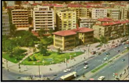
Görsel 15: Tarihi Kızılay Binası, 1950'ler

Tüm bu değişim süreci belki en iyi Kızılay Binası ve Parkı üzerinden simgeleştirilebilir. Tarihi binanın ve geniş parkın yerine, estetik açıdan yoğun eleştiriler alan bir yapı inşa edilmiş böylece kamusal kullanıma açık bir yeşil alan alışveriş merkezine çevrilerek kentlilerden alınmış ve tamamen ticari kullanıma bırakılmıştır.