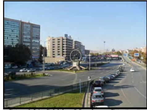
Görsel 21: Sıhhiye Meydanı, Günümüz