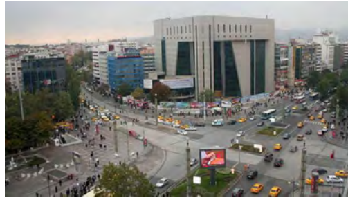
Görsel 16: Kızılay AVM, Günümüz

Bir zamanlar geniş yeşil alan ve parklarla çevrili olan ve modern vatandaşın gezinti yeri olarak tasarlanan meydan ve çevresi estetikten tamamen yoksun binalar ve araç trafiği ile istila edilerek yerini sadece tüketime yönlendiren bir kent yaşamına bırakmıştır. Kızılay Meydanı da bu haliyle meydan olma özelliğini kaybederek kavşak noktasına dönüşmüştür.