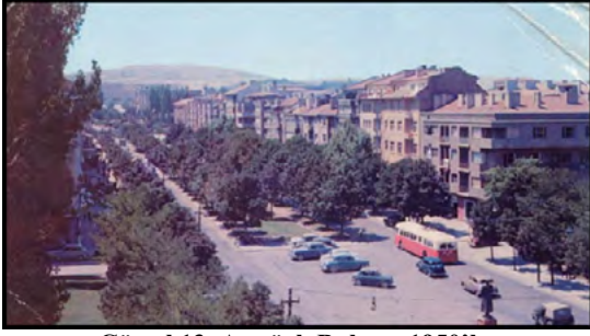
Görsel 13: Atatürk Bulvarı 1950'ler