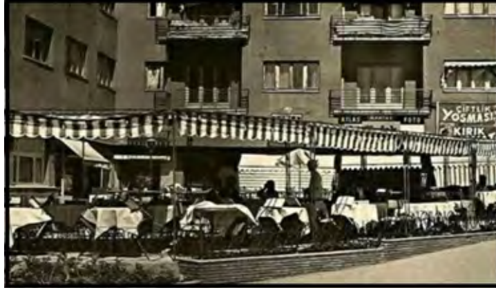
Görsel 2. Soysal Apartmanı, Cevat Restoran ve Ulus Sineması, Yenisehir, 1961