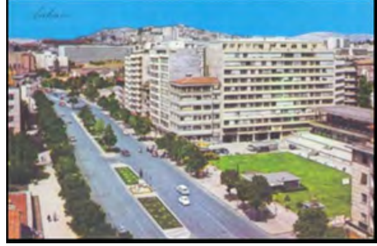
Görsel 18: Zafer Meydanı, 70'ler