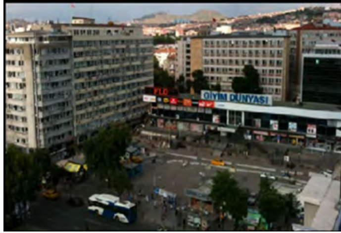
Görsel 19: Zafer Meydanı, Günümüz

Sıhhiye Meydanı da benzer süreçlerden nasibini almış, U dönüşü köprüsü ve metro duraklarıyla parçalanarak yaya hareketini zorlaştırmıştır. Otobüs duraklarının ve araç trafiğinin iyice daralttığı kaldırımlarda yürümek ve karşıdan karşıya geçmek gibi eylemlerin bile iyice zorlaşması bu bölgeyi de sosyal yaşam için imkansız hale getirmiştir. Bu durum sonucunda Sıhhiye Meydanı ve çevresinde, Abdi İpekçi Parkı dışında kamusal yaşama imkan veren bir yer kalmamış, Sıhhiye Meydanı ulaşım ve ticari etkinliklerin bir alanına dönüşmüştür.