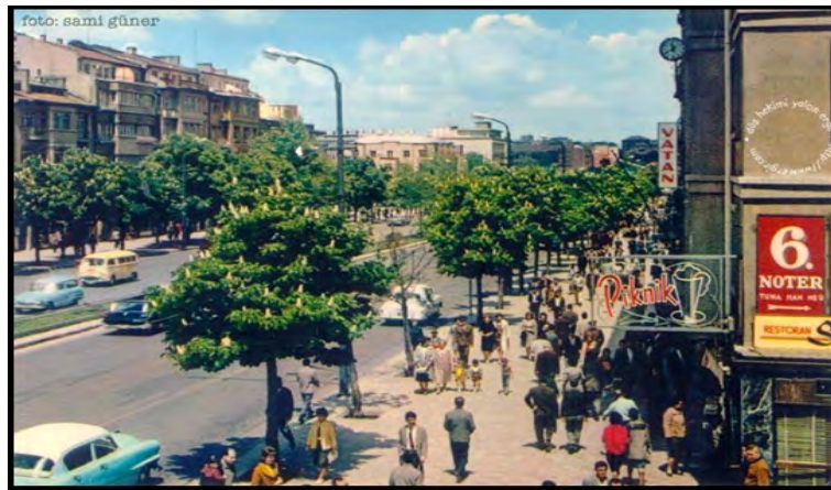
Görsel 3: Tuna Caddesi Girişi ve Piknik, Yenisehir