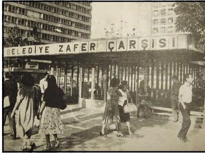
Görsel 8: Zafer Çarşısı

70'li yıllarda Ankara'da kitap denince akla gelecek tek mekândı. sadece kitap satışı değil, aynı zamanda buluşma, halleşme, tartışma mekânıydı da. 12 Eylül darbesinden sonra Ankara'nın "göze batan" mahalleleri nasıl talan edilip ıssızlaştırıldıysa, burası da o hisimdan/ kıyımdan nasibini aldı. Birçok kitabevi kapandı. Kapanmadan önce de sahipleri ve çalışanları içeri tıkıldı. Devamında çarşı sıradan bir alışveriş mekânına döndü. Büyükşehir Belediyesi tarafından işletilen çarşının büyük bir sergi salonu vardır. Uzun zamandır işlevine uygun kullanılmamaktadır ne yazık ki. Ankara'yı Ankara yapan mekânlardan birinin yavaş yavaş kaybedilmesi, bir dönemin hüznünü de beraberinde götürmektedir. Yolu düşen ana girişin solundaki girişten içeri dalsın. Merdivenin yanında bir çay için. "Zor yıllar"ın izlerini yudumlasın(Arzkara, 2011).