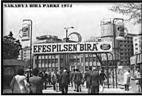
Görsel 9: Bira Parkı, Sakarya

Vedat Dalokay tarafından uygulanan Bira Parkı projesi, sokağın kendisinin sosyalleşme ve eğlence mekânı olabilmesinin bir örneğini oluşturması açısından değerlidir. İş çıkışı memurların, işçilerin ve öğrencilerin birkaç kadeh bira içtikten sonra yine Kızılay'daki toplu taşıma ağılarıyla eve dönmesi rutinini kent merkezine taşıyan bir uygulama olmuştur.