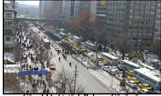
Görsel 14: Atatürk Bulvarı, Günümüz

Tüm bu değişim süreci belki en iyi Kızılay Binası ve Parkı üzerinden simgeleştirilebilir. Tarihi binanın ve geniş parkın yerine, estetik açıdan yoğun eleştiriler alan bir yapı inşa edilmiş böylece kamusal kullanıma açık bir yeşil alan alışveriş merkezine çevrilerek kentlilerden alınmış ve tamamen ticari kullanıma bırakılmıştır.