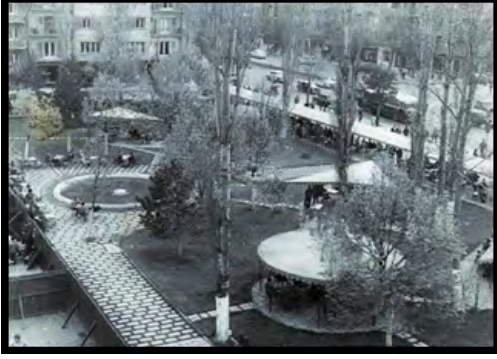
Görsel 17: Zafer Meydanı, Park