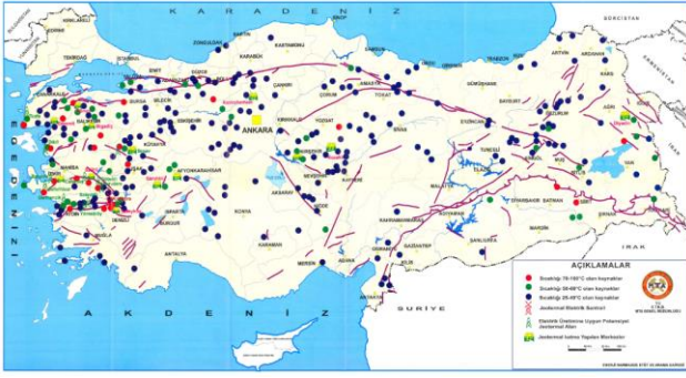
Şekil 1. Türkiye'nin genç tektonik unsurları ve jeotermal kaynakların dağılımı [5].