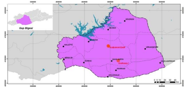
Şekil 3. Şanlıurfa İlinde Mevcut Jeotermal Sahalar [8].

Şanlıurfa ilinde Karaali ve Kabahaydar olmak üzere iki adet jeotermal alan mevcuttur. Ülkemizin kalkınmasında çok önemli potansiyel vadeden Harran Ovası'nda yer alan Karaali jeotermal alanı, Güneydoğu Anadolu Bölgesi'nin Orta Fırat Bölümü'nde bulunan Şanlıurfa'nın 45 km güneydoğusunda ve Akçakale grabeni içerisindeki Karaali Köyü'nü de içine alan sahayı kapsar [8, 9,10]. Sıcak akışkan, termal tesis ve seracılık uygulamasının yapıldığı alanın içinde bulunan Karaali köyüne, Şanlıurfa-Mardin karayolu üzerindeki Çamlıdere'den itibaren yaklaşık 25 km'lik asfalt yol ile ulaşılmaktadır [11, 12]. Kabahaydar alanı ise Şanlıurfa ilinin 35 km kuzeydoğusundaki Aşağı Koymat Köyü'nde yer alır (Şekil 3). Kabahaydar jeotermal sahası Şanlıurfa ilindeki ikinci jeotermal sahadır. Bu saha ile ilgili bilimsel veriler son derece azdır. 2012 yılında Şanlıurfa İl Özel İdaresi tarafından özel bir firmaya "Aşağı Koymat Köyü 5000 Dekarlık Alanda Jeoloji, Jeokimya ve Hidrojeoloji Raporları" isimli bir çalışma yaptırılmıştır. Bu raporda ağırlıklı olarak jeofizik çalışmalar yapılmış, bunun dışında jeotermal sistem ile ilgili diğer bilimsel incelemeler yapılmamıştır [13].