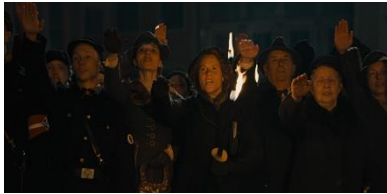
Resim 11. Onuncu Sekans