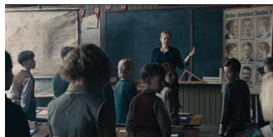
Resim 3. İkinci Sekans