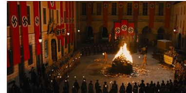
Resim 10. Dokuzuncu Sekans

Kavramsal anlam açısından Almanya'da kitap yakma etkinliği yansıtılmaktadır. Yan anlamsal anlam boyutunda Nazizm ve Nazi rejimi etkisindeki Alman halkı aktarılmaktadır. Filmde yer alan bayraklardan ve üniformalı kişilerden kitap yakma eyleminin Naziler tarafından düzenlendiği mesajı ortaya çıkmaktadır. Bu aşamada toplumsal anlam açısından NSDAP iktidarında inşa edilen düzen ortaya konulmaktadır. Nazi rejimi tarafından tehdit olarak nitelendirilen kitapların yakılması üzerinden duygusal anlam boyutunda öfke ön plana çıkarılmaktadır. Nazilerin, rejimine ve ideolojisine muhalif olan kitaplara yönelik öfke içerisinde olduğu aktarılmaktadır. Yansıtıcı anlam açısından kitapların yakılması, otorite mesajı vermektedir. Bu açıdan Nazilerin Alman halkı üzerinde kurduğu otoriteye vurgu yapılmaktadır. Eşdizimsel anlam boyutunda Liesel'in kitaplar konusunda Nazi propagandasına maruz kalması yansıtılmaktadır. Bu açıdan Liesel'in kitaplara yönelik düşüncesinin şekillenmesinde Nazi propagandasına maruz kaldığı aktarılmaktadır. Filmin bu kısmında kitapların yakılması üzerinden konusal anlam açısından Nazizm ve kitaplar vurgulanmaktadır. Bu şekilde Nazizm ideolojisinin Almanya'da hangi kitapların okunup, hangi kitapların okunmayacağı konusunda belirleyici olduğu mesajı verilmektedir.