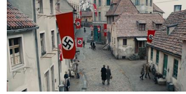
Resim 7. Altıncı Sekans

Kavramsal anlam boyutunda Almanların sosyal hayatı yansıtılmaktadır. HJ üniformaları ve bayraklarından ve Hitler'in doğum günü için asılan Nazi Almanya'sının bayraklarından yan anlamsal anlam açısından Alman sosyal hayatında Nazi rejiminin etkisi aktarılmaktadır. Toplumsal anlam boyutunda NSDAP iktidarında yaşam ortaya konulmaktadır. Partinin, Alman halkının toplumsal hayatı üzerindeki etkisine vurgu yapılmakta, bu açıdan duygusal anlam açısından egemenlik ön plana çıkarılmaktadır. Yansıtıcı anlam boyutunda Nazizm, otorite mesajı vermektedir. NSDAP'nin liderliğinde Nazizm ideolojisinin Alman eğitiminde olduğu gibi Alman toplumsal hayatında da egemen olduğu düşüncesi ortaya çıkmaktadır. Eşdizimsel anlam açısından Liesel'in Nazi rejimi altında yaşaması yansıtılmaktadır. Liesel'in eğitim hayatında olduğu gibi toplumsal hayatında da Nazizm ideolojisine maruz kaldığı mesajı verilmektedir. Konusal anlam boyutunda Nazizm ve sosyal hayat vurgulanmaktadır. Nazi Almanya'sında sosyal hayatın Nazizm ideolojisi ekseninde şekillendiğine yönelik algı oluşturulmaktadır.