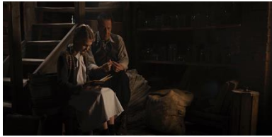
Resim 17. On Altıncı Sekans