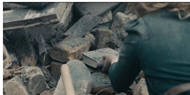
Resim 27. Yirmi Altıncı Sekans