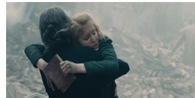
Resim 28. Yirmi Yedinci Sekans

Kavramsal anlam açısından Liesel'in bulunduğu sokağın hava bombardımanından sonraki hali yansıtılmaktadır. Liesel'in yıkıntılar içerisinde kitabı almasıyla yan anlamsal anlam boyutunda geçmişe dair kitabın kalması aktarılmaktadır. Toplumsal anlam açısından İkinci Dünya Savaşı'nda Almanya'ya yönelik hava bombardımanı ortaya konulmaktadır. Hava bombardımanı sonucunda insanların hayatlarını kaybetmesiyle duygusal anlam boyutunda hüznün ön plana çıkarılmaktadır. Yansıtıcı anlam açısından da kitabın tutulması, kitap sevgisini aktarmaktadır. Eşdizimsel anlam boyutunda Liesel'in zor anlarında bile kitabını bırakmaması yansıtılmaktadır. Geçmişe dair kitabın kalmasıyla konusal anlam açısından geçmiş ve kitap vurgulanmaktadır.