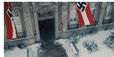
Resim 4. Üçüncü Sekans