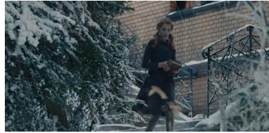
Resim 24. Yirmi Üçüncü Sekans