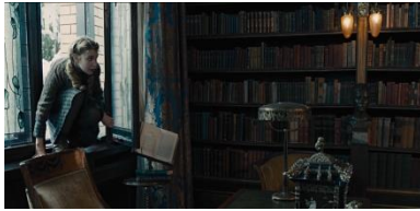
Resim 23. Yirmi İkinci Sekans