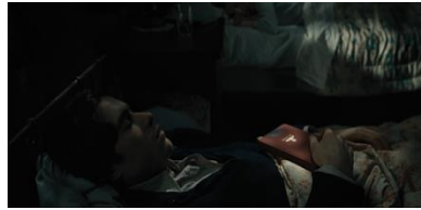
Resim 18. On Yedinci Sekans