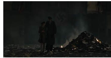
Resim 16. On Beşinci Sekans

Kavramsal anlam açısından Almanya'da kitap yakma etkinliği sonrası yansıtılmaktadır. Liesel'in yanmakta olan kitaplar içerisinde bir kitabı almasıyla yan anlamsal anlam boyutunda Nazi rejimi tarafından oluşturulan düzene karşıtlık aktarılmaktadır. Toplumsal anlam açısından NSDAP iktidarında otorite ortaya konulmaktadır. Buna karşılık Liesel'in hareketi üzerinden duygusal anlam boyutunda karşıtlık ön plana çıkarılmaktadır. Yansıtıcı anlam açısından kitabın alınması, sorgulama mesajı vermektedir. Liesel'in kitabı alması Nazi rejimini ve Nazizm ideolojisini sorguladığı düşüncesinin oluşmasına neden olmaktadır. Eşdizimsel anlam boyutunda Liesel'in Nazi rejiminin kitap politikasına karşı hareket etmesi yansıtılmaktadır. Kitap yakma etkinliği üzerinde de yine konusal anlam açısından Nazizm ve kitaplar vurgulanmaktadır.