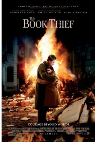
Resim 1. "Kitap Hırsızı" Filminin Afişi