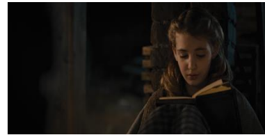
Resim 20. On Dokuzuncu Sekans Resim 21. Yirminci Sekans Resim 22. Yirmi Birinci Sekans

Kavramsal anlam açısından Liesel ve Vandenburg yansıtılmaktadır. Liesel'e kitap hediye edilmesi ve Liesel'in kitap okuması üzerinden yan anlamsal anlam boyutunda kitap okuma sevgisi aktarılmaktadır. Toplumsal anlam açısından NSDAP iktidarında yaşam ortaya konulmaktadır. Liesel'in kitaplara olan ilgisinden dolayı duygusal anlam boyutunda sevgi ön plana çıkarılmaktadır. Yansıtıcı anlam boyutunda da Liesel'in kitap okuması, kitap okuma sevgisini aktarmaktadır. Eşdizimsel anlam boyutunda Liesel'in kitap okuma isteği yansıtılmaktadır. Konusal anlam açısından da kitap okuma vurgulanmaktadır.