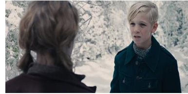
Resim 25. Yirmi Dördüncü Sekans

Kavramsal anlam boyutunda Liesel'in gizlice kitap alması yansıtılmaktadır. Liesel'in gizlice kitap alması üzerinden yan anlamsal anlam açısından kitap okuma isteği aktarılmaktadır. Toplumsal anlam boyutunda da yine NSDAP iktidarında yaşam ortaya konulmaktadır. Liesel'in izinsiz olarak kitap almasından dolayı duygusal anlam açısından korku ön plana çıkarılmaktadır. Yansıtıcı anlam boyutunda kitabın alınması, kitap okuma isteğini aktarmaktadır. Eşdizimsel anlam açısından Liesel'in kitap okuma çabası yansıtılmaktadır. Konusal anlam boyutunda da kitap okuma vurgulanmaktadır.