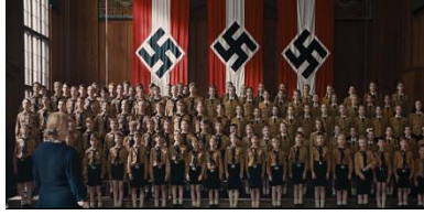
Resim 5. Dördüncü Sekans