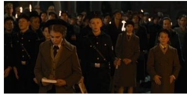
Resim 12. On Birinci Sekans