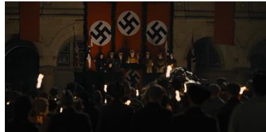
Resim 9. Sekizinci Sekans