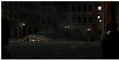
Resim 14. On Üçüncü Sekans