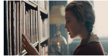
Resim 19. On Sekizinci Sekans

Kavramsal anlam boyutunda Liesel'in çevresindeki insanlarla geçirdiği zaman yansıtılmaktadır. Bu aşamada Liesel'in kitaplara ilgisiyle yan anlamsal anlam açısından kitap okuma sevgisi aktarılmaktadır. Toplumsal anlam boyutunda NSDAP iktidarında yaşam ortaya konulmaktadır. Liesel'in kitaplara sevgisi vurgulanmakta, bu açıdan duygusal anlam açısından sevgi ön plana çıkarılmaktadır. Yansıtıcı anlam boyutunda da Liesel'in kitap okuması, kitap okuma sevgisini aktarmaktadır. Eşdizimsel anlam açısından Liesel'in kitap okumayı hayatının bir parçası haline getirmesi yansıtılmaktadır. Bu aşamada da konusal anlam boyutunda kitap okuma vurgulanmaktadır.