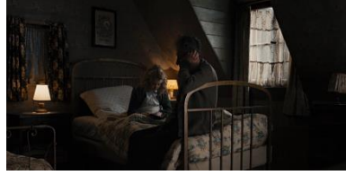
Resim 6. Beşinci Sekans