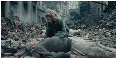
Resim 26. Yirmi Beşinci Sekans