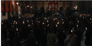
Resim 8. Yedinci Sekans