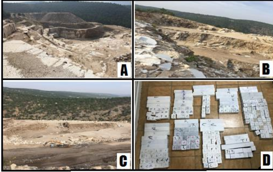
Şekil 1. Numune alınan mermer ocaklarının genel görüntüsü ve boyutlandırılmış mermer örnekleri

dağılımı, dokusal özellikleri ve kimyasal bileşimi belirlenmiştir. Fiziko-mekanik deneyler Uşak Üniversitesi Mühendislik Fakültesi laboratuvarlarında, kimyasal analizler Çanakkale 18 Mart Üniversitesi Bilim ve Teknoloji Uygulama ve Araştırma Merkezinde Spectro xSort Handheld X-Ray Spektrometresi ile, mineralojik-petrografik incelemeler ise Afyon Kocatepe Üniversitesi Jeoloji Mühendisliği Bölümünde Leica Dm 2500P model polarizan mikroskop kullanılarak gerçekleştirilmiştir.