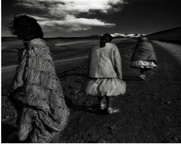
Resim 5 . Ma ke'nin “Wuyong” projesinin 2007 koleksiyonundan bir görünüm (Oppenheim, 2008)