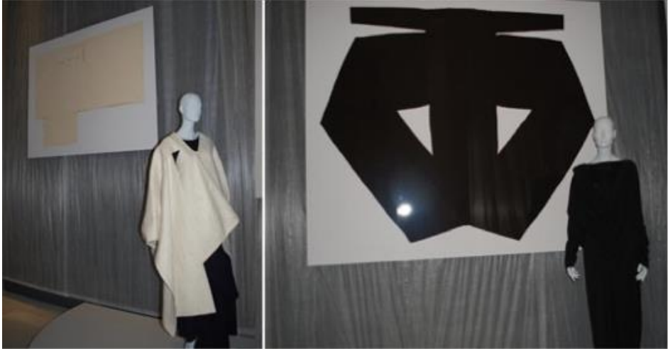
Resim 1. Comme des Garçons 1983-84 Sonbahar/Kış koleksiyonundan geleneksel Japon seyahat giysilerinin özelliklerini taşıyan tasarımları, (Mills, 2010)

Tasarımcıların Avrupa’da elde etmiş oldukları başarı Tokyo’yu bir moda başkentine çevirdiği gibi Japonya’ya moda için kültürel bir lider olarak statü sağlamış yani bir moda otoritesi olma gücü vermiştir (Kondo, 2014: 55). Ayrıca Japonya’nın saygınlık kazanan ulusal moda kimliği ile Japon tasarımcılar kendilerinden sonra gelen Japon tasarımcıların da saygın tasarımcılar olarak görülmesinde etkili rol oynamışlardır (Kawamura, 2004:164). Bunun yanında tasarımcıların geliştirdiği “Japon modası” olarak tanımlanan stil de (Skov, 1996:140) Japon moda kimliğini güçlendiren bir unsur olarak yerini almıştır.