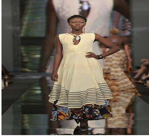
Resim 4. Sun Goddess, Audi Joburg Moda Haftası, 2007