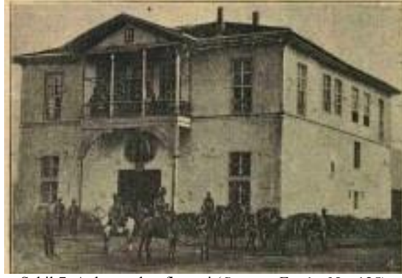
Şekil 7. Ankara telgrafhanesi ( Servet-i Fünûn , Nu. 125).