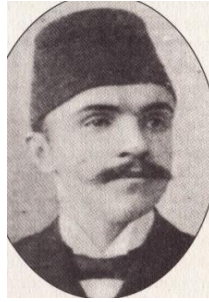
Şekil 2. Ahmet İhsan Tokgöz gençlik yıllarında.

Yarım asırdan fazla bir süre neşredilen ve Türk kültür-fikir hayatını derinden etkileyen Servet-i Fünun 'un bu kadar uzun süre matbuat