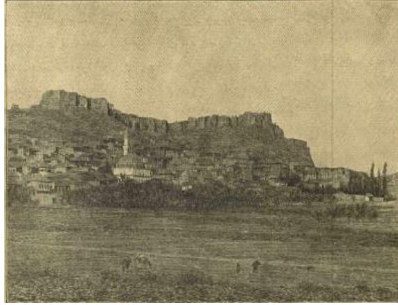
Şekil 4. Ankara Kalesi ve civarı ( Servet-i Fünûn , S. 123, kapak fotoğrafı)