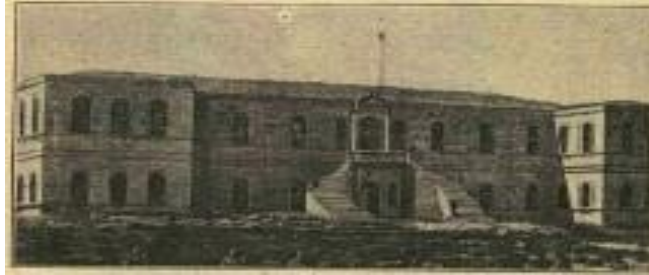
Şekil 8. Ankara Mekteb-i İdadisi ( Servet-i Fünûn , Nu. 125).