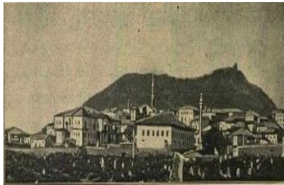
Şekil 5. Şehrin hükümet dairesi tarafından görünüşü. ( Servet-i Fünûn , Nu. 125).