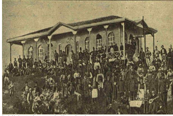
Şekil 9. Ankara Belediye Gazinosu (Servet-i Fünûn, Nu. 125).