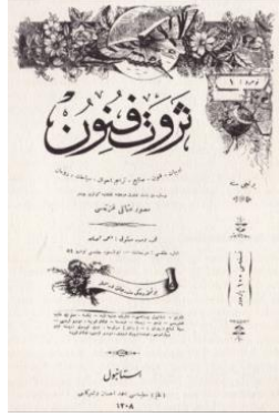
Şekil 1. Servet-i Fünun mecmuasının ilk sayısının kapak fotoğrafı.

Bey 1 tarafından çıkarılmaya başlamıştır. Dönemin usulünce ismi Mabeyn tarafından belirlenen Servet-i Fünun , 33. sayısındaki Kızkulesi fotoğrafının II. Abdülhamid tarafından beğenilmesi üzerine Bâbüâlî tarafından himaye görmeye başlar.