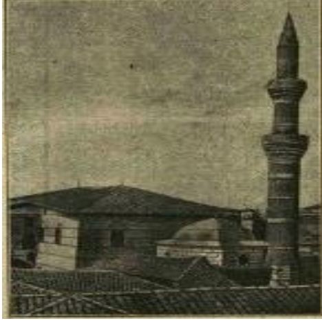
Şekil 6. Hacı Bayram Camii ve civarı. ( Servet-i Fünûn , Nu. 125).