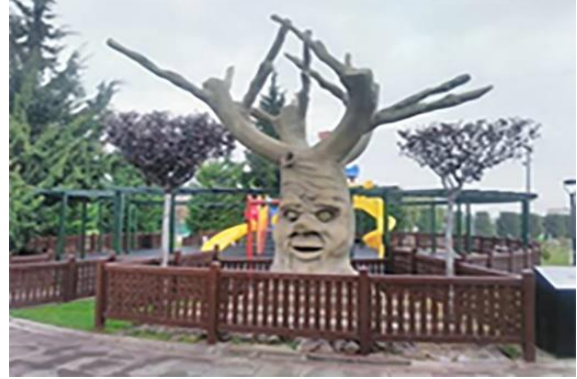
Resim 17. 80 Binde Devr-i Alem Parkı, idari bina ve çocuk oyun alanı

Cihan-1 Türk Parkı bölümü bitiminde, Pamuk Şekeri Parkı bölümüne geçişte bir sosyal tesis alanı ve tuvaletler yer almaktadır (Resim 18). Tuvaletler ise engelli bireylerin ihtiyaçlarına