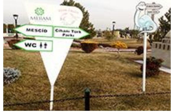
Resim 14. 80 Binde Devr-i Alem Parkı, yönlendirme elemanları