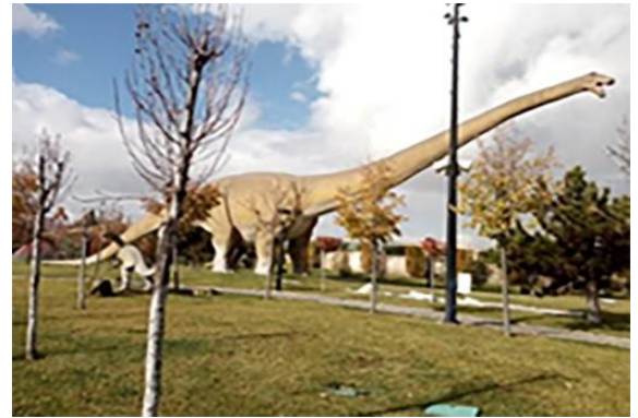
Resim 10. T-Rex Parkı