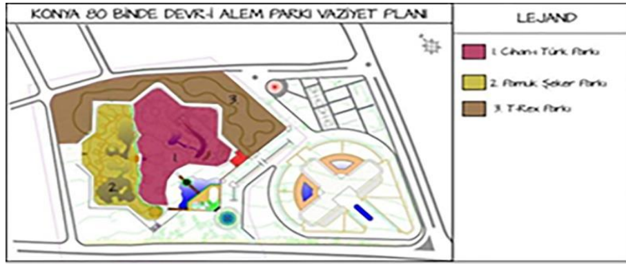
Resim 3. 80 Binde Devr-i Alem Parkı'nın bölümleri (Meram Belediyesi, 2020)