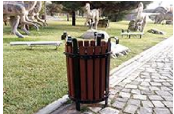
Resim 13. 80 Binde Devr-i Alem Parkı, sosyal donatı elemanları, bank ve çöp kutusu