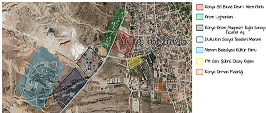
Resim 23. 80 Binde Devr-i Alem Parkı'nın çevresel faktörleri

almaktadır. 80 Binde Devr-i Alem Parkı'nın Krom Manyezit Fabrikası'na olan uzaklığı 550 metre, Krom lojmanlarına olan uzaklığı 600 metre, Meram Dutlu Kırı Millet Bahçesi'ne olan uzaklığı ise 1,1 kilometredir (Resim 23).