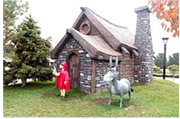
Resim 20. Pamuk Şekeri Parkı, bitkisel tasarım

Alanlar arasını bölmek içinse, budama ile şekil verilen boylu herdem yeşil türler tercih edilmiştir. Bu herdem yeşil türlerin çevreleme elemanı olarak kullanılması ise ziyaretçiler tarafından alanın geniş hissedilmesini ve bahçeler arasında ayırımın daha net algılanmasını sağlamaktadır. 80 Binde Devr-i