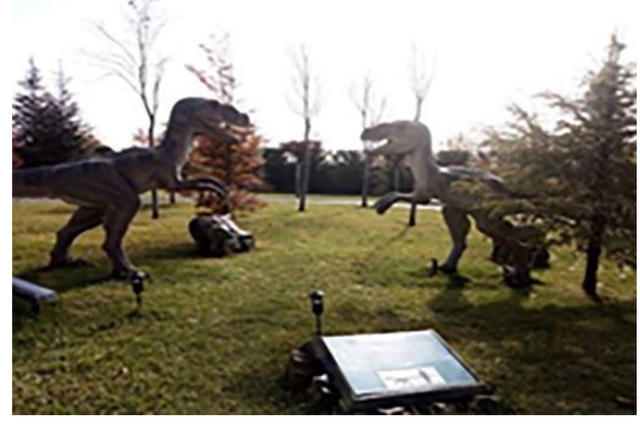
Resim 19. Cihan-1 Türk Parkı ve T-Rex Parkı bitkisel tasarım

Pamuk Şekeri Parkı için de aynı şekilde doğal bir ortam oluşturabilmek adına herdem yeşil türler