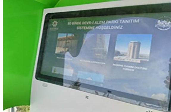
Resim 7. Cihan-1 Türk Parkı, tanıtım cihazları