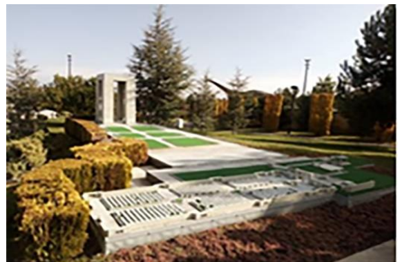
Resim 5. Cihan-ı Türk Parkı, İstanbul Kız Kulesi ve Çanakkale Şehitlik Anıtı minyatürleri