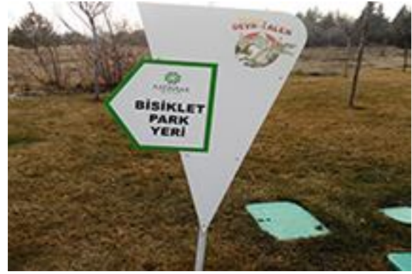
Resim 22. 80 Binde Devr-i Alem Parkı, bisiklet park alanı