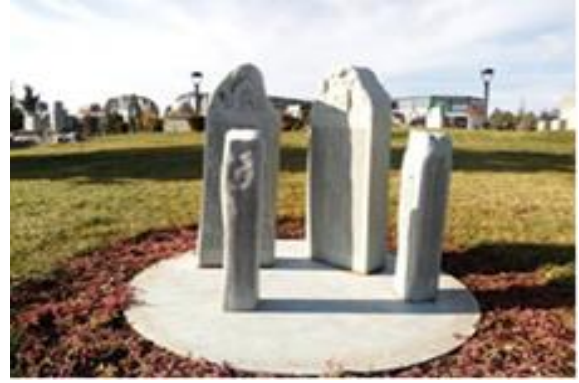
Resim 4. Cihan-ı Türk Parkı, Taç Mahal ve Orhun (Göktürk) Yazıtları minyatürleri

İkinci bölümde ise Türkiye'nin dört bir tarafında bulunan tarihi eserlerimiz yer almaktadır. Bunlardan en dikkat çekici olanları ise Çanakkale'de bulunan Çanakkale Şehitlik Anıtı, Edirne de bulunan Selimiye Camii, Urfa da