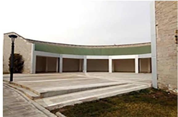
Resim 18. 80 Binde Devr-i Alem Parkı, sosyal tesis alanı ve amfi