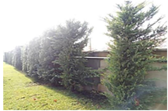
Resim 21. Cihan-1 Türk Parkı ve Pamuk Şekeri Parkı bitkisel tasarımı