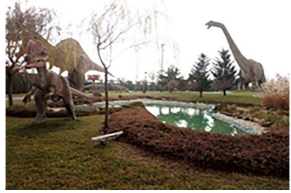
Resim 11. Cihan-ı Türk Parkı girişindeki su kullanımı, Giriş ve T-Rex Parkı

Alan içerisindeki su yüzeylerinin kullanımı aynı zamanda filmlerde olayın geçtiği bir sahnenin