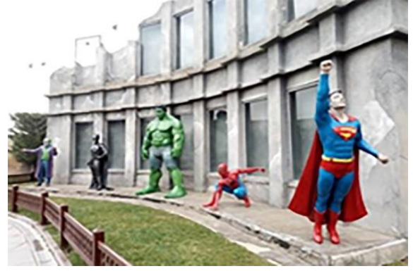
Resim 8. Pamuk Şekeri Parkı, film ve çizgi roman karakterleri

Bu bölümde ayrıca masallardaki karakterlere de yer verilmiş ve çizgi film sahneleri ile ilgili ortam canlandırılmaları da ziyaretçilere