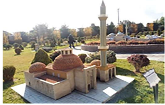
Resim 6. Cihan-1 Türk Parkı, Mevlana Türbesi ve İnce Minareli Medrese minyatürleri

Ayrıca minyatürlerin bulunduğu alanda, 5 dilde söz konusu tarihi eserler hakkında bilgi verilmektedir. Parkta bulunan minyatürler önüne yerleştirilen cihazlar sayesinde Türkçe,