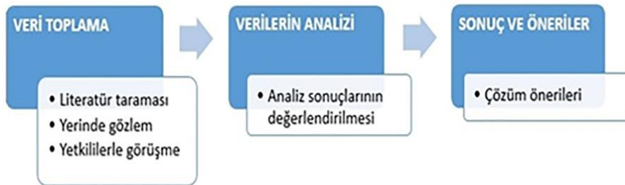
Resim 2. Yöntem aşamaları

Çalışma esnasında izlenen yöntem ise üç aşamadan oluşmaktadır. Bunlar; veri toplama, verilerin analizi ile sonuç ve öneriler aşamalarıdır (Resim 2).