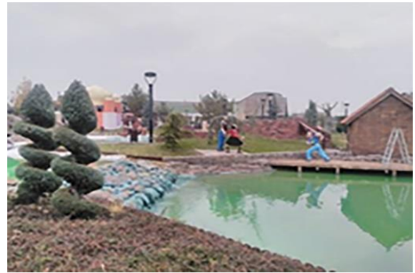
Resim 12. Buz Devri ve Temel Reis filminden bir sahne canlandırması