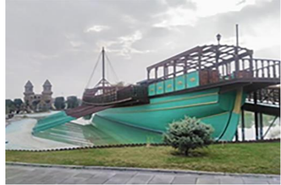
Resim 15. 80 Binde Devr-i Alem Parkı, kafeterya ve Osmanlı kadırgası

T-Rex Parkı'nı, Pamuk Şeker Parkı'na bağlayan bölümde ise bir kafeterya daha açık alanda ziyaretçilere hizmet vermektedir. Taşınabilir