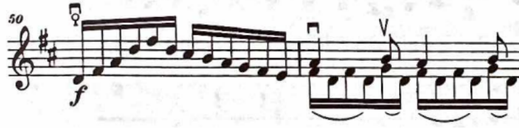
Şekil 10: Haydn Re Majör Viyolonsel Konçertosu 3. bölüm 50 ve 51. ölçüler

Otuz dördüncü ölçüyle birlikte Nakarat A tekrar başlar ve ellinci ölçüde C bölümüne bağlanır.