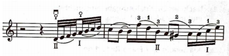
Şekil 2: Haydn Re Majör Viyolonsel Konçertosu 1. bölüm 35 ve 36. ölçüler

Otuz dördüncü ölçüde sonlanan A temasını dominant tonalitesi üzerinden sunulacak B temasına bağlayan modülasyonlu köprü otuz beşinci ölçüden başlar ve on beş ölçü boyunca devam eder.