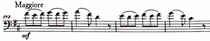
Şekil 11: Haydn Re Majör Viyolonsel Konçertosu 3. bölüm 172 ve 175. ölçüler

Yüz üçüncü ölçüde başlayan ve yüz on birinci ölçüde minör modaliteye bağlanan Nakarat A yüz yirmi beşinci ölçüde D bölümüne başlatır. Minör modda yüz yetmiş birinci ölçüye kadar devam eden D bölümünün ardından Nakarat A tekrar majör modda duyularak üçüncü bölüm sonlanır.