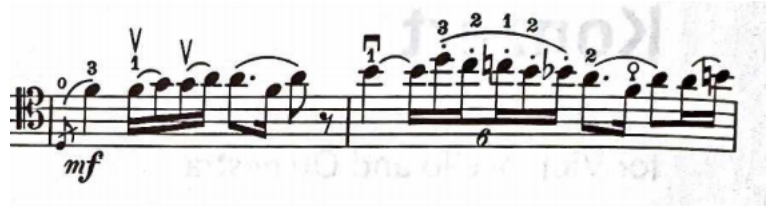
Şekil 1: Haydn Re Majör Viyolonsel Konçertosu 1. bölüm 29 ve 30. ölçüler

Otuz dördüncü ölçüde sonlanan A temasını dominant tonalitesi üzerinden sunulacak B temasına bağlayan modülasyonlu köprü otuz beşinci ölçüden başlar ve on beş ölçü boyunca devam eder.