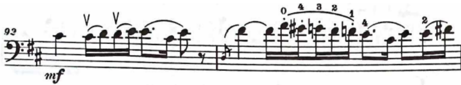
Şekil 4: Haydn Re Majör Viyolonsel Konçertosu 1. bölüm 92 ve 93. Ölçüler

Yetmiş yedinci ölçüde başlayan orkestral pasaj on beş ölçü boyunca devam eder ve doksan ikinci ölçüyle birlikte gelişme bölmesini dominant tonalitesi üzerinde başlatır.