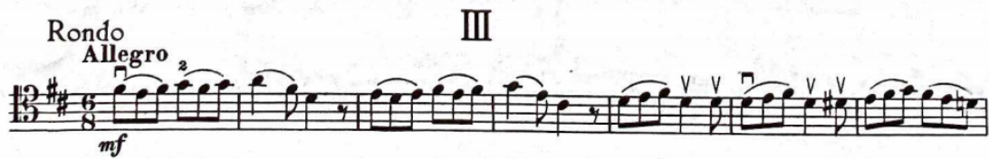
Şekil 8: Haydn Re Majör Viyolonsel Konçertosu 3. bölüm 1 ve 7. ölçüler

Eserin üçüncü bölümü re majör tonalitesinde, 6/8'lik ölçüde allegro tempoda başlar ve rondo formunda yazılmıştır. Nakarat A ilk on altı ölçüde duyulur.