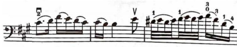
Şekil 6: Haydn Re Majör Viyolonsel Konçertosu 2. bölüm 17 ve 19. ölçüler

B bölümü on yedinci ölçüde başlar ve yedi ölçü boyunca devam eder. Yirmi dördüncü ölçüde bitiş ölçüsünün yok edilmesi yöntemi ile bölümün sonu, beraberinde başlayan köprünün de başıdır.