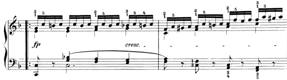
Şekil 9. C. Czerny op. 299 17 numaralı etüdün 9. ve 10. ölçüleri

Tablo 3'te görüldüğü üzere C. Czerny'nin op. 299 17 numaralı etüdünde her iki elin birlikte kullanımında etüt boyunca sağ eldeki ezgiye karşı sol eldeki atlamalı ses ve akorların uyumlu çalınması, aynı anda sağ el non-legato çalınırken sol elin legato çalınması ve tempoya uygun şekilde her iki elin eş zamanlı çalınması çalışmaları göze çarpmaktadır.