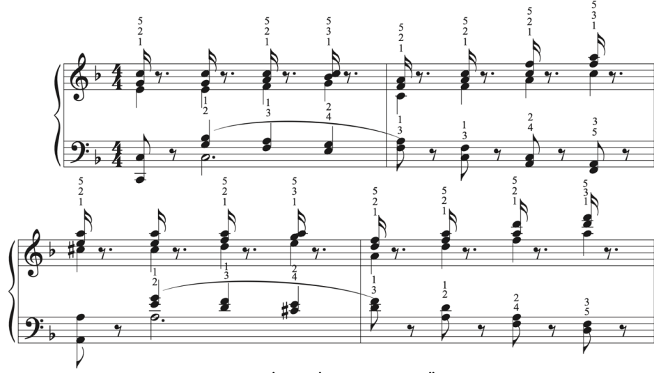
Şekil 11. Her İki El İçin Alıştırma Örneği 2

Şekil 11’de hazırlanmış olan alıştırmada aynı anda sağ el non-legato çalınırken sol elin legato çalınması teknik becerisinin pekiştirilmesi amaçlanmaktadır. Parmak numaralarına dikkat edilerek çeşitli tempolarda bu alıştırmaların çalıştırılmasının etüdün hatasız çalınmasını sağlayacağı düşünülmektedir. Hazırlanan alıştırma örneğinde etüdün 9, 10, 11 ve 12. ölçülerinin çalıştırılması hedeflenmektedir.