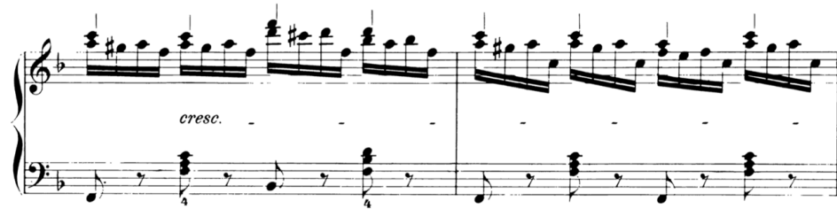
Şekil 6. C. Czerny op. 299 17 numaralı etüdün 5. ve 6. Ölçüleri

Tablo 2’de görüldüğü üzere C. Czerny’nin op. 299 17 numaralı etüdünün sol el için non-legato, legato ve akor tekniği çalıştıran bir etüt olduğu düşünülmektedir. Etüt boyunca legato tekniği sadece 2 ölçüde kullanılmakta olup çoğunlukla non-legato tekniği çalıştırılmıştır. Aynı zamanda etütte sol elde toplam 15 ölçüde bir oktavı aşan atlamalı ses ve akorlar bulunmaktadır. Etütte sadece 2 ölçüde tutan seslere rastlanmış olup 4 ölçüde ezgi duyurma teknik becerileri bulunmaktadır.