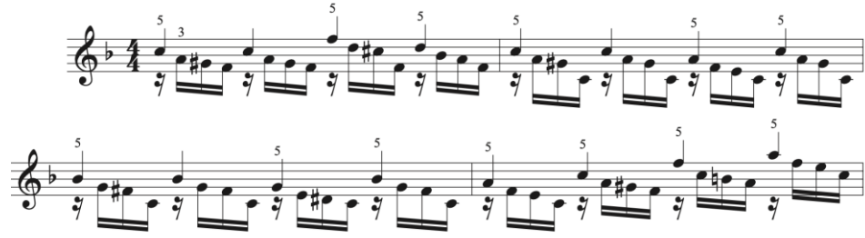
Şekil 5. Sağ El İçin Alıştırma Örneği 4

Şekil 5'te hazırlanmış olan alıştırmada çoğunlukla repete tekniğinin pekiştirilmesi amaçlanmaktadır. Orta parti çeyrek vuruş sus ile başlatılmış, etütte kullanılan sesler çerçevesinde bir çeşitlendirme yapılmış ve hazırlanan bu alıştırma ile elin konumunun pekiştirilmesi de hedeflenmiştir. Aynı zamanda alıştırma; non-legato tekniği, tutan sesler, zayıf parmakların art arda kullanılması, ezgi duyurma teknik becerilerini de içermektedir. Hazırlanan alıştırma örneğinde etüdün ilk dört ölçüsü göz önünde bulundurulmuş olup bu alıştırmanın etüdün sonuna kadar uzatılabileceği düşünülmektedir.