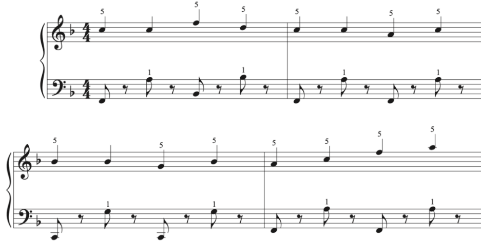
Şekil 10. Her İki El İçin Alıştırma Örneği 1

el non-legato çalınırken sol elde legato tekniği ile küçük bir ezgi yürüyüşü bulunmaktadır.