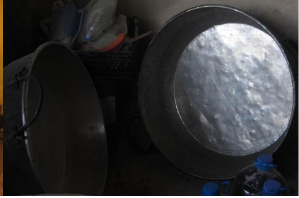
Resim 16: İçinde ekmek, börek, et pişen piniyet kabı.