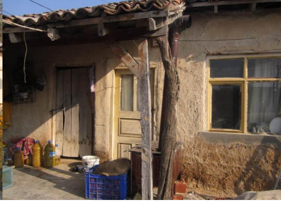
Resim 19: Yürüme zemininde dar sundurma örneği.