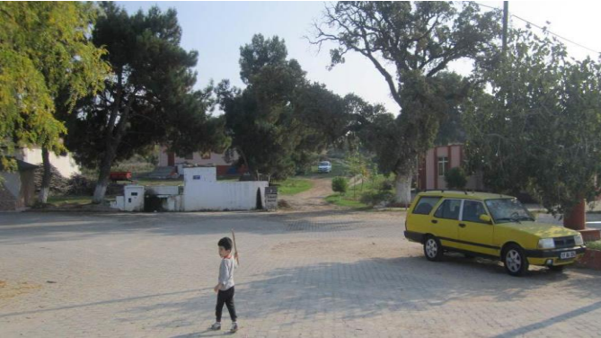
Resim 22: Bozköy meydanı çocukların oyun alanı.