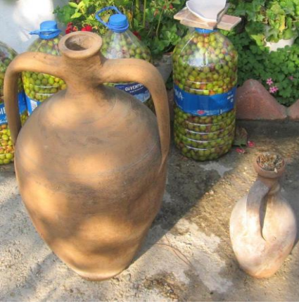
Resim 20: Su taşınan testiler.