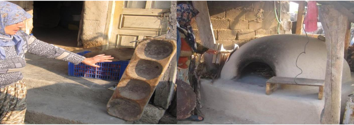
Resim 17: Avlulularda büyük fırınları kullanan kadınlar.