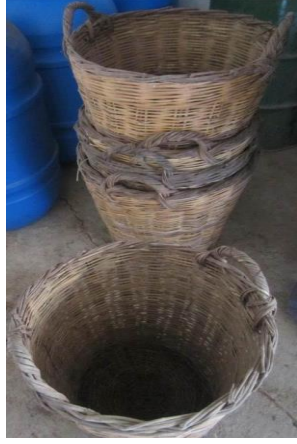
Resim 25: Kelatir, hasır küfe.