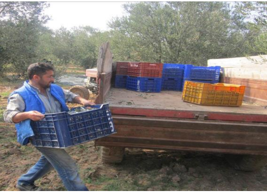
Resim 29: Erkekler kasaları traktöre taşımaktadır.