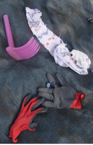
Resim 27: Kadınların kullandıkları tarak.