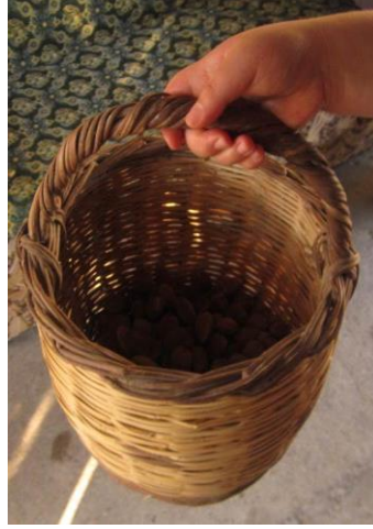
Resim 28: Kadınların zeytinde kullandıkları sepet.