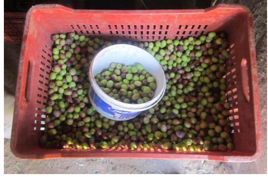
Resim 26: Bugün zeytinde plastik kasa kullanılır.