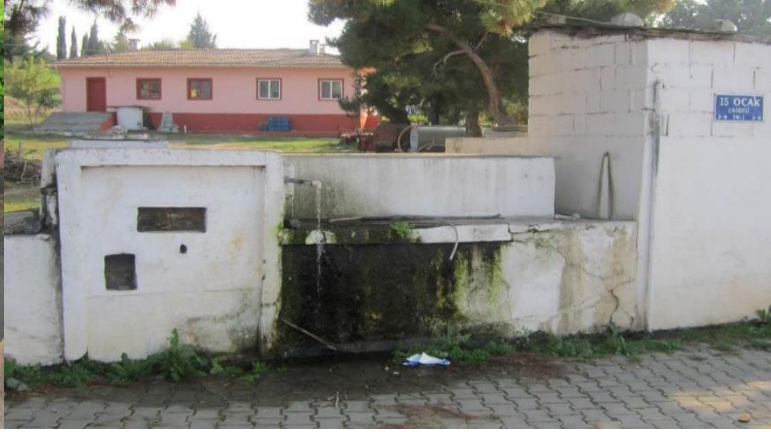
Resim 21: Köy meydanındaki çeşme.