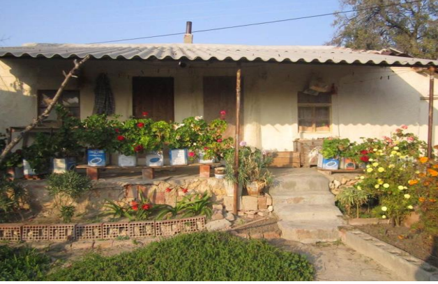
Resim 18: Veranda tipinde basamakla çıkılan sundurma.