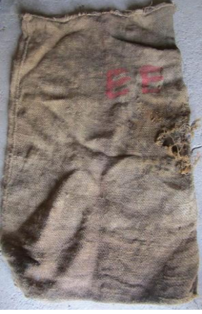
Resim 24: Bez çuval.