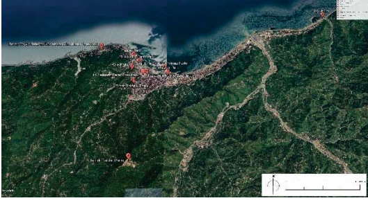
Şekil 1. Çalışma alanlarının konumu (Anonim, 2021)