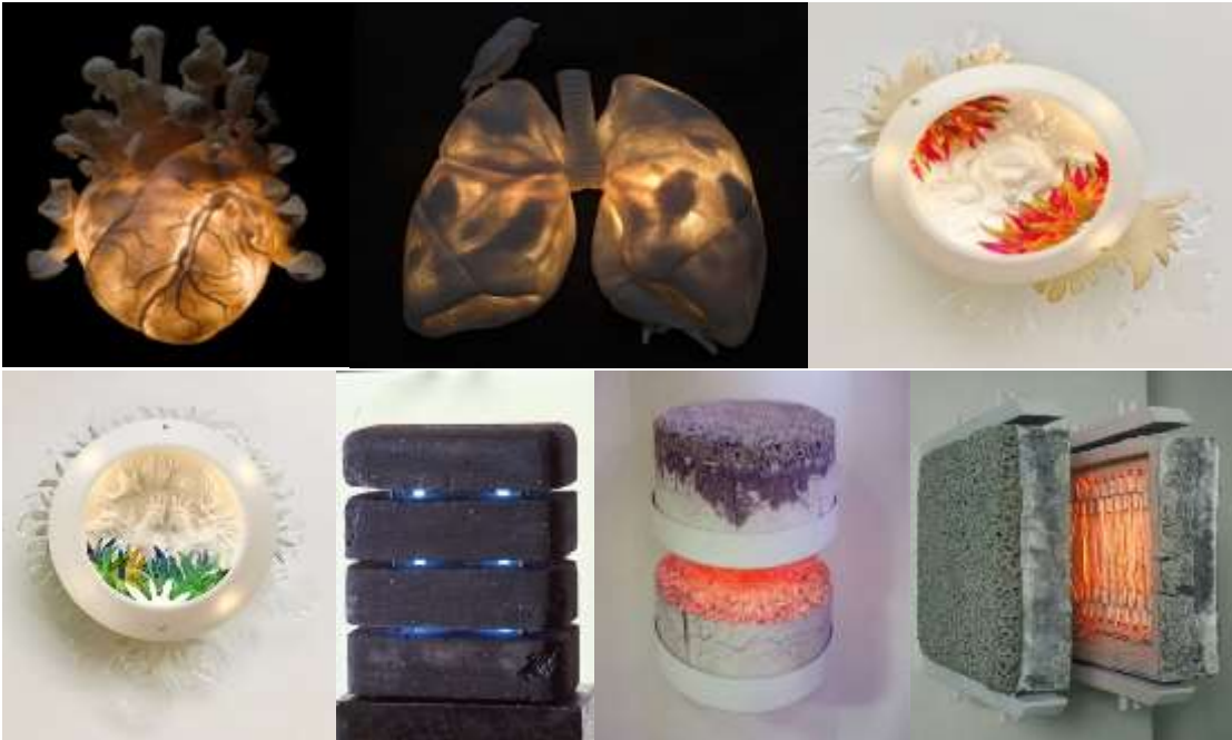
Görsel 15: Kate Mac Dowell(1-2), Ute van der Plaats(3-4), Füsün Kavalcı(5) ve Susannah Biondo'nun(6-7) Eserlerinden Örnekler (URL-24, 25, 26, 27)

Seramik malzemenin kendine has özellikleri, ışıkla birleştiğinde etkili bir ifade ortaya koymaktadır. Porselenin ışık geçirgenliğini ele alan sanatçılar çeşitli ışık kaynaklarıyla bu malzemenin ifade dilini genişletmişlerdir. Aynı zamanda sanatçıların bazıları farklı seramik bünyelerde ışığı doğrudan plastik bir olgu olarak eserin bir parçası olarak kullanırken, bazen de bu ifadeyi güçlendirmek için ışığa rengi ve gölgeyi de dâhil etmişlerdir (Sarıç & Gök, 2020, s. 869). Porselenin ışık geçirgenliğini çağdaş anlamda yorumlayarak eserlerinin içerisine çeşitli yapay ışık kaynakları yerleştiren Amerikalı sanatçı Kate Mac Dowell ve Almanyalı sanatçı Ute van der Plaats, eserlerinde neon ışıklar kullanan Füsün Kavalcı; çağdaş seramik sanatında farklı malzeme kullanımına yeni bir yaklaşım tarzı katan sanatçılardandır. Ayrıca Amerikalı sanatçı Susannah Biondo; bazı seramik eserlerinde seramik fırınına anımsatır şekilde metal kanthal tel ve elektrik yardımı ile eserlerine ısı ve ışık entegre ederek çağdaş seramik sanatında farklı malzeme kullanımı konusunda oldukça farklı bir bakış açısı sunmuştur.