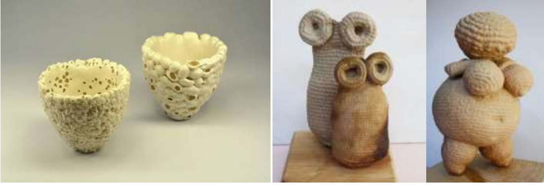
Görsel 5. Demet İper Dicle(1) ve Aykut Alp Gürel'in(2-3) Eserlerinden Örnekler (Yılmaz, 2019, s. 204 - Gürel, 2015, s.128)