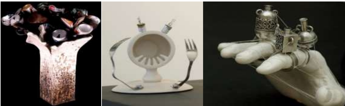
Görsel 8. Kemal Uludağ(1), Yeşim Bayrak(2) ve Ronit Baranga'nın(3) Eserlerinden Örnekler (URL-11, 12, 13)

Kemal Uludağ, Yeşim Bayrak ve İsraili Ronit Baranga'nın çağdaş seramik sanatında farklı malzeme olarak metal kullanımı konusunda örnek olarak sunulabilecek eserleri bulunmaktadır.