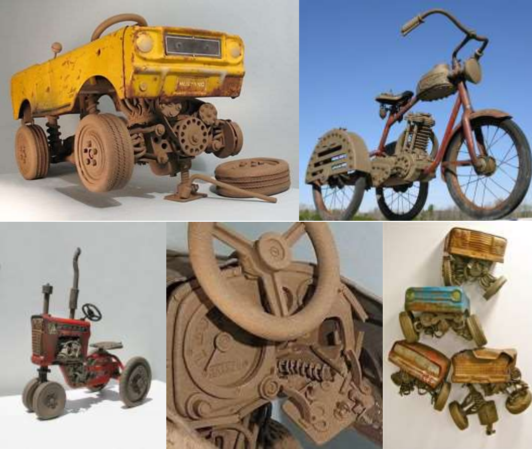
Görsel 13. John Brickels'in Eserlerinden Örnekler (URL-22)

Amerikalı sanatçı John Brickels; gerçek otomobil ve motosiklet parçalarının bazılarını seramik malzemeden yaparak diğer orijinal parçalar ile birleştirmekte ve konumuz ile ilgili çarpıcı örnekler sunmaktadır.