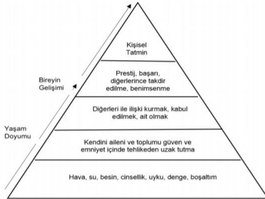
Şekil 2. Maslow Teorisi Bağlamında, Yaşam Doyumunun İnsan Gelişimi Perspektifi (Sirgy,1986; aktr. Kula ve Çakar, 2015, s.196)

Şekil 1 incelendiğinde teori içerisinde ilk iki basamağın yoğun olarak fizyolojik ihtiyaçlara yönelik, sonraki basamakların da yoğun olarak sosyolojik ve psikolojik ihtiyaçlara yönelik olduğu dikkat çekicidir. Sosyal bir canlı olan ve sosyalleşmesi için öncelikli olarak temel fiziksel ihtiyaçlarını karşılaması gereken insanın aksi bir durumda bu basamaklara önem vermeden sonrakilere yoğunlaşması mümkün değildir. Sirgy (1986) tarafından yapılan ve yaşam doyumunun insan gelişimi perspektifini anlatan çalışma kapsamında Maslow'un ihtiyaçlar hiyerarşisi teorisine bireyin gelişimi ve buna bağlı olarak yaşam doyumu dengeleri eklenmiştir (Şekil 2) (Kula ve Çakar, 2015, s.196).