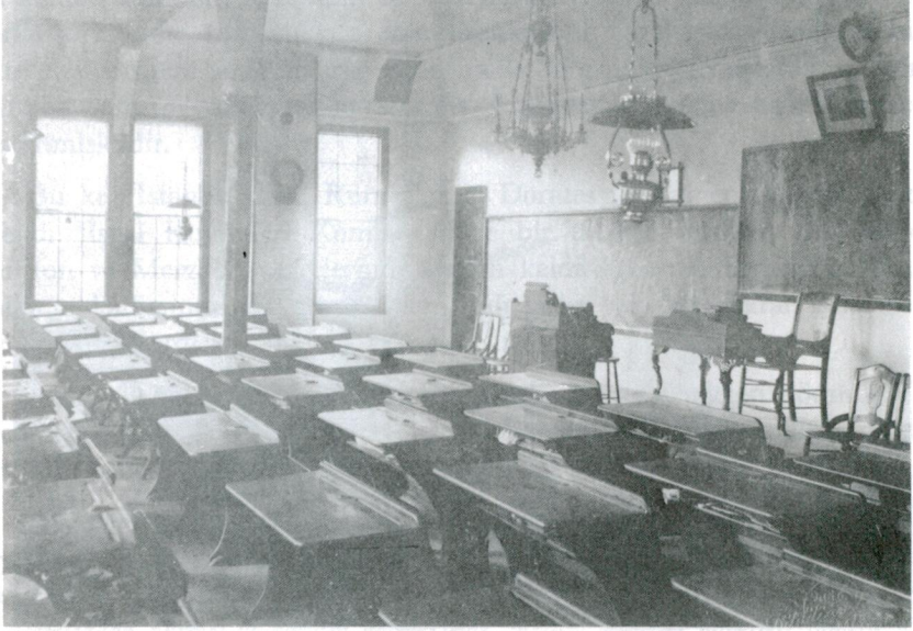
Res. 3 — Anadolu Koleji'nde bir dersaneden görünüm.