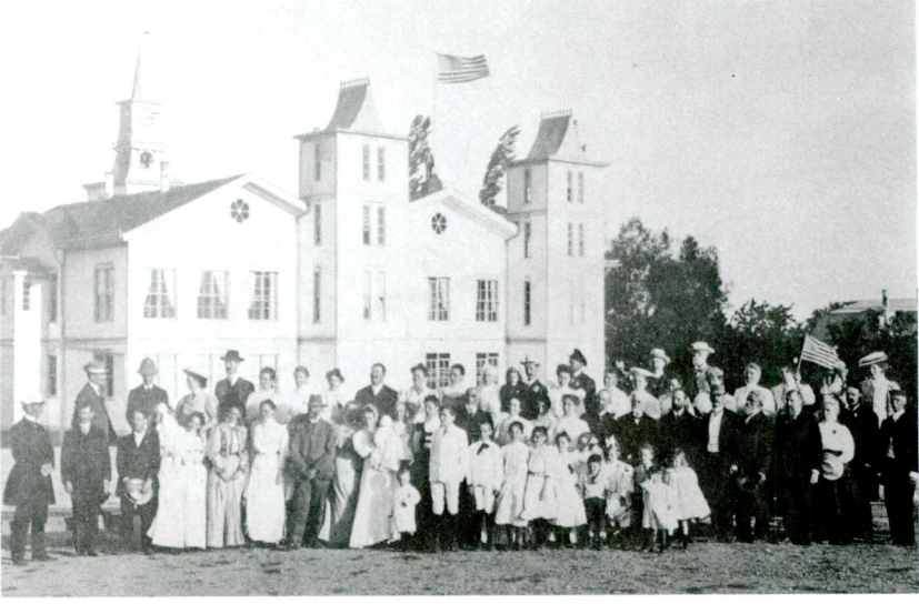
Res 5 — 1910 yılında yapılan misyonerlerin yıllık toplantısına katılanlar, Anadolu Koleji önünde toplu halde görülüyor.