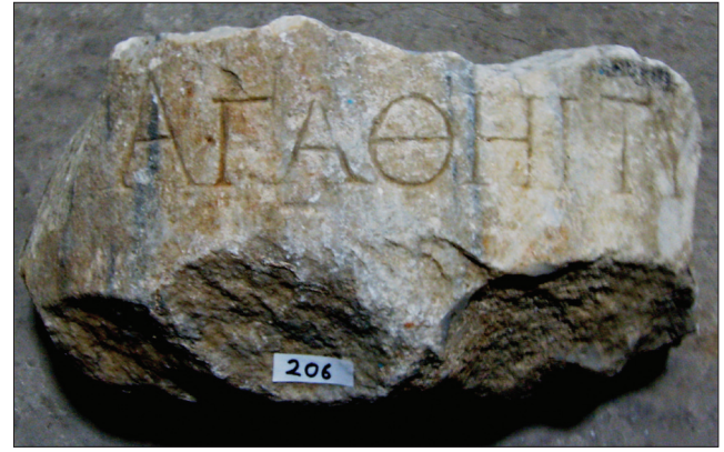
Resim 7: Fragman / Fragment

Yazıt taşıyıcısı oldukça kaliteli bir mermerden yapılmıştır ve üzerindeki yazının da karakteri çok düzgündür. Yazıtın başlama formu ve kalitesi bunun bize ya bir onur ya da bir adak yazıtı olabileceğini düşündürmektedir. Amastris'te ἀγαθῆι τύχηι ifadesi ile başlayan yazıtlar için bk. Marek 1993b: 160, no. 7; 161, no. 10; 165, no. 25; 166, no. 30; 186, no. 113.