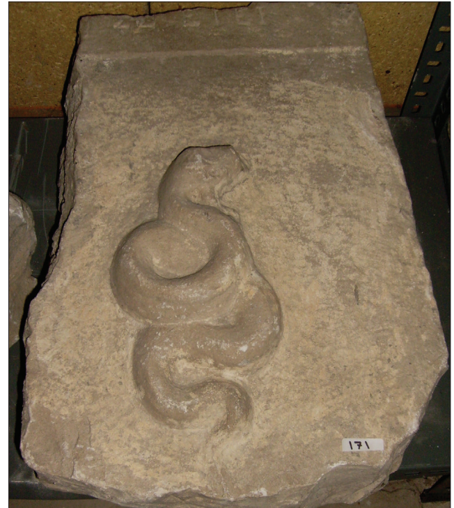
Resim 2: Glykon için Bir Adak / Dedication for Glykon?

2 Yazıtta 207 olarak geçen tarih Amastris'te kullanılan Lucullus era'sına göre, MS 136/137 yılına denk düşmektedir. Kentin era'sı için bk. Marek 1985: 144–152; Marek 1993a: 37, 129; Leschhorn 1993: 162–168; McLean 2002: 176.