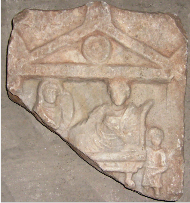
Resim 6: Adı Bilinmeyen Bir Kişinin Mezar Steli / Grave Stele of An Unidentified Person

Buluntu Yeri : Amasra'daki antik kentin akropolis'i olan şimdiki Nal Tepesi'de bulunmuştur. Stel, 17.06.1961 yılında Amasra Arkeoloji Müzesi'ne getirilmiş ve şimdi Müze deposunda bulunmaktadır (Müze Env. No.: 7-4.3 A 61).