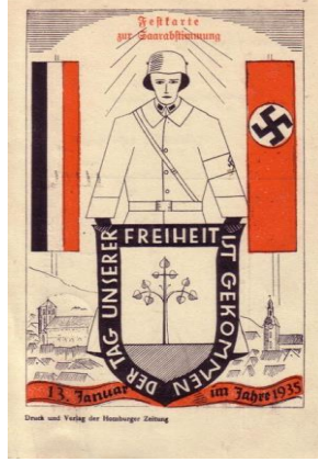
Resim 6. Özgürlük Konulu Propaganda Kartpostalı ( https://hv-lebach.de/Bilder/Saarabstimmung_1935/ipage00041.htm )

Temsil işlevi boyutunda ele alındığında kartpostalda Saarland'ın Almanya'ya katılmasıyla Saarland halkının özgür hale geleceği düşüncesi ön plana çıkarılmaktadır. Kartpostalın arka planında yer alan evler, Saarland'ı simgelemektedir. Alman İmparatorluğu'nun bayrağının da kartpostalda yer alması, Saarland'ın geçmişte Alman İmparatorluğu'nun bir parçası olduğu algısını meydana getirmektedir. Saar Sorunu adlı çalışmada, Saar coğrafyasının Prusya için vazgeçilmez olmasının stratejik konumda olduğuna değinilmiştir (Greenwood & Powys, 1935:28). Prusya'nın da tarihte bir Germen devleti olması, bugünkü Nazi Almanya'sının milliyetçi kökleri açısından da önemlidir. Bu aşamada kartpostalda Nazi Almanya'sının bayrağının da bulunması Saarland'ın Nazi Almanya'sının da bir parçası olacağı mesajını vermektedir. Diğer yandan kartpostalda yer alan erkek görseliyle de Nazilerin Saarland'da kontrol kuracağı algısı oluşturulmaktadır. Kartpostaldaki yazılar üzerinden de Saarland'ın Almanya'yla birleşmesi sonucunda Saarland'ın sağlam, düzenli bir bütünlüğe ulaşacağına dair algı oluşturulmaya çalışılmaktadır. İstem işlevi üzerinden incelendiğinde kartpostalda Saarland'daki Alman diasporasının özgürleşmesi için Almanya'yı desteklemesi gerektiği mesajı verilmektedir.