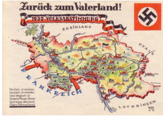
Resim 7. Anavatan Konulu Propaganda Kartpostalı

Doğrudan Saar bölgesinin haritası üzerinden 1935 yılı referandumunu Alman bayrağı üzerinden gösteren kartpostal incelendiğine Saarland'ın stratejik durumuna ilişkin Saar nehriyle ayrılan ve Fransız sınırına bitişik olan Der Gau bölgesine işaret etmektedir (UNECE,2019). Almanya'nın bir parçası olduğu düşüncesi ön plana çıkarılmaktadır. Kartpostalda yer alan Nazi sembolü gamalı haç ile Almanya ile Saarland'ı çerçevede bütünlemektedir. 1935 Referandumunu günlük gelişmelerle çalışan Wambaugh, referandum sonucunun yüksek oranda Nazi Almanya'sına çıkmasının bir nedeninin de propaganda da Saar bölgesini Almanya ile birleşik, bütün halinde resmedildiğine dikkat çekmiştir (Wambaugh, 1935: 41). Saarland ve Almanya sınırının ortasına gamalı haçın konulmasıyla, referandum sonucunda Saarland halkının Almanya ile beraberliğine vurgu yapmıştır İstem işlevi boyutunda ele alındığında kartpostalda Saarland'daki Alman diasporasının Almanya'ya katılım sonucu coğrafi bilgi ile pekiştirilmektedir.