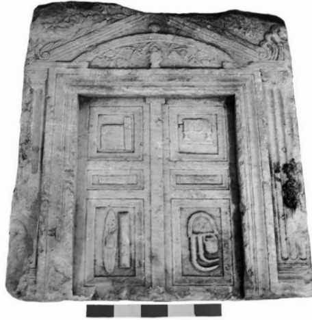
Resim 1: Sebaste Kapı Tipli Mezar Steli