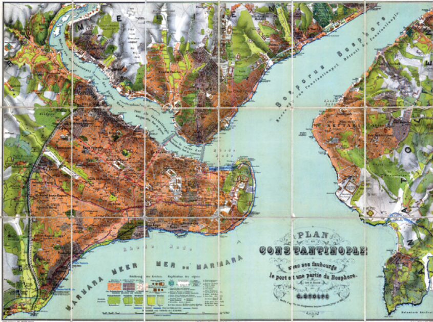
G. 7: C. Stolpe, “İstanbul Planı”, 1882

“O esnâda İstanbul'un bazı yerlerinde, eskiden kalma Osmanlı eserlerinden kasrı-hümâyünların yıkımına girişildiği gibi Üsküdar'da, deniz kenarındaki tarihî binalar ve deniz tarafından hoş manzarası ile meşhur Şemsi Paşa Köşkü dahi yıkılıp tahrip edilerek arsası “güyâ” Millet Bahçesi olmak üzere terk olunmuştur. İstanbul tarafında Sarayburnu'nun karşısında başkaca hoş bir manzaraydı” 33 .