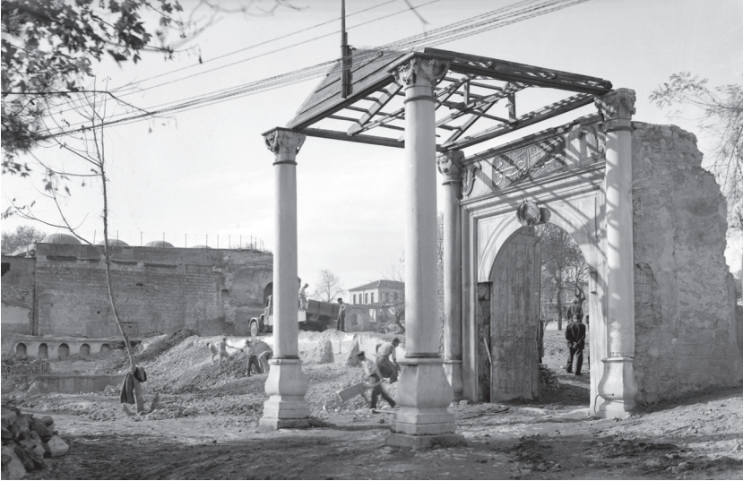
G. 8: Sultan Ahmed Meydanı'nda inşâ edilen Hapishane-i Umumi'nin 20. yüzyıl başındaki bir fotoğrafı.

1870 yılına kadar Tersane-i Âmire'de kürek cezasına mahkûm edilen suçlular için merhamet kaidesi ve adalet icrası hükmünde Sultanahmet Meydanı'nda bulunan eski mehterhâne (hayme çadırları mühimmatına tahsis olunmuştu) yenilenecek açılmıştır (G. 8). Çokça masraf yapılarak ağır suçlular ile üç yıla kadar hapis yatacaklara mahsus iki bölümde koğuşlar, hastahaneler, ehl-i sanat için mahaller ile hamam, cami ve kilise gibi bölümleriyle mükemmelen yenilenen hapishanenin bir de seyri için birkaç gün açık bırakılmasını yadırgayan Ahmed Lûtfî Efendi bu durumun ceza olup olmadığını sorgulamıştır. İtiraz başlığı altında, adaletin tesisi ve merhametin hâkimiyeti için yaptırım ve kuvvet gerekse de; suçluların bir süre mahkûmiyetlerinin böyle İstanbul'un Sultanahmet gibi orta yerinde olmasını yadırgamaktadır. Her tür kabahat ve suçla mahkûm olan bazı "haşerelerin" tutuklanıp işsiz güçsüz hapsinin maslahat olamayacağını; vaktiyle kürek cezasına mahkûm olanların tersane hapsine konulmasıyla, bir hapishanede tutulmalarının denk olmadığını ve buna başka bir ad verilmesi gerektiğini "havâtır-ı kâsıra-i fakîrânemdendir" diyerek ifade etmiştir. Üstüne de halkın hapishaneyi seyretmek üzere davet edilmesini anlamadığını, bunun kastının hapishanenin güzel hal ve rahatlık makamı olduğunu gören halkın özendirilmesi mi demek olduğunu istihza ile eklemiştir 34 .