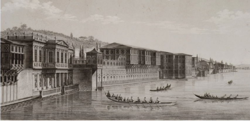
G. 5: Antoine İgnace Melling'in Defterdarburnu'nda Hatice Sultan Sarayı gravürü ( https://tr.travelogues.gr/page.php?view=88 ).

mimari zevkin deęişmesiyle olsun şehrin her köşesine hâkim olacak pek çok saray fikri yaygınlaştıkça şehrin sahibinin kim olduğunu gösteren yerlilik emareleri ve sivil mimarinin üst düzeye mahsus örnekleri çoğalmıştır. Bu yüzden sarayın taşınması hadisesi Osmanlı Devleti için biraz farklı değerlendirilebilir. Bütün yüzyıl boyunca yapılan köşk, kasır, sahil saraylar ve saraylar Batılı örneklerin bir taklidi deęil, kendilerine özgü karakteri olan mimari yapılarıdır (G. 5). Bununla birlikte bu yapılar, III. Selim dönemine kadar yapılan eski ahşap sarayların yerini aldığı gibi, insan ve evi arasında daha önceki örnekler ile sağlanmış uyumu yakalayamamıştır 25 . Batılı tipin üslup gösterişine rağmen 18 ve 19. yüzyıllarda sivil mimari, geleneęi takip etmiştir 26 .