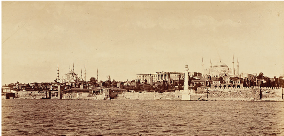
G. 1: Yıldız Albümlerinden Ahırkapı'yı ve Darülfünun binâsını gösteren bir fotoğraf (İstanbul Üniversitesi Nadir Eserler Kütüphanesi, II. Abdülhamit Han Fotoğraf Albümleri).