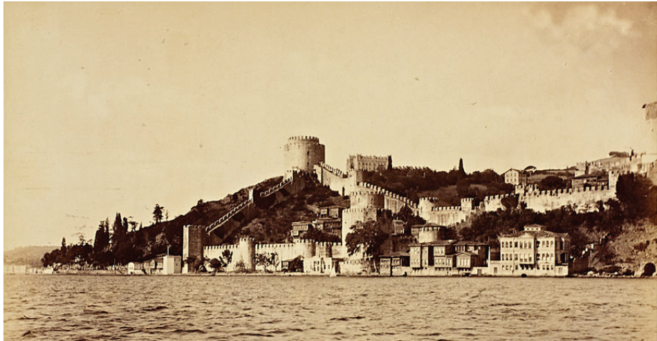
G. 6: Yıldız Albümlerinden Rumeli Hisarı'nı gösteren bir fotoğraf (İstanbul Üniversitesi Nadir Eserler Kütüphanesi, II. Abdülhamit Han Fotoğraf Albümleri).

İstanbul'da yeni meydan düzenlemelerinin yapılması ve yolların genişletilmesi yeni belediye dairelerinin kurulmasıyla ilgili adımlarla başlatılmıştır. Belediyelerin kurulması süreci sonunda, İstanbul için ilk farkına varılan şey meydan, yol, kaldırım ve park denilen kentsel ihtiyaçların yokluğu olmuştur. Divanyolu genişletilmiş ve Köprülü Külliyesi de tıraş edilmiştir. O dönemden günümüze, yol ve meydan için tarihî yapıların tahrip edilmesinin de olumsuz bir tavır olarak sürüp geldiğini vurgulamak gerekmektedir. 30 İstanbul'da 1869 yılı itibarıyla yapılan cadde ve yol düzenlemeleri esnasında Ayasofya etrafındaki evlerin yıkılmasıyla açığa çıkmış, Maliye hazinesi girişinde iki taraflı bir meydan ve oradan Beyazıt Camii'ne kadar dükkânların yıkılmasıyla muntazam bir cadde yapılmıştır. Buğdaycılar kapısıyla Kürkçüler kapısı arasındaki arsanın yükseltilmesi ve Hasan Paşa Karakolu'ndan Laleli Camii'ne geniş bir yol açılmasıyla ile güzel bir manzara elde edilmiştir. Tophane ve Beyoğlu tarafları da bu şekilde genişletilip düzenlenmiştir. Ahmed Lûtfî Efendi günümüze de bu şekilde gelen yol ve cadde düzenlemelerini anlatırken dikkat edilmeyen bir şeye -mezar ve türbe yıkımına- dikkati çekmiştir: "Bu tesvîyeler sırasında mezarlar mı gelir, türbeler mi tesâdüf eder, bunların imhâsı mühimsenmemiştir. Ol vakit bu çığrı açanların çoğu tîz vakitte kazdıkları hufrelere canlarını atıp gitmişlerdir" 31 .