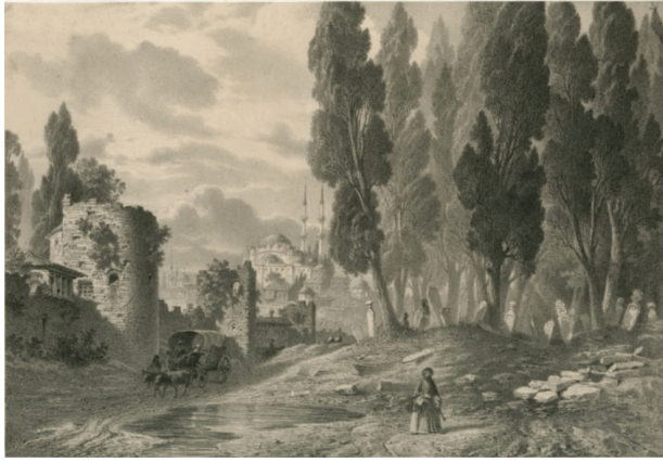
G. 2: Eugène Flandin’in Galata’daki surları konu alan gravürü ( https://tr.travelogues.gr/page.php?view=88 ).

larak iki tarafındaki kale duvarlarının enkazıyla zeminlerinin satılmasına başlanmıştır. Bu teşebbüsün kapısı Bahçekapısı'ndan açılarak bahsi geçeceği üzere diğer kapılara ve Galata tarafına dahi hemen sıçramış ve uçurum yıkıntısına Kule-i zemîn hasılatı adı verilmiştir (G. 2). Bu hasılat “Hüda’ya emanet Şehremaneti”ne taksim edilerek İstanbul ve Galata’nın önemli noktaları kapısız kalma mahzuruna rağmen, “birtakım esbâb-ı mûcibe-i eblehfiribâne ve mûgâlâta-i kâzibâne tertibiyle” ahalinin dedikodusuna set çekilmiştir. Ahmed Lûtfî Efendi bir taraftan devletin merkezinde İstanbul gibi nadir bir mamurenin kapılarının yıkılıp kaldırılmasıyla uğraşılırken diğer tarafta muazzam devlet kalelerinden ve fethi uğruna pek çok defa binlerce başın fedâ edildiği Belgrad Kalesi’nin dahi “kolayca terk olunuvermesine” esef etmektedir 17 .