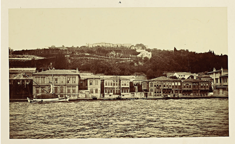
G. 11: Yıldız Albümlerinden Boğaziçi'nde yalılar gösteren bir fotoğraf (İstanbul Üniversitesi Nadir Eserler Kütüphanesi, II. Abdülhamit Han Fotoğraf Albümleri).

“O harikten sonra Mürekkepçiler Kapısı sadece sözde kalmıştır. Aslında Kâmil Paşa merhûmun konağı karşısında Sultan Bayezid tarafına gidilir iken orada bir kapı vardı. Sokakların düzeltilmesinde kapı kaldırıldı, ileriye doğru iki taraftan yerler alınarak meydan açıldı. Kâğıtçılar ile divitçiler bir karanlık dar sokak içindeydiler. Cadde tarafında tülbentçiler vardı. Atıllardaki bodrumlarda kâğıt perdâhçıları işlerdi. O zamanlar Avrupa'dan gelen kâğıtlar mühresiz kullanılmadığından her cins ham kâğıtları mührecilere perdah ettirirlerdi. Mührecilik âdetâ bir sanat olup epeyce halk geçinirdi” 48 .