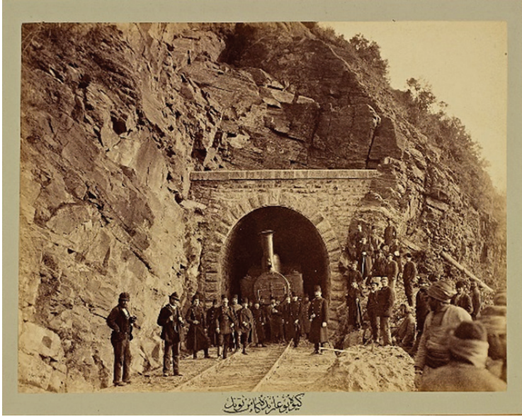
G. 9: Yıldız Albümlerinden Geyve Boğazında tünel girişinde İzmit demiryolunu gösteren bir fotoğraf (İstanbul Üniversitesi Nadir Eserler Kütüphanesi, II. Abdülhamit Han Fotoğraf Albümleri).

Yedikule'den Bahçekapısı'na yani Sirkeci İskelesi'ne kadar demiryoluna tesâdüf edip istimlâki gereken mahâllerin sahiplerine verilmek üzere yüzde sekiz fâiz ile iki yüz sekiz bin adet Osmânî lirası borçlanıldığını hatırlatmaktadır. Bu borçlanmadan emlak sahiplerine ödeme yapılmadığını, çoğunluğu yardıma muhtaç olan emlak sahiplerinin ne kadar uzun bir süre zor durumda kaldıklarını ve hesap kitâbın hangi yolla kapandığını “işin içinde bulunup da o zamanı idrak edenlerin hatrındadır” diyerek hatırlatmaktadır. Bir de ilmiye kökenli İmamzâde İmâdüddîn Efendi'nin durumunu örnek olarak anlatmaktadır: “Kendisi işini düzeltmekten yorulmayan, üşenmez bir zât idi, kendisinin Yedikule civârındaki emlakından alınan yerlerin, gerek fiyatlandırılması ve gerek tahsilinde senelerce uğraşıp, kaldığını bilirim. Sâir ahad hukûkuna gelince var kıyas et, vüs'at-ı deryâyı zahmet nidüğün” 43 .