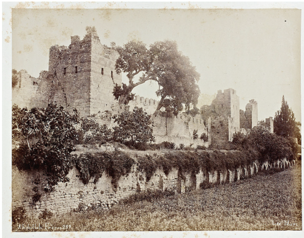
G. 3: Yıldız Albümlerinden Mevlavihane Kapı civarındaki surları gösteren bir fotoğraf.