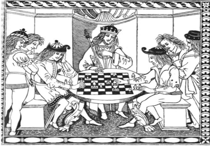
From the Libro di giuoco di scacchi , Florence, 1498.

Şekil 5. Libro di giuoco di scacchi isimli eserden bir görsel (Murray, 1913, s. 547)