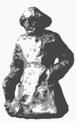
Şekil 1. MS 1- 2. yüzyıla ait Kuşan parçası 1

Fakat yukarıda anlatılanların yanı sıra az da olsa satrancın doğuşu ve yayılış güzergâhı ile ilgili farklı görüşler de bulunmaktadır. Satrancın Hindistan'dan veyahut Çin'den tüm dünyaya yayıldığı görüşünün aksine Kuşan Türkleri tarafından MS 50-200 yılları arasında bulunduğu fikri de mevcuttur (Josten, 2001, s. 13). Orta Çağ'ın bu popüler oyununun menşesi hakkında Josten, Yakın Doğu, Hindistan ve Çin ile yoğun teması olan bir kültür durumundaki Orta Asya Kuşan İmparatorluğu'na işaret etmektedir. Bazı bilim adamları tarafından "Unutulmuş Kuşanlar" olarak adlandırılan Kuşanlar, MÖ 50'den MS 200'e kadar Hindistan'ın önemli bir bölümünü içeren büyük bir imparatorluğu yönetmişlerdir. Bu bölgede MS 2. yüzyıla ait "satranç taşlarının" bulunmasından ötürü Josten, satrancın çıkış noktasının bu bölge olduğunu savunmaktadır.