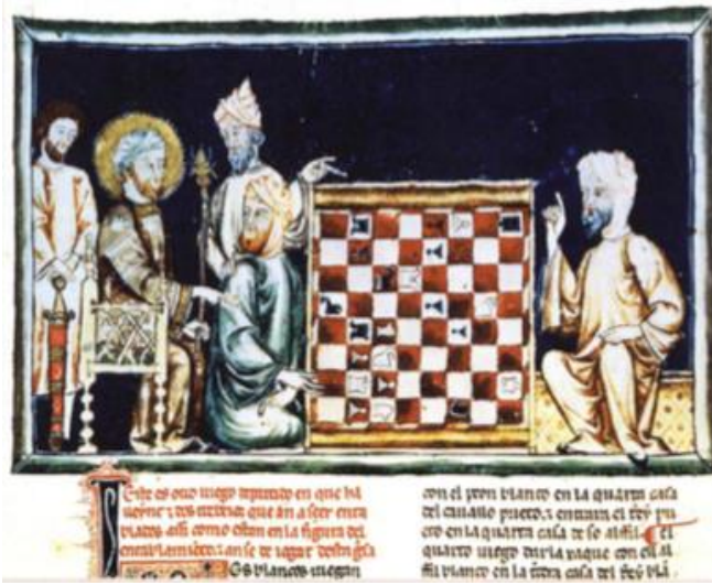
Şekil 6. X. Alfonso'nun iki satranç oyuncusuyla bir satranç problemi hakkında konuşması (Gordon, 2009, s. 22)

Yukarıda anlattığımız bilgilerden de anlaşılacağı üzere, Orta Çağ İspanya'sının satrancı büyük bir ilgi ile karşıladığı o döneme ait bilgiler ve kaynakların yoğunluğu sayesinde kendini gösterebilmektedir. Endülüs Müslümanlarından İşbiliye yani Sevilla'da yaşayan ve bu bölgenin itibarlı bir ailesi olan İbn Zühr ailesine mensup Ebu Bekr ez-Zuhrî el-Kureşî, 12. yüzyılın sonları ve 13. yüzyılın başlarındaki (öl. 1214-1224 arası) fıkıh ve edebi ilimler alanında önde gelen isimlerden birisidir. Kendisinin çok iyi satranç oynadığı ve hatta Sevilla'da kendisinden daha iyi satranç oynayan herhangi birisinin olmadığı, bu sebeple de Ebu Bekr ez-Zuhrî eş-Şatrancî olarak tanındığı bilinmektedir. Hatta bu şekilde tanınmaktan oldukça rahatsız olduğunu ve başka bir uğraş alanıyla isminin anılmasını istediğini, bu nedenle de başka bir alan bulmak ve onunla uğraşma gereği hissettiğini söyler. Bu düşüncesinden dolayı, tıp okumaya başlamış ve kısa süre içerisinde tıp ilmiyle adı anılmaya başlamıştır (Makdisi, 2007, s. 304, 306). Ebu Bekr ez-Zuhrî el-Kureşî ile ilgili var olan bu bilgilerle birlikte, İspanya sınırları içerisinde Müslümanlardan alınan satrancın hâkimiyet gücünün hâlâ Araplarda olduğunu anlıyoruz. Ebu Bekr ez-Zuhrî el-Kureşî'nin satranç ile anılmak istememesinin birçok sebebi olabilir. Ancak, klasik Avrupa tarih yazımında burada yaşayan Müslümanların satrancı oynadıklarıyla ilgili bilgiler neredeyse yok denecek kadar az olduğundan bu durum kayda değer bir bilgidir.