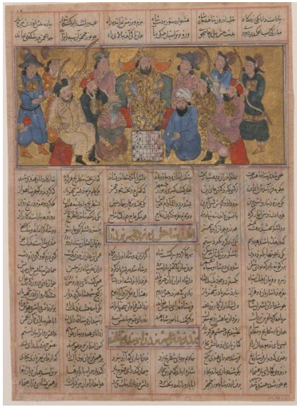
Şekil 3. Firdevsî'nin Şahnâme'sinde Büzürmihr'in satranç oyunu (The Met)

Birçok kaynağa göre İran, satranç ile 6. yüzyılda tanışmış ve oyun yüzyıllar boyunca bu coğrafyada yeni oyunların eklenmesiyle çeşitlenmiştir. Ancak, buna rağmen İran'da satrancın yaygın olarak oynanması Sâsâni döneminin sonlarına doğru gerçekleşmiştir. En azından 6. yüzyıldan itibaren satrancın temel formunun, bugün bilinen taş düzeneğinde olduğu gibi iki tarafında sekiz kare ile toplamda 16 kareden oluşan bir tahtada oynanıyor olduğu anlaşılmaktadır (Utas ve Dabirsiaqi, 1991, s. 393-397).