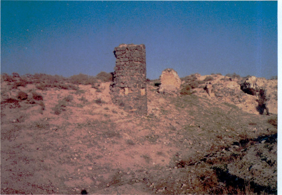
Resim 10 — Kale surlarında burc kalıntısı