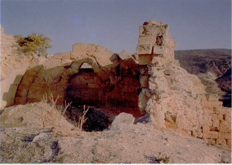
Resim 7 — Kale içinde bina kalıntısı