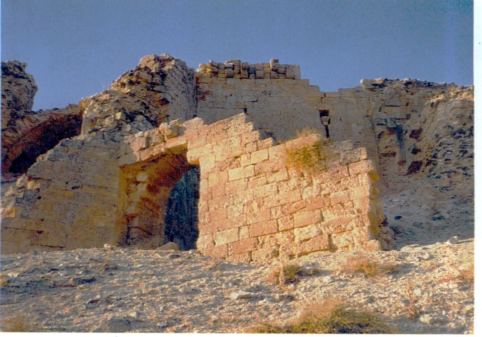
Resim 5 — Giriş kapısının başka bir görünüşü