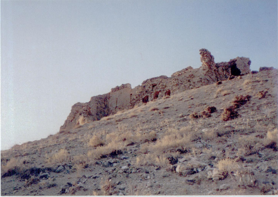
Resim 3 — Râvendân kalesine tepenin eteğinden bakış