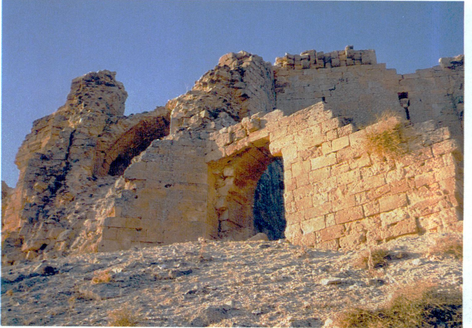
Resim 6 — Giriş kapısından görüntü