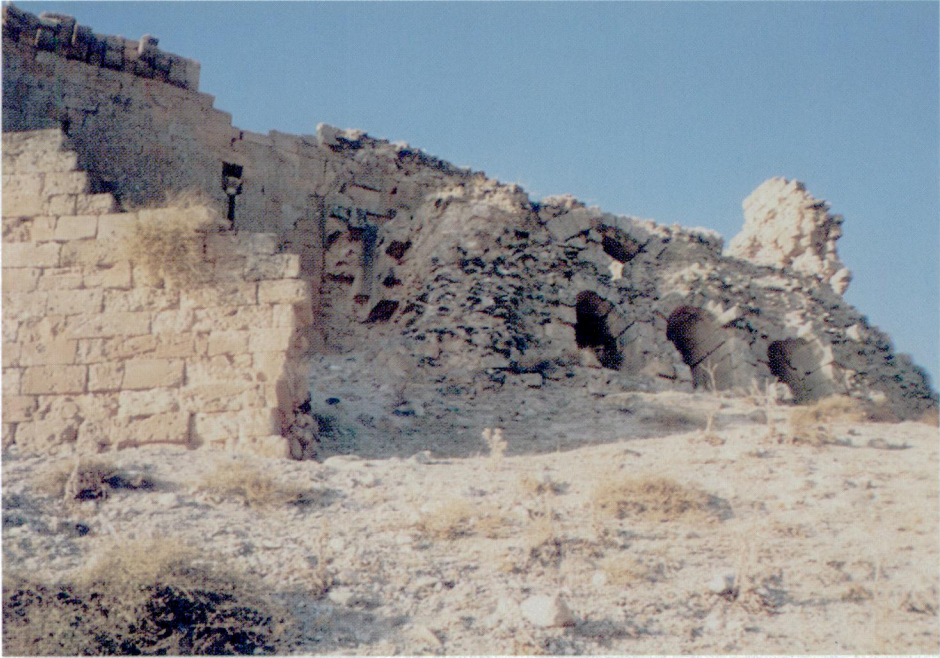
Resim 4 — Kalenin üç gözlü giriş kapısı