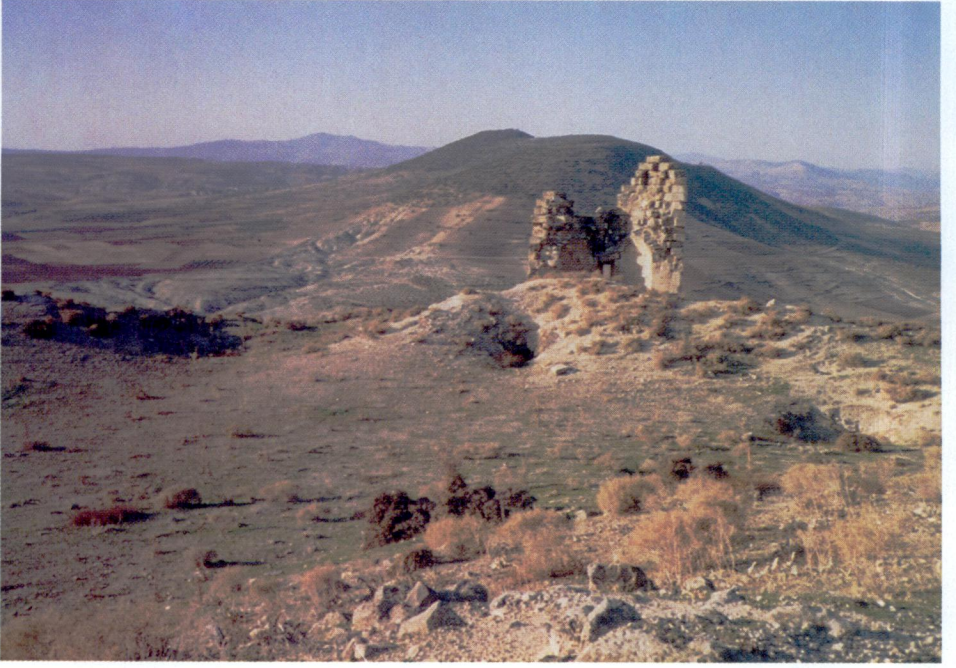
Resim 9 — Kalede bir burc kalıntısı