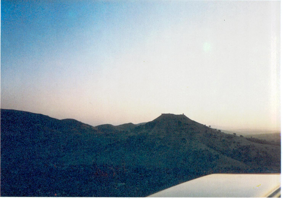
Resim 1 — Râvendân kalesinin yoldan görünüşü