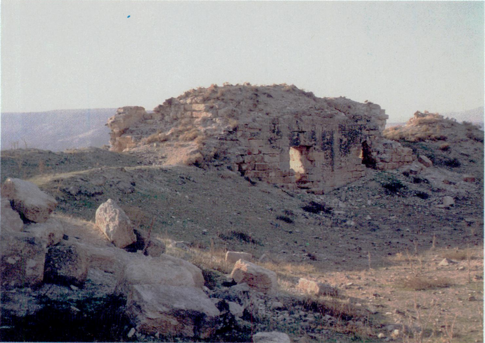
Resim 8 — Kale içinde bina kalıntısı