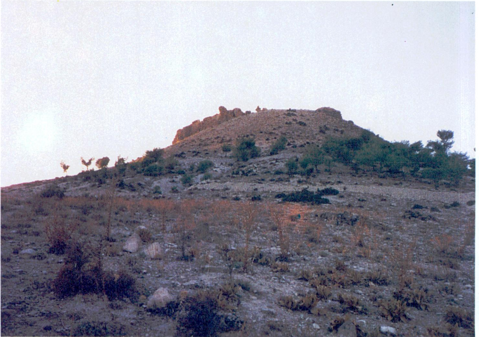
Resim 2 — Râvendân kalesinin Belenözü köyünden görünüşü