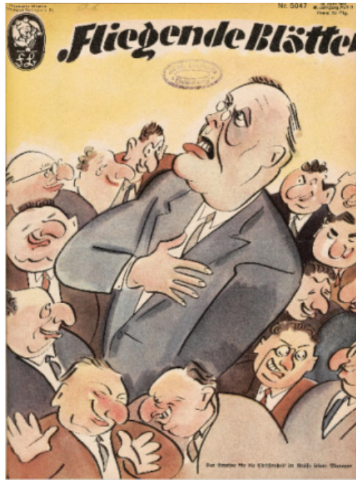
Resim 6. Yönetici konulu dergi kapağı