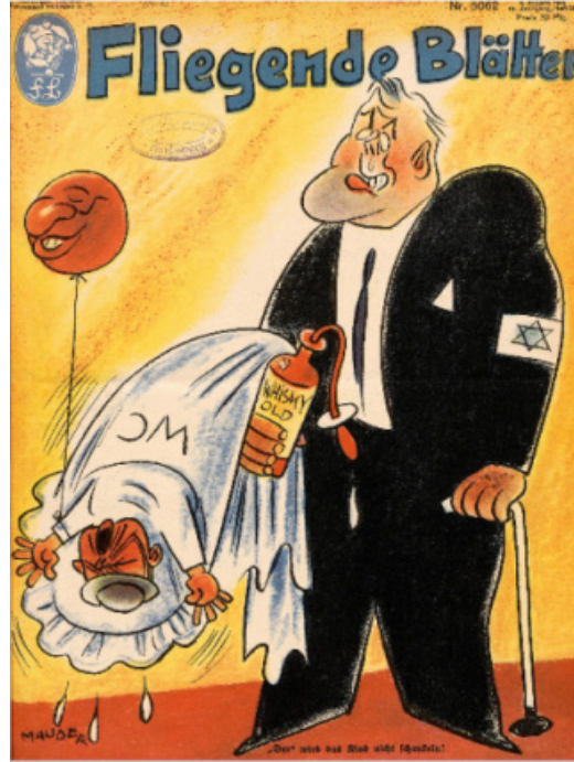
Resim 10. Bebek konulu dergi kapađı