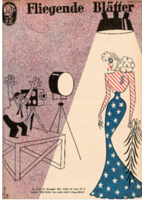
Resim 14. Film konulu dergi kapađı

Kaynak: (Blätter, Heidelberg historic literature – digitized, 1942)