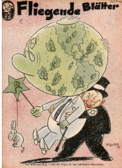
Resim 13. Oyuncak konulu dergi kapađı