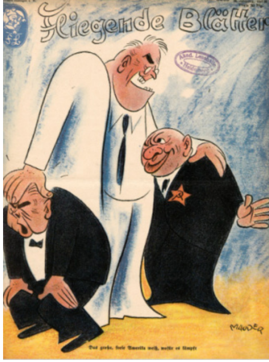
Resim 9. Amerika konulu dergi kapağı