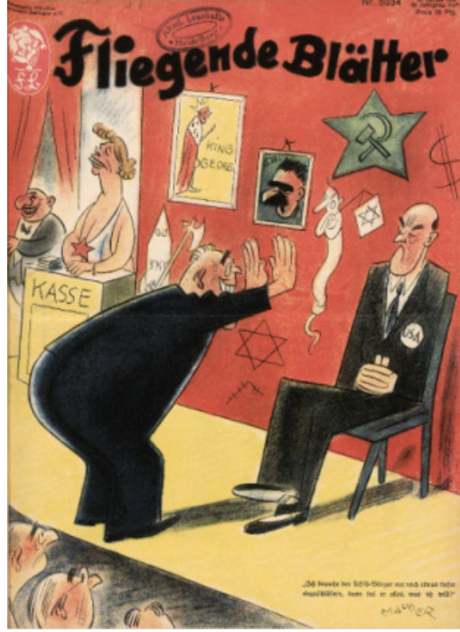
Resim 3. Vatandaş konulu dergi kapağı