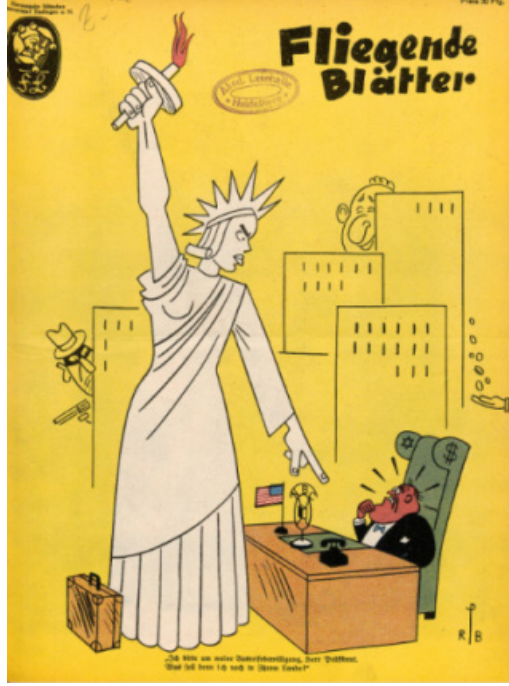
Resim 8. Heykel konulu dergi kapağı