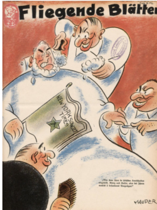
Resim 7. Hükümdar konulu dergi kapağı