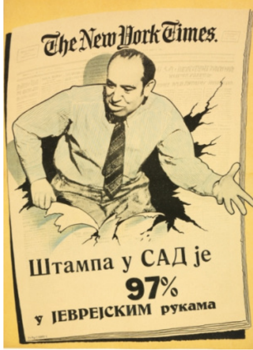
Resim 1. ABD'deki basın ve Yahudi konulu poster 1