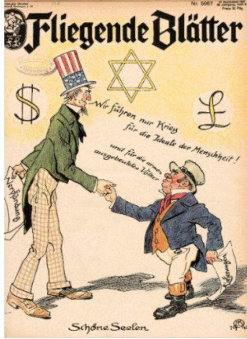
Resim 11. Savaş konulu dergi kapağı