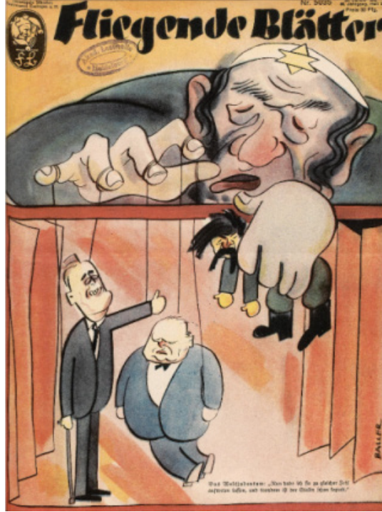
Resim 4. Kukla konulu dergi kapağı