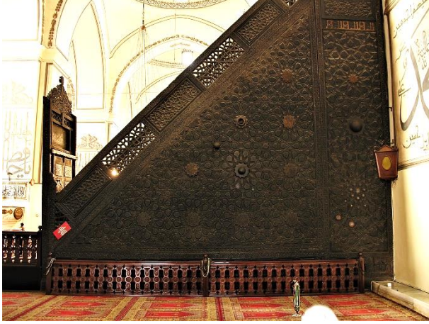
Resim-9. Bursa Ulu Camii Minberi'nin batı yüzü