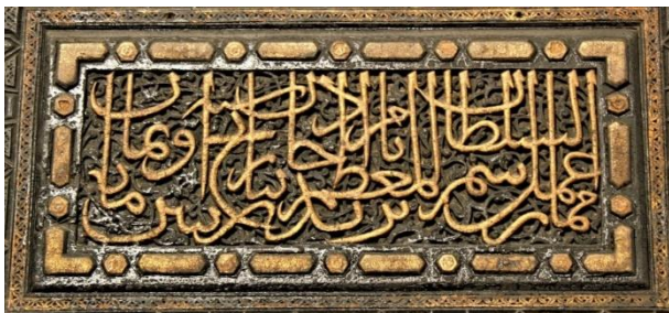
Resim-3. Bursa Ulu Camii minberi. Bani kitabesi