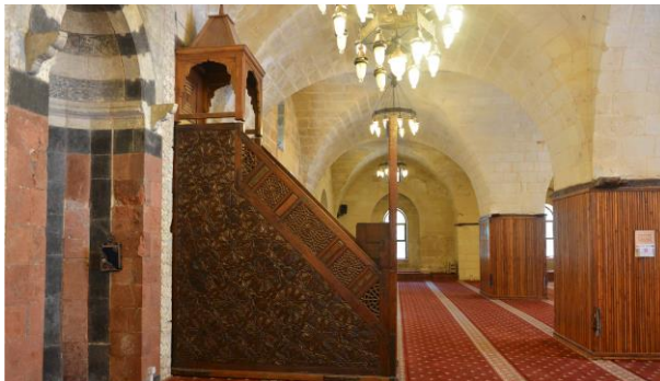
Resim-7. Gaziantep Boyacı Camii minberinin doğu yüzü Resim-8. Manisa Ulu Camii Minberi'nin doğu yüzü

Ressam Zekai, siyah bir vernik sürülmesiyle motiflerin zarar gördüğünü belirtmektedir. Gerçekten de bugün motif ayrıntılarının algılanmasındaki ve sağlıklı fotoğraf çekebilmenin önündeki en büyük engel, bugün de görülen siyah katmandır. Temizlenen kesimlerde motiflerin işlenişindeki ustalık daha net görülmektedir (Resim 10). Sürülen kimyasal maddenin, motifi oluşturan parçacıkların aralarını doldurduğu gözlenmiştir. Daha sonradan da bazı kimyevi maddeler sürülmüş olsa da bugünkü manzaranın temellerinin bir asrı aşkın süre önce atıldığı ortaya çıkıyor.