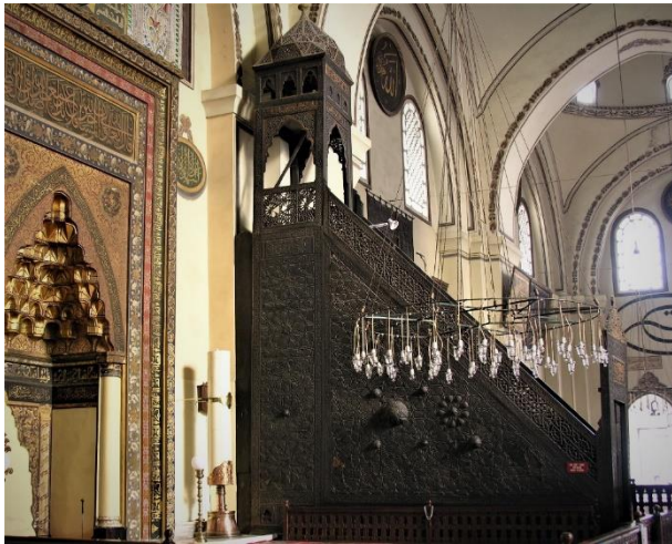
Resim-1. Bursa Ulu Camii minberinin doğu yüzü