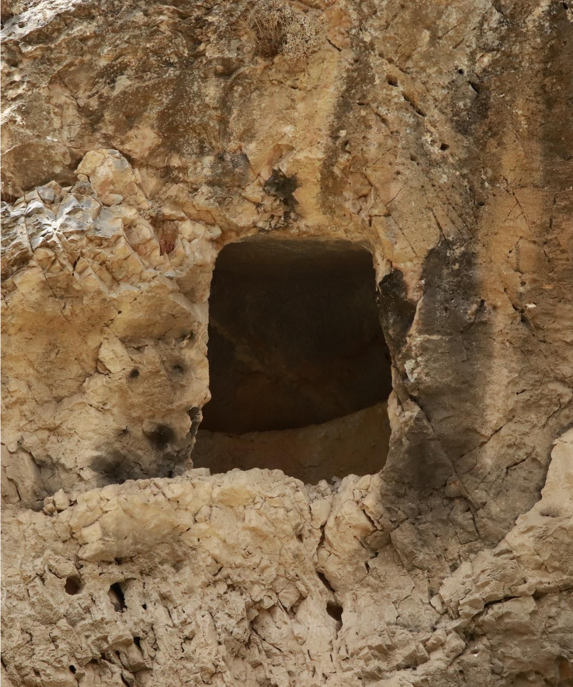
Figür 3. Kaya Mezar 3

Tanım: KM2'de tanımlanan mezarın 40 metre batısında konumlanmaktadır. İlk iki örnekte (KM1 ve KM2) ele alınan mezarlar ile benzer form ve tipolojik özelliklere sahip bir mezardır. Bu mezarın da bulunduğu konum sebebiyle detaylı ölçüleri alınamamıştır. Ancak lazer metre yardımıyla giriş açıklığının yüksekliği 128 cm olarak ölçülmüş olup, genişliği ve derinliği ölçülememiştir ( Figür 3 ).