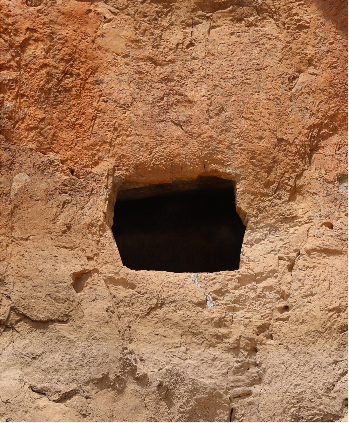
Figür 2. Kaya Mezar 2

Tanım: KM1'in 50 metre batısında yer alan bu mezar, aynı kaya yüzeyine oyulmuş dikdörtgen bir giriş açıklığına sahiptir. Söz konusu mezarın giriş açıklığı, 124 cm genişlik, 104 cm yükseklik olarak ölçülmüştür. Tavanı düz bir biçimde sonlandırılmış olan KM2'de yapılan gözlem ve incelemeler sonucunda bu mezarın da KM1 gibi yalnızca bir bireye ait olabileceği düşünülmektedir ( Figür 2 ).