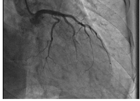
Şekil 3. Sol ön inen koroner arterdeki lezyon açıldıktan sonra alınan görüntü.

bildiren olgu raporları ve retrospektif hastane incelemeleri oldukça nadirdir. GBH zehirlenmesinden sonra birinci derece atriyoventriküler blok ile birlikte QTc uzaması gözlenebilir. Bu nedenle, hayatı tehdit eden aritmiler GBH zehirlenmesinde ölüm nedeni olabilir.