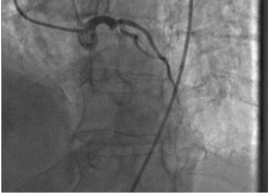
Şekil 2. Sol ön inen koroner arter proksimalindeki stent içinde tromboz görüntüsü.

sendrom tanısı ile acil olarak anjiyografi laboratuvarına alındı (Şekil 1). Hastadan yoğun bir şekilde kimyasal madde kokusu geldiğinin hissedilmesi üzerine yakınlarından alınan anamnezde 2 günden beri hastanın maskesiz olarak tarlada yabancı ot ilaçlaması yaptığı, GBH içeren bir zirai ilaç kullandığı (Touchdown Premium, Syngenta, Türkiye), bugün göğüs ağrısının başladığı ve acil servis başvurduğu anlaşıldı. Yapılan anjiyografide LAD stentinin tromboze olduğu görüldü (Şekil 2). Daha sonrasında stent içindeki lezyona PTCA işlemi yapıp tekrar koroner akım sağlandı (Şekil 3). Hastanın bu olay öncesinde halen klopidogrel, aspirin, beta bloker ve statin kullanmakta olduğu görüldü. İşlemin ardından koroner yoğun bakıma alındı ve servis takibi sonrası şikayeti olmaması üzerine taburcu edildi.