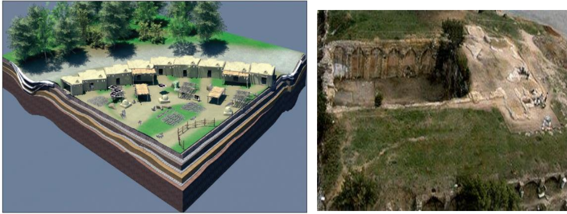
Şekil 8. Aktopraklık Arkeoparkı (Bursa) (Karul ve Avcı 2010), Şekil 9. Küçükyalı Arkeolojik Parkı (İstanbul) (Bayraktar, 2010)