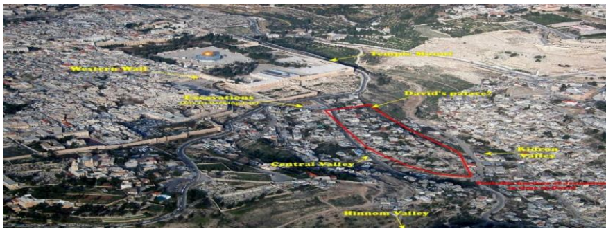
Şekil 5. Michaelerplatz Arkeolojik Parkı (Avusturya) (Anonymous. 2015c), Şekil 6. Tenochtitlan Arkeolojik Parkı (Meksika) (Anonymous. 2015 d), Şekil 7. Kudüs Arkeolojik Parkı (İsrail) (Anonymous. 2015 e)