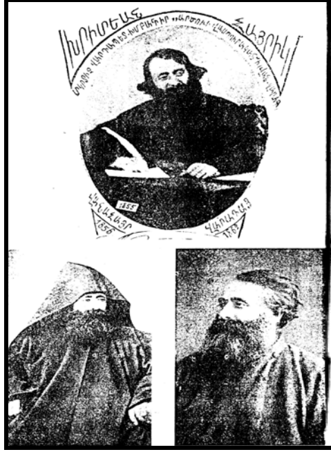
EK 1: Kilisedeki İlk Yılları