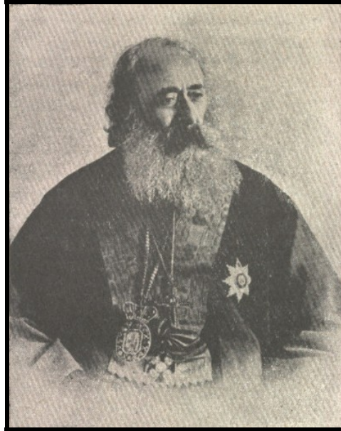
EK 2: İstanbul Ermeni Patriđi Mıgırdıç Kırımıan.