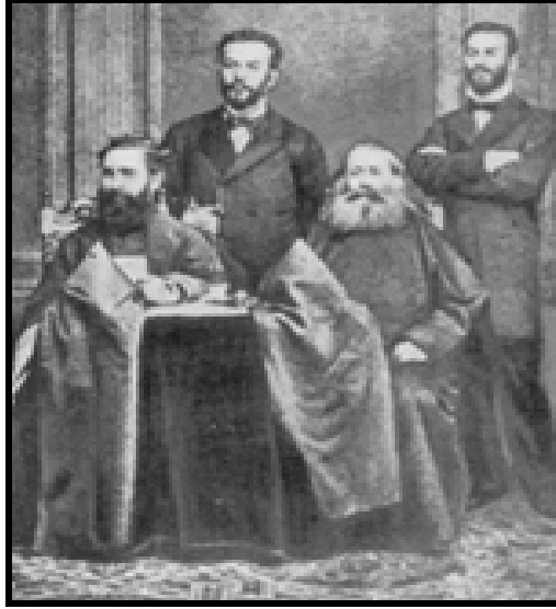
EK 3: Berlin Kongresi Heyeti