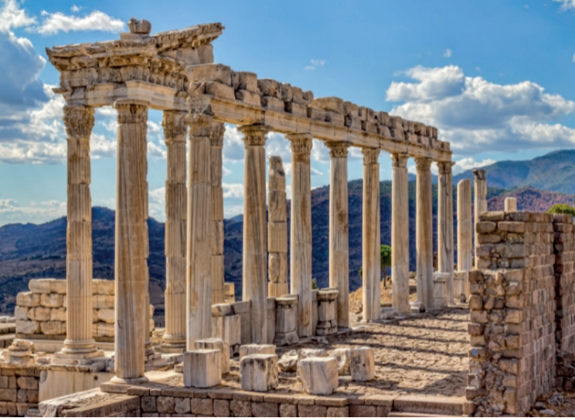
Resim 2. Pergamon (Bergama) Kütüphanesi (Britannica, 2021)

ise mozaik taşlardan yapıldığına dair bulgular çeşitli arkeolojik kazılarda ortaya çıkarılmıştır (Tunay, 1970, s. 111). Kütüphanenin aydınlatılabilmesi amacıyla pencerelerin kuzey Stoa tarafında bulunan giriş duvarında olduğu, doğu ve batı duvarlarında da ek pencereler olduğu, bu sayede güneşin hareketine göre sürekli olarak kütüphanenin aydınlık kalacak şekilde pencerelerin uygun yerlere konumlandırıldığı düşünülmektedir.