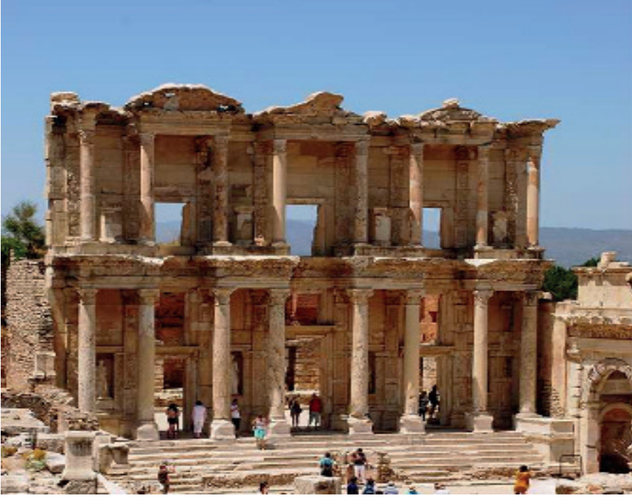
Resim 1. Efes Celsus Kütüphanesi (Kültür ve Turizm Bakanlığı, 2021)

150 yıl hizmet verdikten sonra M.S. 262 yılında çıkan Got yağmaları ile kütüphanenin tahrip edildiği bilinmektedir. Bu yağmalar sonucunda Resim 1’de de görülen kütüphanenin ön cephesi sağlam kalabilmiştir (Taşkın, 2011, s. 94). Bilim adamlarının, şairlerin ve hatiplerin konferans verdiği oditoryum 4 ’a yakın olması kütüphanenin önemini artırmaktadır. Dış cephesinde, sütun dekorasyonu iki katı kaplamış şekildedir. İlk katta sekiz sütun yer almaktadır. Sütunlar arasında yer alan üç kapı ile kütüphanenin salonuna girilmektedir. Kapıların üzerinde ışığı sağlayan süslü pencereler bulunmaktadır. Kapıların yan taraflarında bulunan payelerin yanında nişler yer almakta, bunların üzerinde elbiseli heykeller bulunmaktadır. Bu heykeller, Celsus’un Bilim, Akıl, Erdem ve Kaderi temsil eden dört kadın heykelden oluşmaktadır (Yıldız, 2003, s. 232). Kütüphane içerisinde yer alan niş boşluklarına kitap dolapları oturtulmuştur. Diğer kütüphane örneklerinde yer aldığı gibi içerisinde sütunlu bir hol bulunmamaktadır. Basamaklı merdivenler ile podium (sütun tabanı) üzerine oturtulmuş bir yapısı vardır.