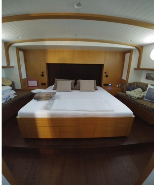
Şekil 2: 20 M Boyundaki Bodrum Guleti'ne Ait Baş Master Kabini

Günümüzde Bodrum Guletleri'nde de diğer pek çok yatta olduğu gibi, kullanıcılara pek çok iç mekan genel yerleşim alternatifi, konfor ve lüks donanım seçeneği sunulmakta, kullanıcılar, kullanım tercihleri doğrultusunda bu konulardaki detaylara karar vermektedir. Yolcu kabinlerinin çeşitliliği, kabinlerde kullanılan havalandırma, aydınlatma ve dekorasyon unsurları kullanıcının verdiği bu kararlara örnek verilebilir. Şekil 2'de 20 m boyunda bir Bodrum Guleti'ne ait baş master kabini görülmektedir.