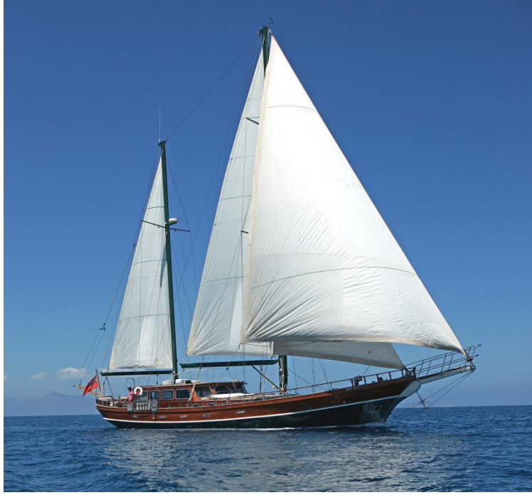
Şekil 1:25 M Boyunda Bir Bodrum Guleti

Gelişen teknoloji ve artan imalat çeşitliliği, diğer pek çok sektörde olduğu gibi Bodrum Guletleri'nin tasarım ve imalat aşamalarında esnekliği artırmış; gerek teknelerin ana boyutları, gerek ise bu teknelere konulan donanım ve ekipmanlar açısından müşterilere oldukça geniş bir alternatif yelpazesinin sunulmasında katkıda bulunmuştur. Bu durum, Bodrum Guletleri'nde müşterilere sunulan konfor ve lüks seçeneklerini artırmış, artık mega yatlarla rekabet edecek duruma getirmiştir. Her ne kadar konfor ve lüks, yat tasarımının vazgeçilmez unsurları olarak görünse de, felsefesi kullanıcıları doğayla iç içe, kültürel ve tarihsel kazanımlarla donatmak olan Mavi Yolculuk felsefesiyle şekillenen Bodrum Guletleri'nde konfor ve lüksün etkisi tartışmaya açık bir konudur. Bu araştırmada da Mavi Yolculuk ile birlikte şekillenen ve gözle görünür değişikliklere uğrayan Bodrum Guletleri'nde, konfor ve lüks unsurlarının sonuç ve etkilerinin araştırılması hedeflenmiştir.