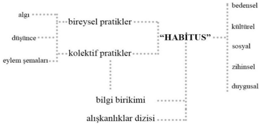
Şekil 2. Habitus kavramının insan ve çevre arasında kurulan varoluşsal ilişkisi (Yazarlar tarafından oluşturulmuştur).

Habitus kent açısından irdelendiğinde ise herkesin ait olduğu açık bir kültür olarak tarif edilmektedir [9]. Bu noktada, kent de habitusun bir parçası haline gelmektedir. Zamana bağlı olarak gelişen habitus, insanın fiziksel ve sosyal yerleşim alanı haline dönüşmektedir. Kent, insanın kültürel ve tarihsel gelişimlerine bağlı olarak gelişim göstermektedir. Diğer bir deyişle, kent ve insan birbirleriyle doğrudan bağlantılıdır, bu da habitusu meydana getirmektedir [31]. Habitus, kendimizi eski zamanların yaşantılarını bir şekilde duyumsayarak, köklü hissetmemize olanak sağlamaktadır, ki bu da habitusun oluşturmaktadır [4]. Bu anlamda, habitus kentsel mekânlarla kurulan güçlü ilişkilere bağlı olmakta ve zaman boyunca oluşan deneyimlerin bir sonucu olarak ortaya çıkmaktadır. Erzen [31], “ kentin fiziksel yapısı; biçim, yoğunluk ve kütle bakımından önemli bir role sahiptir. Bugün kent dönüşümlerinin kentin neredeyse her alanında geliştirdiği devasa yapılar, öylesine statik bir duvar oluşturmaktadır ki, kentin akışkan ve değişken zaman-mekânı durağan bir hale getirmektedir ” şeklinde bu duruma örnek vermektedir. Bu noktada, insanlar, alışkanlık ve pratik kazandıkları mekânlardan uzaklaşmakta, insanın