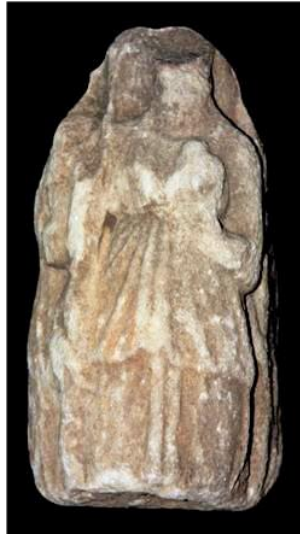
Resim 1 Kyzikos Hekatesi