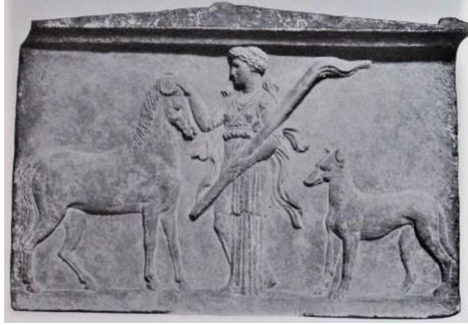
Resim 7 Krannon'dan Adak Kabartması (Kraus, 1960, Taf. 2.3)