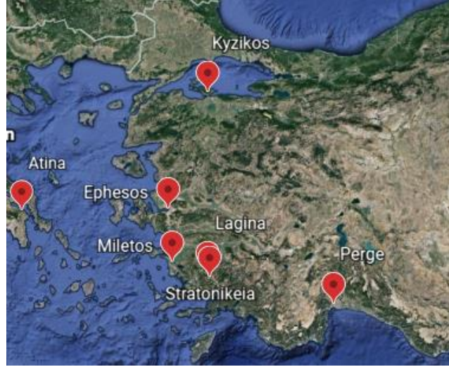
Harita 1 Kyzikos ve Hekate Kültünün Olduğu Kentler ( https://earth.google.com )