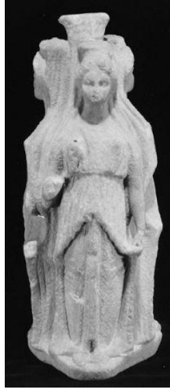
Resim 3 Üçlü Hekate (Hekateion) ( https://www.metmuseum.org )