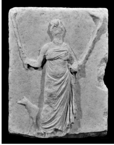
Resim 4 Kyzikos Adak Steli (Özgan, 2016, Res. 93)