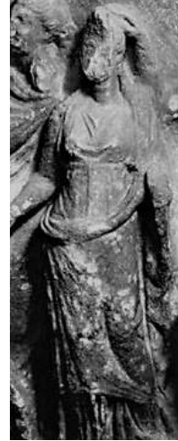
Resim 6 Lagina Hekate Tapınağı'nın Doğu Frizinden Hekate Figürü (Böker, 2010, s. 67, Res. 39)