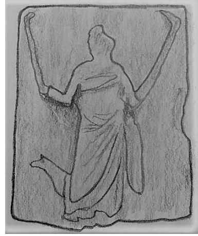
Çizim 2 Kyzikos Adak Steli