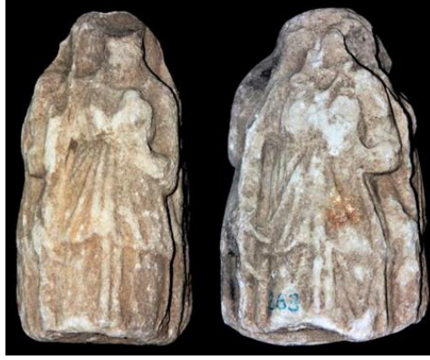
Resim 2 Kyzikos Hekatesi