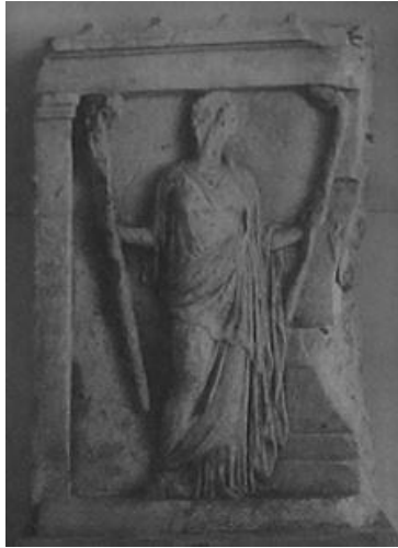
Resim 5 Pire'den Adak Steli Üzerinde Hekate (Karusu, 1969, s. 138, Taf. 42a, Nr. 1403)