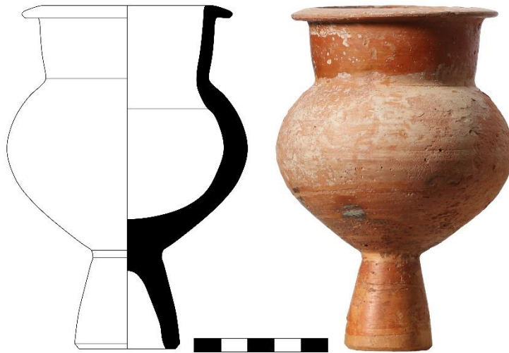
Şekil 4. Katalog 4: Bilecik Müzesi A.246 (Çizim ve fotoğraf H. Erpehlivan)

Eser tek parçadır ancak ağız ve kaide kısmında ufak kırıklar ve eksikler, yüzeyinde boyalı ve boyasız alanlarda pullanıp dökülmeler mevcuttur. Konik yüksek kaideli, küresel gövdeli, kısa ve dikeye yakın boyunlu, hafif dışa çekik dudaklı bir forma sahiptir. Dudak kısmında ince sürülmüş siyah firnis bant, gövde kaide üzerinde çok ince sürülerek açık kahverengi görüntü sergiler. Omuz ve boyun kısmında bej renkli ek boya ile bantlar uygulanmıştır (Şekil 4).