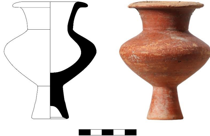
Şekil 2. Katalog 2: Bilecik Müzesi A.603 (Çizim ve fotoğraf H. Erpehlivan)

Eser altı parça halinde korunmuştur, ağız kısmından başlayarak omza kadar yayılan kırık parçalar sonradan yapıştırılmıştır. Bu kırıkların yarattığı ufak noksanlıklar ve ağız kısmında yoğun yüzey kaybı gözlemlenir. Boyun, gövde ve kaide üzerinde yer yer yüzeysel kopmalar ve boya kayıpları vardır. Konik yüksek kaideli, küçük ve bikonik gövdeli, kısa ve dikey boyunlu, dışa çekik dudaklı bir forma sahiptir. Sulandırılmış firnis boyanın çarkta dönen kaba uygulanması ile bant benzeri bezemeler oluşturulmuştur. Boyanın rengi yoğunluğa göre koyu kahverengiden kırmızıya doğru değişkenlik gösterir (Şekil 2).