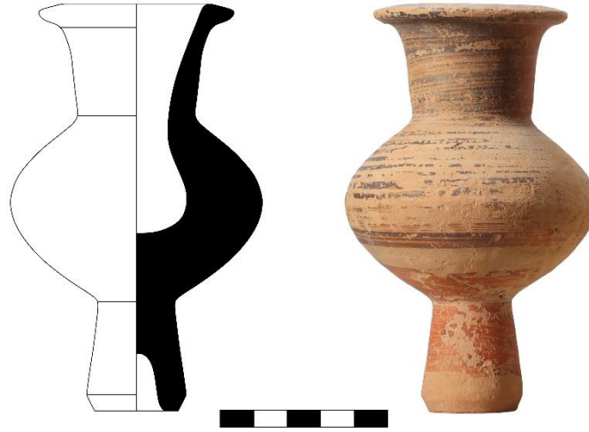
Şekil 5. Katalog 5: Bilecik Müzesi A.581 (Çizim ve fotoğraf H. Erpehlivan)

Eser tümdür ancak yüzeye sürülmüş firnis boya özellikle ağız ve omuz kısmında pullanarak dökülmüş, bu alanlarda sıg yüzeysel kayıplar da gözlemlenmektedir. Konik yüksek kaideli, küçük ve küresele yakın gövdeli, uzun ve dikey boyunlu, dışa çekik dudaklı bir forma sahiptir. Omuz ve gövde üzerinde, çarkta dönen kaba firnis boya ile oluşturulmuş bant bezemeler görülür. Boyun ve rezerve bırakılan alan hariç kaide neredeyse tamamen bezenmişken alt gövdede daha kalın bantlar oluşturulmuştur. Sulandırılarak uygulanmış firnis boya, pişirmenin etkisi ile siyahtan kırmızıya renklerde ve yarı şeffaf damarlı bir görünüm sergiler (Şekil 5).