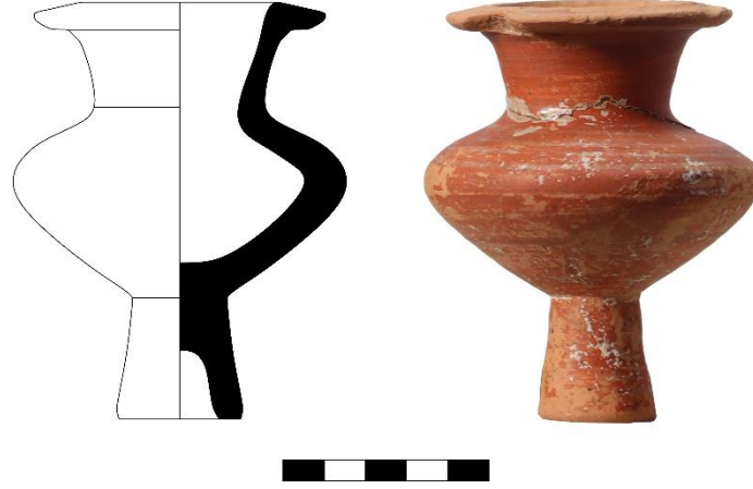
Şekil 1. Katalog 1: Bilecik Müzesi A.602 (Çizim ve fotoğraf H. Erpehlivan)