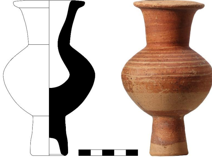
Şekil 6. Katalog 6: Bilecik Müzesi A.660 (Çizim ve fotoğraf H. Erpehlivan)