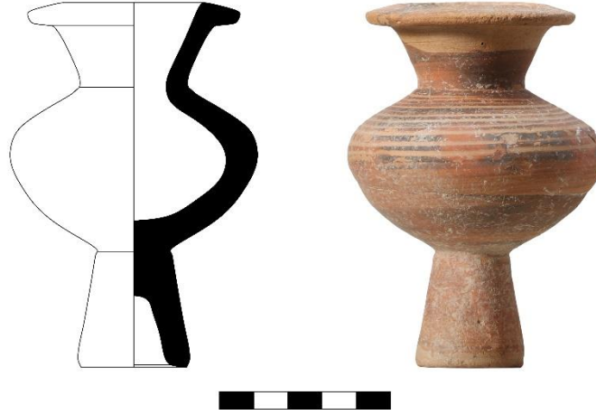
Şekil 3. Katalog 3: Bilecik Müzesi A.661 (Çizim ve fotoğraf H. Erpehlivan)

Eser tümdür, nadir yüzeysel kopmalar ve firnis boya eksikleri dışında bir eksigi yoktur. Konik yüksek kaideli, küçük ve hafif basık gövdeli, kısa dikeye yakın boyunlu, dışa çekik dudaklı bir forma sahiptir. Omuz ve gövde üzerinde, çarkta dönen kaba firnis boya ile oluşturulmuş bant bezemeler görülür. Diğer kısımlar tamamen firnislenmiştir (Şekil 3).