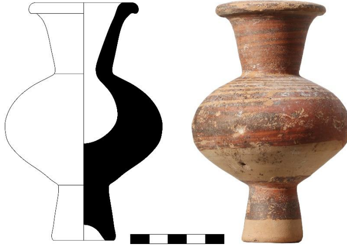
Şekil 7. Katalog 7: Bilecik Müzesi A.664 (Çizim ve fotoğraf H. Erpehlivan)

Eser tüm olmasına rağmen üzerinde yer yer pişirme sonrası oluşmuş çukurlar ve nadiren yüzeysel deformasyonlar gözlemlenir. Konik yüksek kaideli, küçük ve basık gövdeli, uzun ve dikeye yakın boyunlu, dışa çekik ve hafif sarkık dudaklı bir forma sahiptir. Omuz kısmı bantlar ise bezenmişken, ağız ve boyun tamamen bezelidir, kaidenin en altında bezemesiz bir alan bırakılmıştır. Sulandırılmış firnis boya siyahtan kahverengiye değişkenlik gösterir (Şekil 7).