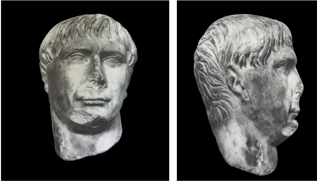
Resim 6, 7: Traianus portresi (TRP3), buluntu yeri bilinmiyor.

1979 yılında J. İnan ve E. A. Rosenbaum'un 23 birlikte değerlendirdikleri erkek başı, 2013 yılında R. Özgan 24 tarafından bir kez daha irdelenmiş ve her iki çalışmada da Traianus portresi olarak tanımlanmıştır. Bu görüş ve öneriler doğrultusunda yeniden yorumladığımız İstanbul portresindeki saç stili, Traianus'un III. tip portrelerini yansıtmaktadır 25 . Ostia 26 ve Roma'daki 27 III. tip Traianus portrelerindeki benzer saç modeli de bu görüşü doğrulamaktadır. Saç stili ile birlikte çatık kaş, belirgin elmacık kemikleri ve çökük avurt, burun kanatlarının her iki yanından aşağıya doğru inen derin kanallar, geniş üst dudak alanı, kapalı ağız ve ince dudak ile geriye doğru çekik yağlı ve yuvarlak çene, hiç şüphesiz Traianus'un kendine has karakteristik özelliklerindedir. Bu benzer fizyonomik özellikler doğrultusunda değerlendirdiğimiz İstanbul başı, bir önceki araştırmacıların da belirttiği gibi imparatorun hükümlerlik sürdüğü döneme ve özellikle de MS 108 yılına tarihlenmelidir.