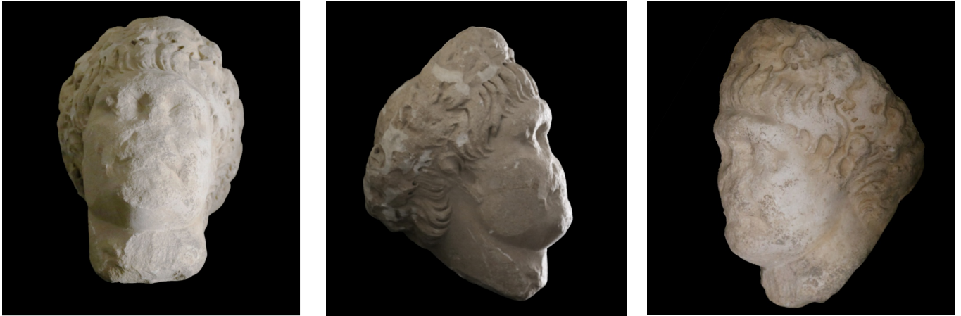
Resim 8, 9, 10: Traianus portresi (TRP4), Seleukeia am Kalykadnos.

Kesin bir tarihlendirme konusunda ise elimizde hiçbir arkeolojik verinin bulunmadığı imparator portresindeki saç stili, W. H. Gross'un gruplandırıldığı Traianus'un üç portre tipiyle de uyumlu değildir 35 . İlk bakışta eserdeki saç stili her ne kadar Oslo'daki Traianus'un III. tipini 36 anımsatmış olsa da hacimli ve uzun saç buklelerinin işlendiği saç modeli, Traianus'un III. tip portrelerinden farklılık göstermektedir. Bu yüzdendirki J. İnan ve E. A. Rosenbaum'un yeni bir tip olarak yorumladıkları bu saç stili, Traianus'un IV. tipi olarak tanımlanmakta ve MS 114 yılına tarihlenen Piraeus Müzesi'ndeki Traianus portresiyle de aynı döneme verilmektedir 37 .