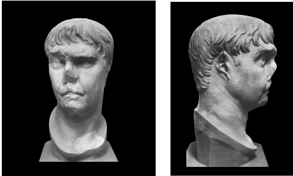
Resim 4, 5: Traianus portresi (TRP2), Pergamon.

Bu benzer saç stiliyle birlikte ciddi ve otoriter yüz yapısı, belirgin elmacık kemikleri ve çökük avurt, burun kanatlarının her iki yanından aşağıya doğru inen derin kanallar, geniş üst dudak alanı, kapalı ağız ve ince dudak ile geriye doğru çekik yağlı ve yuvarlak çene Traianus portrelerindeki fizyonomik özelliklerdendir. Bu yüzdendir ki Pergamon başını, English Country Houses 20 , Londra 21 ve Kapitolin Müzesi'nde 22 sergilenen Traianus büstleriyle de karşılaştığımızda bu görüşü doğrulamaktadır. Yapılan bu değerlendirmeler neticesinde yorumladığımız Traianus portresi, III. tip saç stilinden dolayı MS 108 yılına verilmelidir.