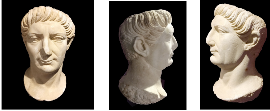
Resim 1, 2, 3: Traianus portresi (TRP1), Ephesos.

Bu görüş ve öneriler doğrultusunda yeniden yorumladığımız Ephesos portresindeki başa yapışık saçlar ile alına doğru taranan hacimli ve uzun saç buklelerinin uç kısmının dalgalı işlendiği saç stili, Oslo'daki Traianus'un III. tipiyle 10 (Decennalia tipi 11 ) büyük benzerlik göstermektedir 12 . Belirgin elmacık kemikleri ve çökük avurt, iri ve hafif kemerli burun, burun kanatlarının her iki yanından aşağıya doğru inen derin kanallar, kapalı ağız ve ince dudak, geriye doğru çekik yağlı ve yuvarlak çene ile güçlü ve kalın boyun, Ostia 13 ve Münih'teki 14 Traianus portrelerinde de gözlemlediğimiz fizyonomik özelliklerdendir. Bu fizyonomik özellikler sonucunda Traianus'un III. tipiyle ilişkilendirdiğimiz Ephesos portresini, MS 108 yıllarına vermek yerinde olacaktır 15 .