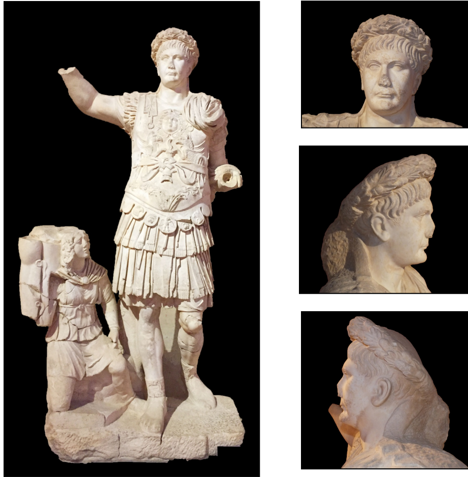
Resim 11, 12, 13, 14: Traianus portre heykeli (TRP5), Perge.