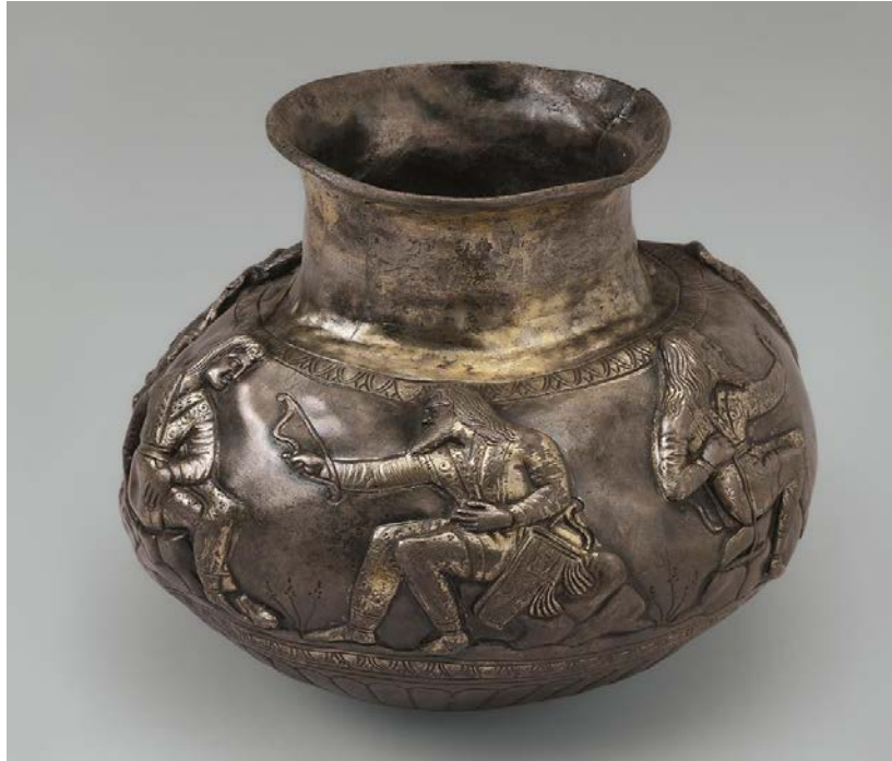
Fig. 8. Tchastje kurganından gümüş kase (Voronež yakını, MÖ IV. yy.) State Hermitage Museum, St. Petersburg.

https://www.researchgate.net/figure/Figure-Five-Vase-from-the-Kul-Oba-kurgan-in-the-Crimea-4th-century-BCE-Skythes_fig3_285316455