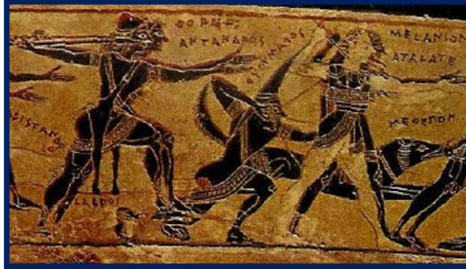
Fig. 2. François vazosu olarak bilinen Atina siyah figür krateri. Köpeklerle ava katılan İskitli okçu figürü.

https://tarihvearkeoloji.blogspot.com/2018/03/pazrktan-gordiona-turk-dunyas-ii.html