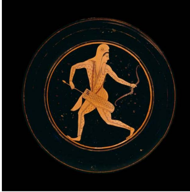
Fig. 1. Atina kırmızı figür tabağı: İskit kostümlü okçu-pantolon ( anaxyrides ), daracık kollu ceket ( kandys ) ve uzun kulak-kapaklı yumuşak deriden sivri başlık ( kydaris/kyrbasia ) giymiş haliyle.

https://www.britishmuseum.org/collection/object/G_1837-0609-59