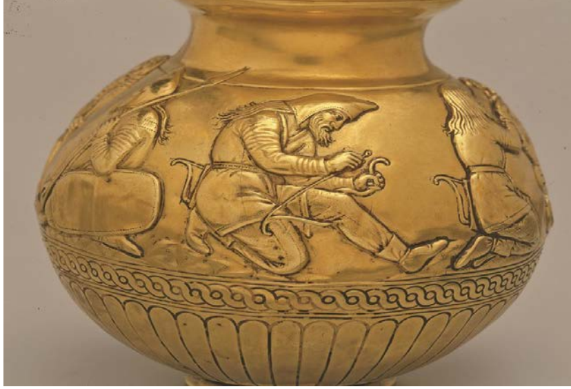
Fig. 7. Kırım'da Kul-Oba kurganında bulunan vazo üzerinde yayını çeken İskitli (MÖ IV. yy.). State Hermitage Museum, St. Petersburg.

https://www.researchgate.net/figure/Figure-Five-Vase-from-the-Kul-Oba-kurgan-in-the-Crimea-4th-century-BCE-Skythes_fig3_285316455