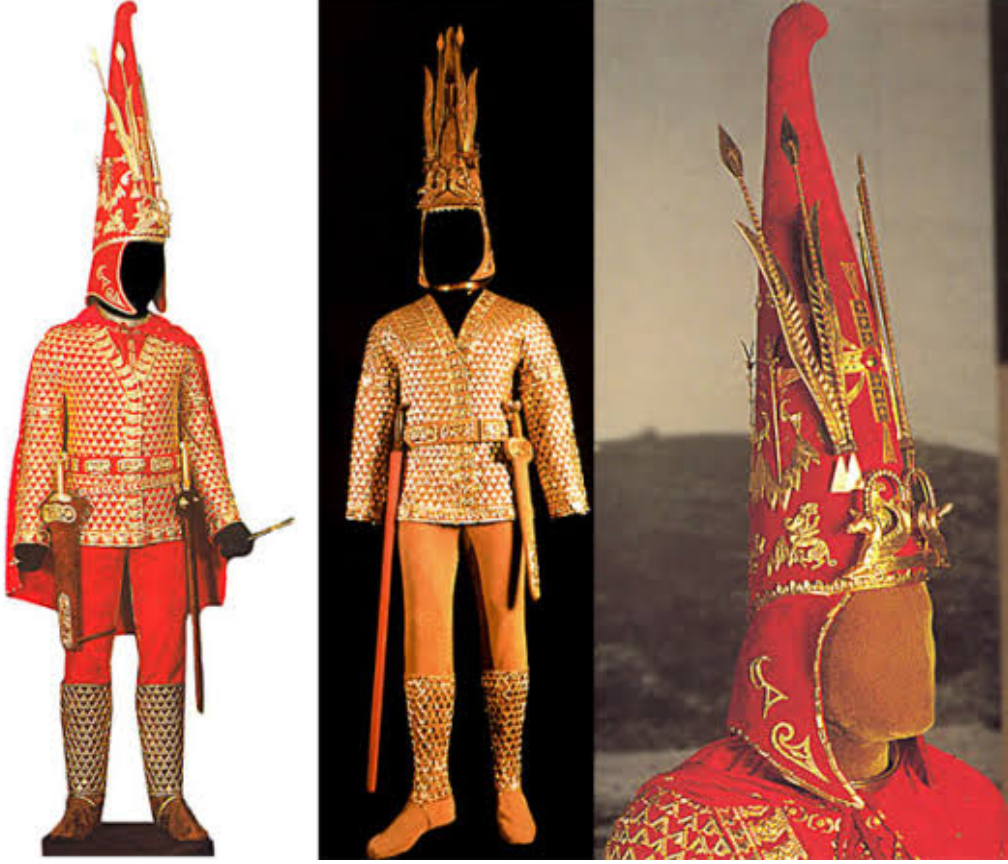
Fig. 9. Esik Kurganı, Altın Elbiseli Adam.

https://www.sanatinyolculugu.com/esik-kurgani-ve-altin-elbiseli-adam-zirhi/