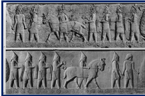
Fig. 3. Apadana Rölyefleri'nde 11. Delegasyon, genellikle İskit/Saka tigrakhauda ile bağlantılandırılmaktadır (Duran "Pers (Akhaimenid) Bağlamında Sakalar", s. 738, Figür 4).

https://tarihvearkeoloji.blogspot.com/2018/03/pazrktan-gordiona-turk-dunyas-ii.html