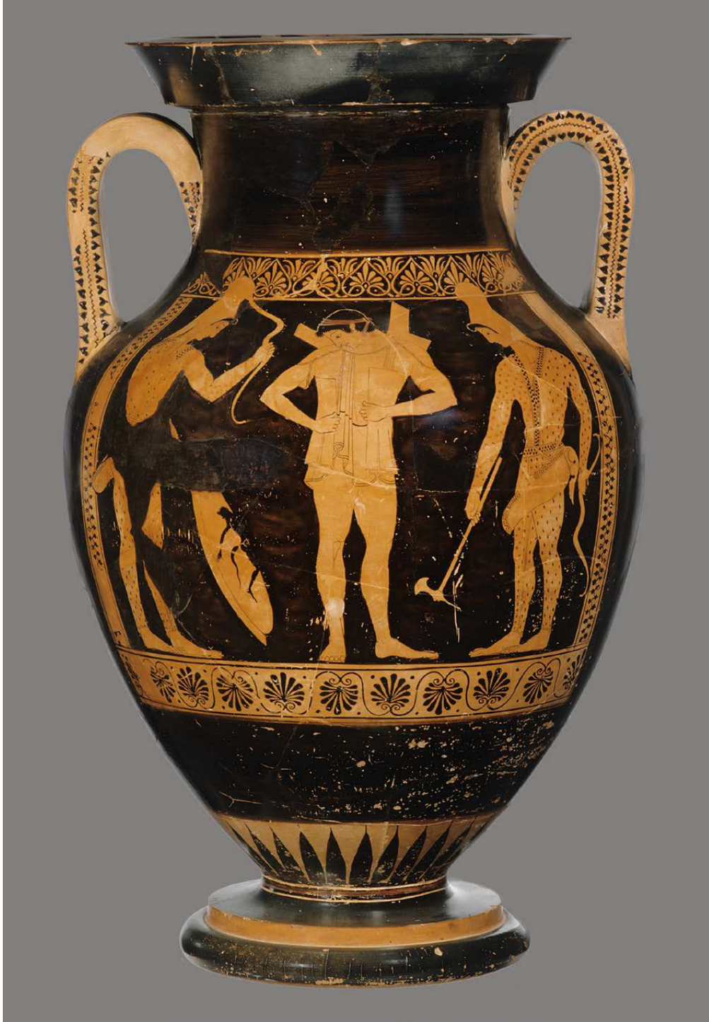
Fig. 5. Atina kırmızı figür amforası. İskit kostümü giymiş iki okçu tarafından etrafı çevrilmiş genç bir hoplites (Mayor et al. , “Making Sense of Nonsense Inscriptions Associated with Amazons and Scythians on Athenian Vases”, s. 459 Figür 3).