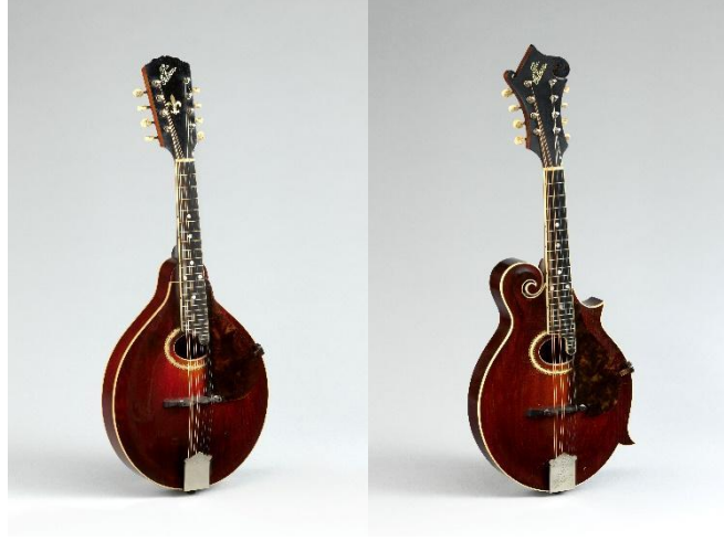
Şekil 8. Gibson, O. 'Mandolin A' ve 'mandolin F' (The Metropolitan Museum of Art)

Bu dönemde mandolin yapımında da yeniliklere rastlanmaktadır. Amerika'da Orville Gibson, 1898'de yeni bir mandolin türünü patentledi (şekil 8). Gibson mandolinleri, sanatçılar arasında bir tartışmaya neden oldu. İtalyan mandolinlerine kıyasla Gibson enstrümanları daha büyük bir rezonans bölümüne ve daha uzun sapa sahiptir.