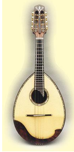
Şekil 9. Woll, A. 'Seiffert' mandolin (Woll)

1980'lerde, müzik ustası R. Seiffert ile birlikte M. Wilden-Hüsgen, klasik İtalyan çalgılarına kıyasla daha büyük gövdeye ve geniş sapa sahip yeni bir mandolin modeli geliştirdi (şekil 9), bu yenilikler çalgının dinamik ve tını aralığını genişletmeyi mümkün kıldı (Wilden-Hüsgen, Hermans, 2003).