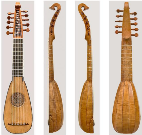
Şekil 5. Stradivari, A. Mandolin (National Music Museum)

Antonio Stradivari'nin (1644-1743) en az iki tane lavta şeklindeki enstrümanı hayatta kalmıştır. Bunlardan biri (şekil 5) Güney Dakota'daki (ABD) Ulusal Müzik Müzesi'nde bulunmaktadır. Enstrümanların yanı sıra, Stradivari tarafından yapılan bu tür aletlerin çizimleri de günümüze ulaşmıştır (Wilden-Hüsgen, 1990).