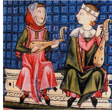
Şekil 2. Kısa Saplı Küçük Lavta (Alfonso X, Tarihsiz)

18. yüzyıla kadar küçük lavta çeşitli şekillerde adlandırılmıştır. Marga Wilden-Hüsgen (1992), küçük lavtanın adını farklı ülkelerdeki adlarından bağımsız olarak yüzyıllara göre sınıflandırmıştır: