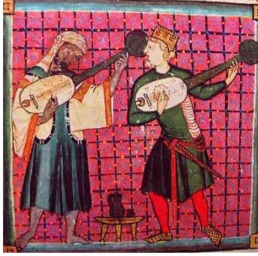
Şekil 1. Uzun Saplı Büyük Lavta (Alfonso X, Tarihsiz)