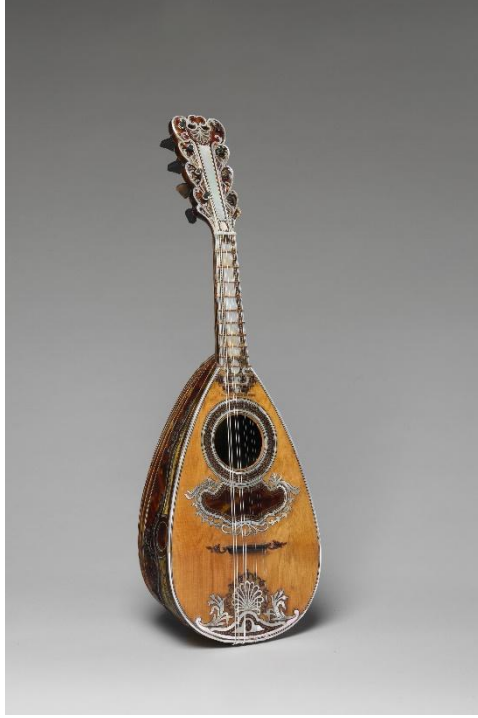
Şekil 6. Antonius Vinaccia, 1781, Mandolin (The Metropolitan Museum of Art)

Napoli mandolini besteciler arasında çok popülerdi, bunun için çok sayıda parça yazıldı ve bu parçalar günümüzde dünyadaki farklı kütüphanelerde muhafaza edilmektedir.