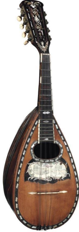
Şekil 7. Vinaccia, P. Mandolin (Lachmann, E, 1950).

1878'de İtalya Kraliçesi olan Savoylu Margaret tarafından mandolin kullanılması, çalgının gelişiminde önemli rol oynamıştır. P. Vinaccia özellikle onun için bir çalgı yapmıştır. Kraliçenin etkisiyle mandolin yüksek sosyete arasında yaygınlaşmıştı. Çalgının devlet katında bu şekilde tanınması, İtalya'da popülerliğinin artmasına ve mandolin sanatının daha da gelişmesine önemli bir ivme kazandırmıştır. Böylece 19. yüzyılın ikinci yarısında, mandolin çalma sanatında İtalya'da ve ardından tüm Avrupa'da bir canlanma başlamıştır (Adelstein, 1905, s. 5).