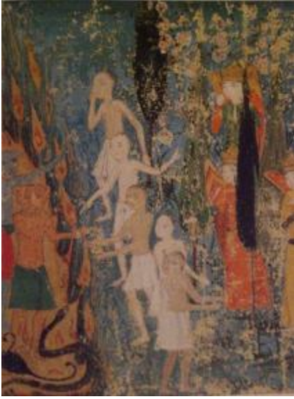
Resim 12- Sırât köprüsü: Arşın sağında Cennet, solunda cehennem, Ahvâl-i Kiyâmet, BSB Or. Oct. 1596.