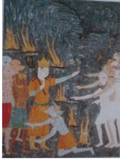
Resim 5,6- Zebanilerin, yılanlar, çıyanlar, akrepler arasında günahlıları ateşe sürüklenmesi, Ahvâl-i Kıyâmet, BSB Or. Oct. 1596.