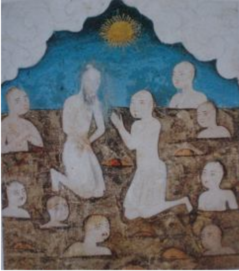
Resim 1- Mahşer günü Güneş'in iyice yaklaşmasıyla insanların terlerine batmalarını, Ahvâl-i Kıyâmet, BSB Or. Oct. 1596.