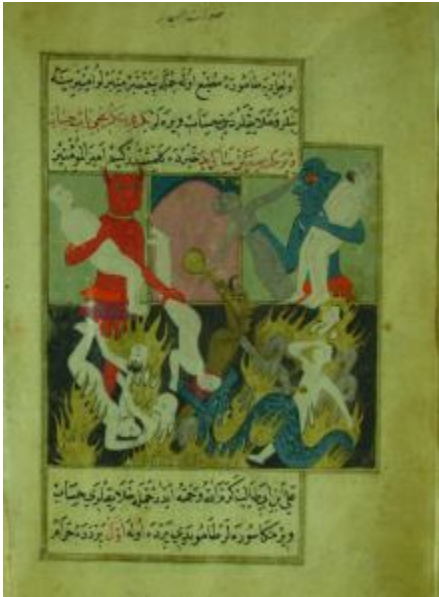
Resim 7- Cehennemde zebânilerin çıplak günahlıları ateşe atmaları, Ahvâl-i Kıyâmet, SK Hafid Efendi 139.