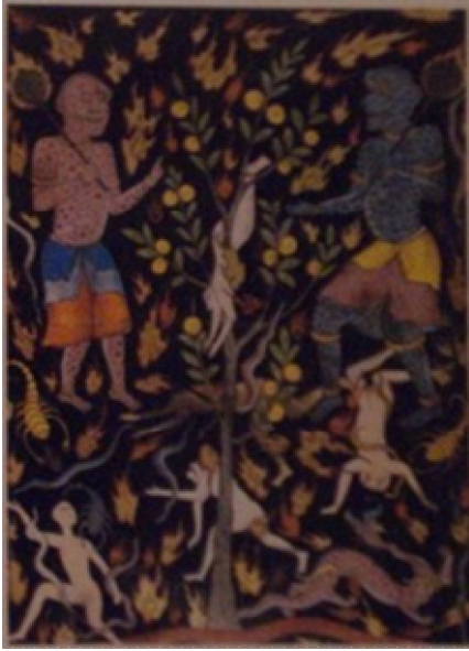
Resim 10- Cehennem, Fâlnâme, TSMK H. 1703.