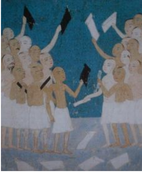
Resim 2- Amel defterlerinin gelmesi, (Günahlılara siyah, sevap sahiplerine beyaz defterler), Ahvâl-i Kıyâmet, BSB Or. Oct. 1596.