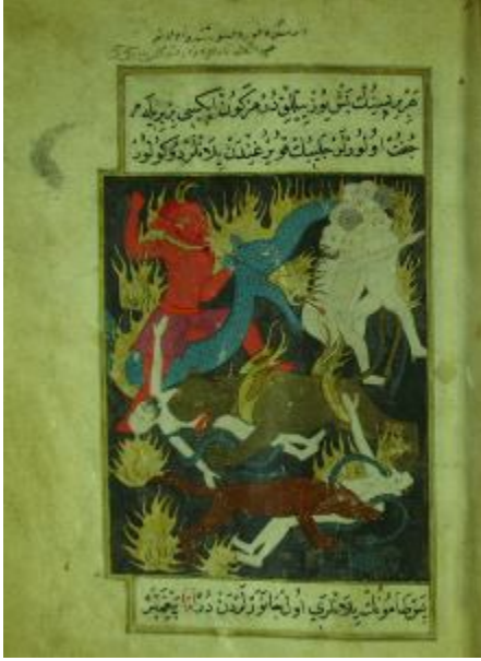
Resim 8- Cehennem, Ahvâl-i Kıyamet, SK. Hafid Efendi 139.