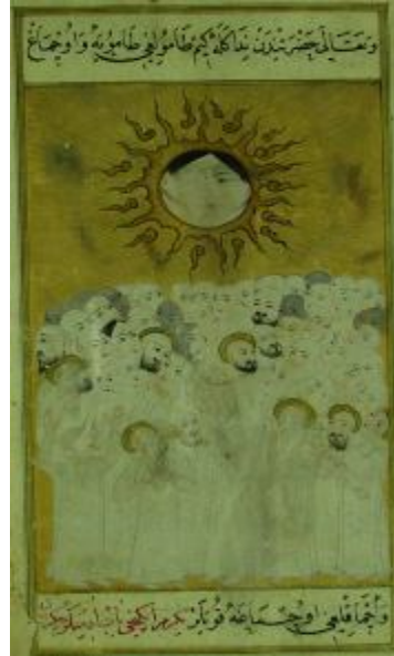
Resim 4- Mahşerde günahlıların yüzünün kararması (Ahvâl-i Kıyâmet, SK Hafid Efendi 139).