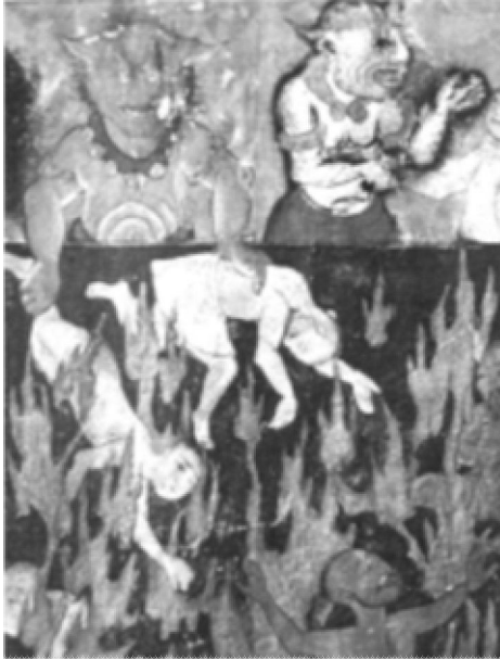
Resim 9- Cehennem, Ahvâl-i Kıyamet, PFL, LewisMs. O. T6.