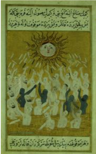
Resim 3- Tomarların gelmesi.