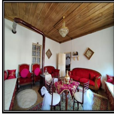
Görsel 7-8. Askeraga Konađı Selamlık ve Haremlık