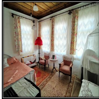
Görsel 9-10. Askeraga Konađı Ayşe Hatun Odası