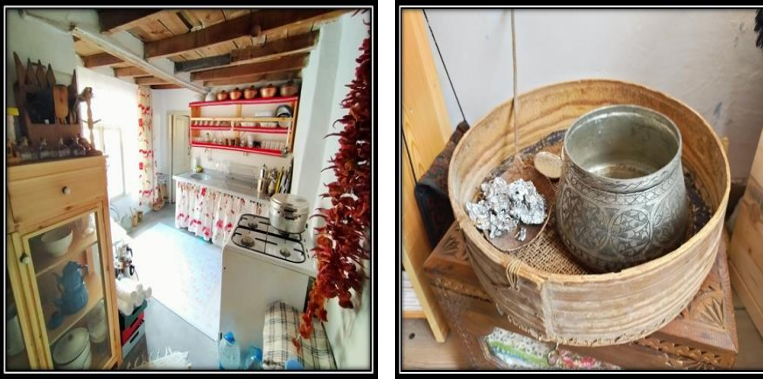
Görsel 15-16. Askeraga Konağı Mutfağı