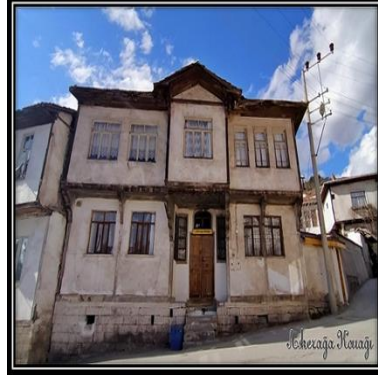
Görsel 1-2. Askeraga Konağı