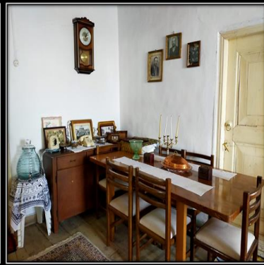
Görsel 11-12. Askeraga Konađı İç Mekân