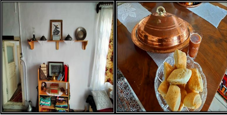
Görsel 13-14. Askeraga Konağı İç Mekân