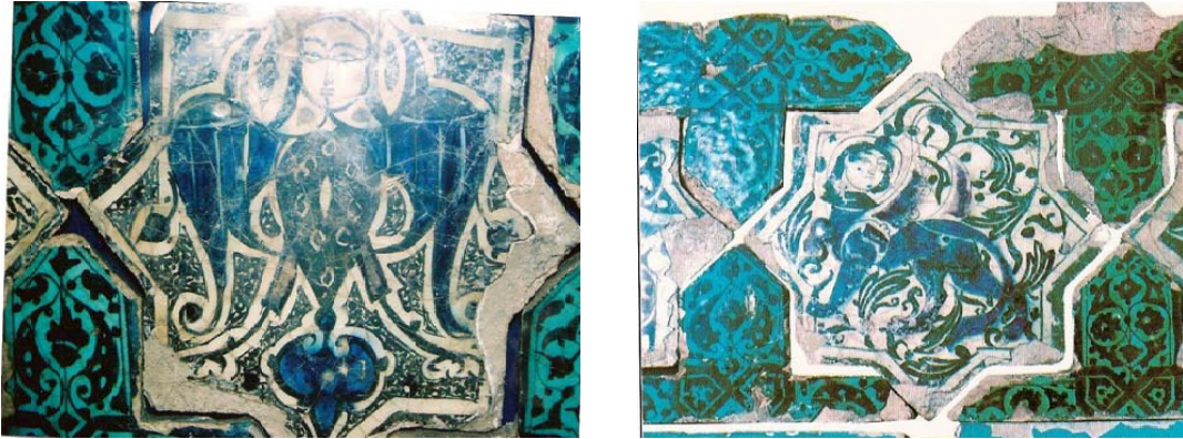
Görsel 7. Konya Alaeddin Sarayı'ndan Fantastik Hayvan Üslupları

Uzay Fili adlı tasarım, Geleneksel Türk Süsleme Sanatları içinde bir yere konumlandırılmak istenirse figüratif süsleme ana başlığı altında yer alan fantastik hayvan üslubuna uygun bir çalışmadan söz edilebilir. Buna örnek olarak Konya'daki Alaeddin Sarayı'nda bulunan insan başlı fakat kanatlı bir hayali yaratık ve yine insan başlı aslan gövdeli figür verilebilir (Yılmaz, 1999: 434) (Görsel 7). Konuya bir başka boyuttan yaklaşmak gerekirse, Türk Dünyası için oldukça önemli olan Orhun yazıtlarındaki taş bloklara işlenen yazmalardan biri, bir kaplumbağa tarafından taşınmaktadır. Bu misal Türk Sanatı'na örnek teşkil eden bir çalışma olarak farklı bir kulvarda yer almasına karşın, bir hayvanın üzerine konumlandırılması adına dikkat çekicidir (Görsel 8).