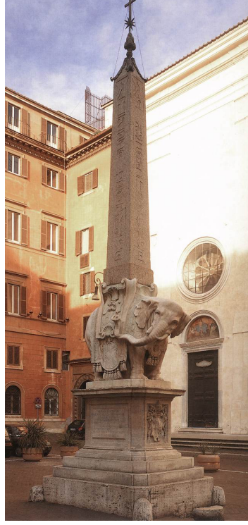
Görsel 6. Fil ve Dikilitaş, Gian Lorenzo Bernini, 1667, Mermer/Yontma, Roma.