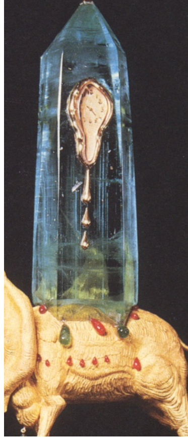
Görsel 3. Yansımaya Oluşan Yeşil Tonlar