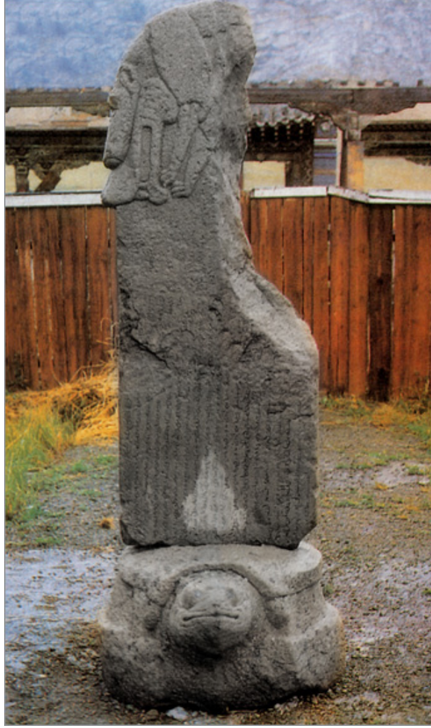
Görsel 8. Orhun Yazıtları, Kül Tikin Anıtı