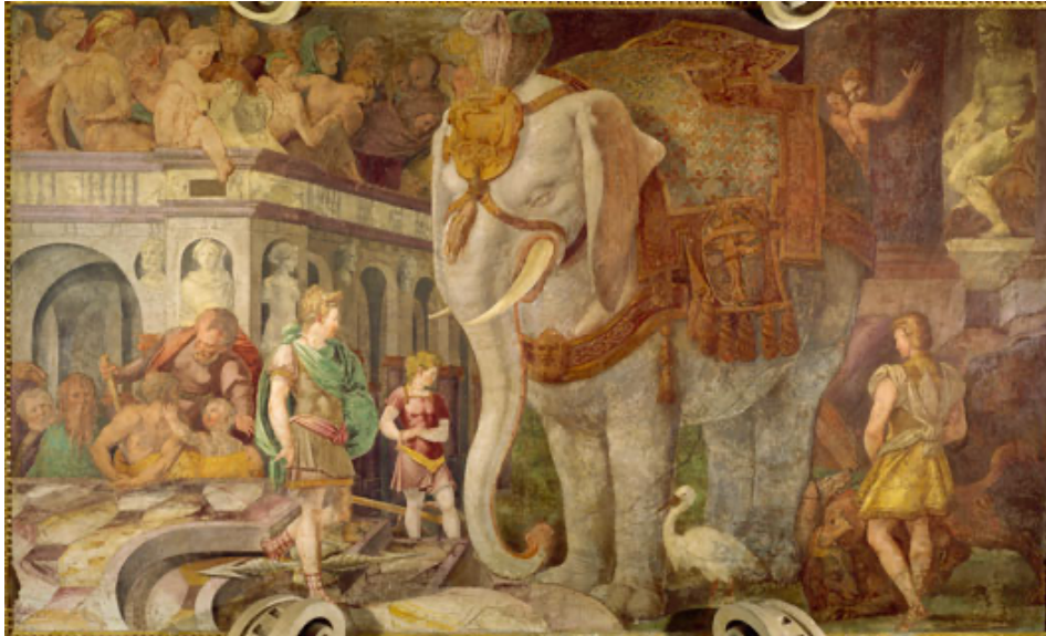
Görsel 9. Rosso Fiorentino, L'Eléphant Royal, 1533-1539, Fresk, 2.78 x 1,67 m, Fontainebleau, Fransa