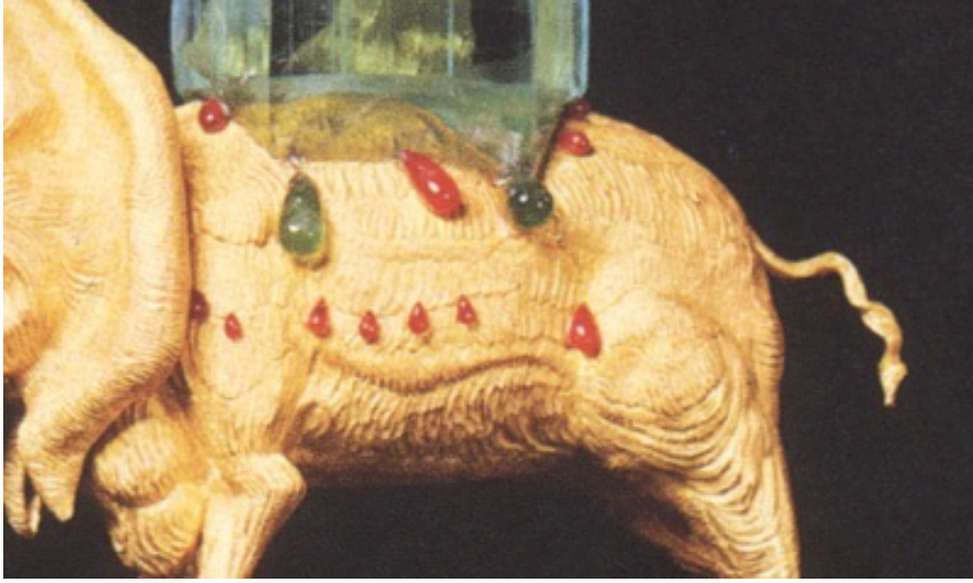
Görsel 2. Doku ve Ritim

Biçimlerin bir kısmı geometrik olarak ifade edilebildiği gibi daha büyük bir kısmı tamamen serbest bir görünümde (Güngör, 1983: 12). Dali tarafından ortaya konan bu eserde ise fil serbest yani dinamik bir formdur, piramidal kütle ise geometrik bir yapıda olduğundan statik yani durağan olarak nitelenebilir. Herhangi bir yüzeyin özelliklerini sanat alımlayıcısına aktaran, eserin hissedilebilir nitelikleri dokuyu oluşturur (Karabulut, 2020: 14). Nesnelere kendi özelliklerini belli eden bir dış yapı karakterine sahiptirler (Bigalı, 1984: 307). Dali, filin hortumunda düzenli taramalar yaparak, gövde ve diğer kısımlarında da düzensiz çizgilerle vücudundaki tüylü veya kırıksık yapıyı izleyiciye vermiştir. Bu tüylülük veya kırıksık hissi uyandıran çizgisellik aynı zamanda sanatın elemanlarından olan dokunun başarılı bir şekilde tasarımda uygulandığını göstermektedir. Çünkü doku, malzeme üzerinde pürüzlülük tesiri vermesi beklenen bir elemandır. Malzemenin kendi doğasında olan dokunun haricinde estetik tasarım kaygısı ile yapılan görsel yüzey değerlendirmeleri yapay dokuyu oluşturur. Dali'nin Uzay Fili adlı tasarımı yapay dokuya örnektir (Görsel 2).