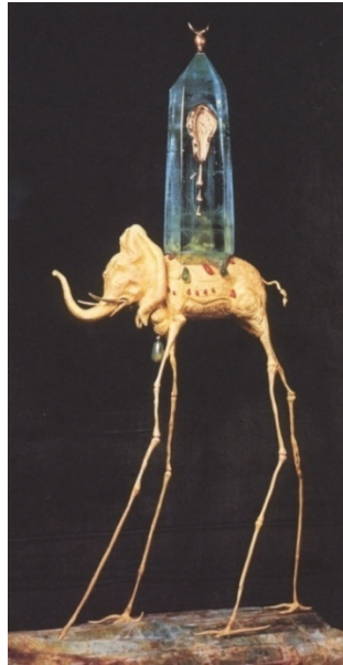
Görsel 1. Salvador Dali, Uzay Fili, 1961, Altın Döküm, 68 x 35,5 x 21 cm, Dali Theatre-Museum.

Anlatımsal olarak Uzay Fili aldış eserde dört bacak üstünde taşınan bir beden, yürüyen bir hayvan figürünü tasvir eden bir çalışma söz konusudur. Günlük yaşam pratiklerinden yola çıkarak, yani bazı benzetmeler ile analogi yaparak bu çalışmada bir fil gövdesi, yüzü, kuyruğu ve sırtında taşıdığı bir yükten söz edilebilir. Ayak ve bacaklar ise olağan dışı bir anlatım sergilemektedir. Ayaklar bir kuş veya kümes hayvanına ait iken bacaklar ise oldukça fazla ekleme sahip olduğundan örümcek bacağı veya leylek bacağı gibi tasvir edilmiştir (Görsel 1). Ortaya konan bu tasarımın anlatımsal olarak tasviri sadece bir paragraf ile sınırlı tutulmuştur. Tasarımın hikâyeleştirilmesi ve betimleme cümleleri araştırmayı plastik dilden uzaklaştırır. Diğer taraftan sanatsal üretimlerde konu, sanatçının üretkenliğine aracılık yapmaktan başka bir şey ifade etmemektedir (Yetkin, 1963: 10).