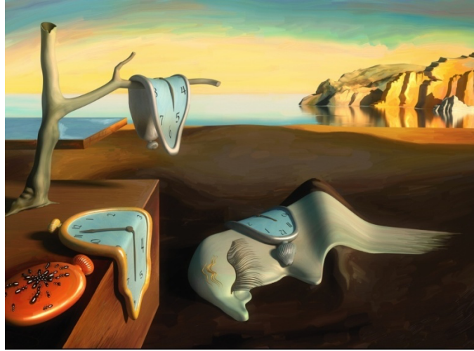
Görsel 5. Salvador Dali, Eriyen Saatler, 1931, Yağlı Boya, 24cm x 33cm, Museum of Modern Art.