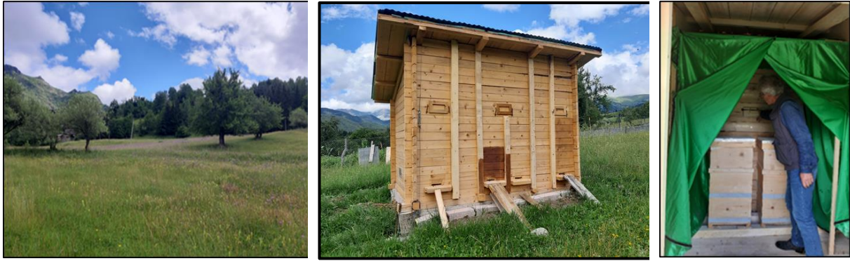
Şekil 3: Şavşat İlçesine Bağlı Aşağısüles Köyünde Arıcılık Faaliyetlerinde Yeni Örnekler Denenmektedir.

Arıcılık yanında, evlerin çevresindeki bostanlarda sebze ve meyve yetiştirilmektedir. İşgücünün yettiği kadarıyla ekim dikim yapılması, hem ailelerin doğal gıda temini hem de maddi tasarruf ile ilişkilidir. Emekli aylıklarının geçim için yetersiz olduğu ve ek kazanç için tarımsal faaliyetlerin sürdürülmek istendiği belirtilmiştir. Nitekim emekliler, “şehirden uzaklaşıp köye döndüğümüz için buradaki fırsatları gücümüz yettiğince değerlendirip, burada kalan ömrümüzü sağlıklı geçirelim istiyoruz” şeklinde ifade de bulunmaktadır.