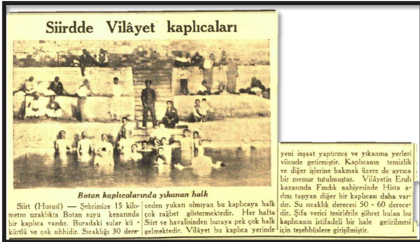
Cumhuriyet, 28.11.1936, s. 5.